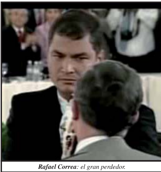
Rafael Correa: el gran perdedor.

militarmente. La Declaración Final firmada por todos los presidentes rechazó la "violación a la integridad territorial de Ecuador" , tomo nota "con satisfacción, de las plenas disculpas que el Presidente Álvaro Uribe ofreció al Gobierno y al pueblo de Ecuador (...) registramos el compromiso del presidente Álvaro Uribe de que estos hechos no se repetirán en el futuro bajo ninguna circunstancia (...) Reiteramos nuestro firme compromiso de combatir las amenazas a la seguridad de todos sus Estados, provenientes de la acción de grupos irregulares o de organizaciones criminales, en particular de aquellas vinculadas a actividades del narcotráfico" . (ABN