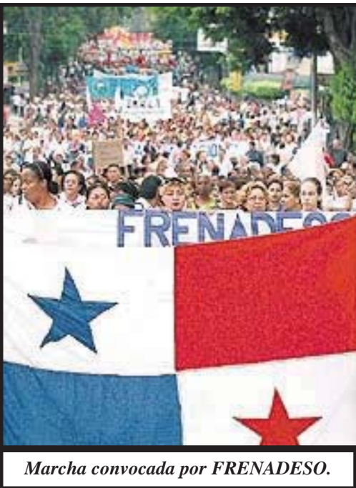
Marcha convocada por FRENADES.

de manera conciliadora, intentando desmontar esa posible coalición, anunciado la creación de una mesa de negociación con los médicos, para darle seguimiento de los acuerdos del año pasado.