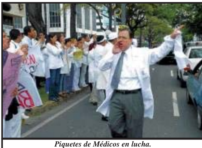
Piquetes de Médicos en lucha.

El SUTRANCS demandó incluir en el reglamento de seguridad, que debe aprobar el Consejo de Ministros, la instalación de clínicas en centenares de obras, lo que rechaza la Cámara Panameña de la Construcción