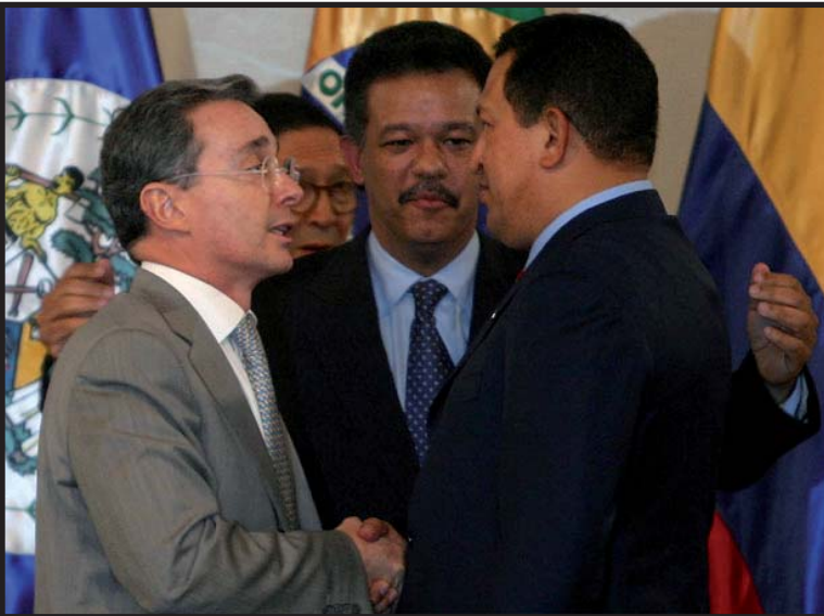
Los discursos antiimperialistas de Hugo Chávez se apagaron durante la Cumbre del Grupo de Río.

Después de una serie de cabildos y reuniones, Correa dijo sentirse satisfecho por la resolución de la OEA que establece que Colombia “violó la soberanía e integridad territorial” de Ecuador con su despliegue militar contra la guerrilla de las FARC, pero la OEA no condenó al gobierno de