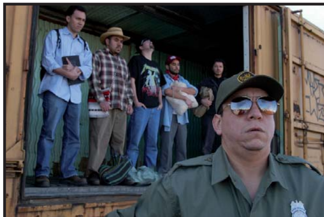
Inmigrantes hondureños capturados en el borde fronterizo entre México y EE.UU.

que hemos mencionado creemos que es necesario, que haya una verdadera reforma agraria, incluyendo la promulgación de un Decreto Ejecutivo orientado a detener la amenaza de los transgénicos, La derogación del salario diferenciado, el respeto a la libre sindicalización, en las Maquilas. Además de un estricto control de precios que detenga las alzas a los productos de consumo popular; la nacionalización de la importación de los combustibles; el fortalecimiento de las empresas del Estado; ENEE, SANAA, HONDUTEL; la derogación de los contratos de SEMEH y las plantas térmicas. La Educación pública gratuita en todos los niveles educativos con todos los beneficios para la población estudiantil, dejando a un lado las medidas represivas y de exclusión que actualmente se aplican. Salud pública con medicinas y atención oportuna en el sistema hospitalario central y el Instituto Hondureño de Seguro Social que efectivamente beneficie a los derechohabientes.