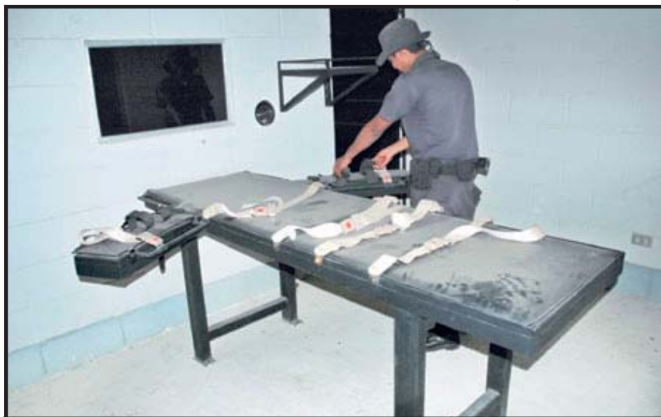
El verdugo prepara la Cámara de Ejecuciones.

Inteligencia Estratégica del Estado y el Estado Mayor de la Defensa, así como una inspectoría general que vele por la rendición de cuentas. La idea es crear un sistema de inteligencia para recopilar y analizar datos que afecten la seguridad pública y nacional. Sin embargo el temor está en la doctrina que sustente este sistema, pues todo parece indicar que va en la misma línea del estado contrainsurgente: la represión a la protesta social, el prejuicio a sectores estigmatizados como jóvenes y mujeres entre otros, así como la doctrina antiterrorista venida del Norte que pone a todo