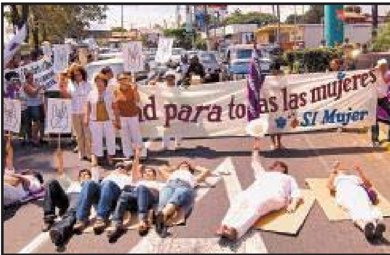
Protesta de Mujeres realizada el 7 de Marzo del 2008.

Las mujeres debemos dar un paso adelante, organizándonos para dar una lucha clasista por las