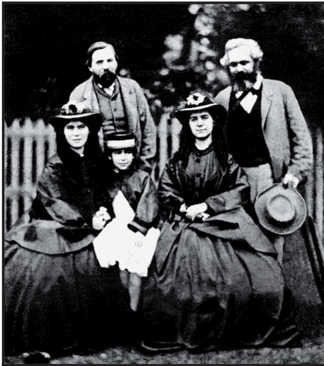
Federico Engels, Carlos Marx y su familia.

la superación del capitalismo y el advenimiento de aquello que tanto temía la Europa contrarrevolucionaria, el comunismo. Asimismo enseñó al movimiento obrero, que solo este podría instaurar una sociedad igualitaria, ya que solo los obreros, por sus condiciones materiales podrían hacer la revolución que destronaría de su podio a la burguesía, así es