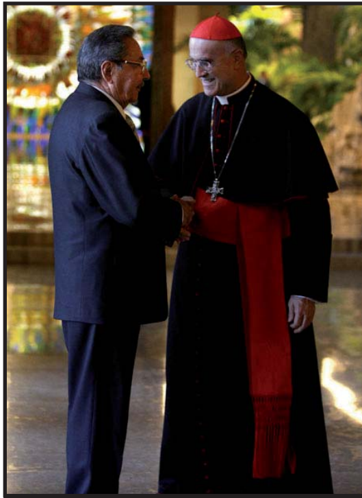
Raúl Castro, saluda al secretario de Estado del Vaticano, Tarcisio Bertone

Las libertades democráticas son la tarea transicional mas importante, no cualquier democracia; sino una apoyada en las organizaciones obreras y campesinas, que garantice la libertad de expresión y de prensa, de asociación que permita organizaciones obreras y campesinas clasista que se distancien y combatan políticamente al PCC. A nivel económico la batalla es inmensa, deben ser los obreros y campesinos quienes controlen las empresas estatales y distribuyan los ingresos; el problema de la tierra posee profundas implicancias, por lo que tendrán que ser los organismos de masas quienes realicen una nueva reforma agraria que garantice la justa distribución y explotación de la tierra. Sólo así, Cuba seguirá siendo un Estado Obrero, de lo contrario, seguirá el mismo sendero al que la burocracia estalinista guió a la URSS en el siglo pasado: la restauración capitalista. ■