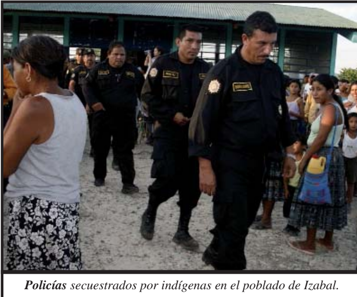
Policías secuestrados por indígenas en el poblado de Izabal.