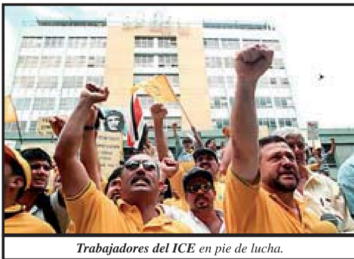
Trabajadores del ICE en pie de lucha.

Nuevamente, el asunto reside en quien dirige la lucha y con que métodos. Corresponde a los sindicatos tomar la conducción del Movimiento Patriótico, para dirigir la lucha y crear la más amplia alianza social con la clase media y los sectores populares, con el objetivo inmediato de derrotar la agenda complementaria.