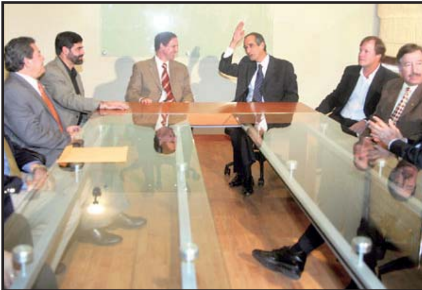
Colom reunido con la alta dirigencia del CACIF.

A nuestro criterio, luego de un período de consenso y acuerdo entre la burguesía y Colom, las diferencias en torno al financiamiento de los programas sociales redundarán en que éstos serán puestos en práctica a medias. El futuro presidente no tendrá el interés para tener un encuentro