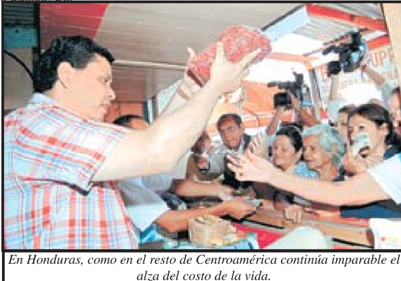
En Honduras, como en el resto de Centroamérica continúa imparable el alza del costo de la vida.

problema solo se solucionara, cuando el capital privado sea tocado para que no solo los precios de la canasta básica se mantengan estables. Se le deben cobrar impuestos a las empresas tanto nacionales como imperialistas, para así garantizar el precio barato de la energía y el transporte en general.