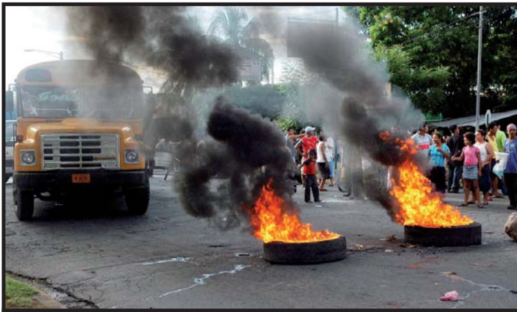
Comerciantes del Mercado Oriental protestan contra Unión Fenosa.

Sin duda son los pequeños comerciantes los mas afectados por los prolongados racionamientos. El pasado 7 de noviembre centenares de comerciantes del Mercado Oriental le "elevaron la parada" a Fenosa, realizando un mitín frente a una sucursal de dicha compañía.