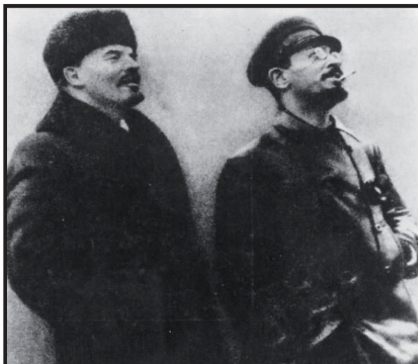
Lenin y Trostky fueron los grandes dirigentes de la Revolución Rusa.

El escenario estaba montado, ambas fuerzas esperaban la chispa que daría inicio a la revolución. Esta la encendería Kerenski, al intentar cerrar por la fuerza a dos periódicos