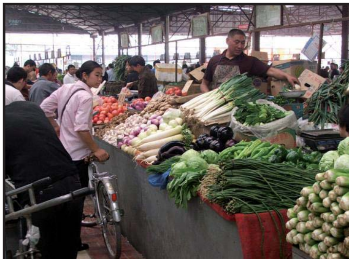
La actual carestía de la vida es insostenible para los trabajadores.