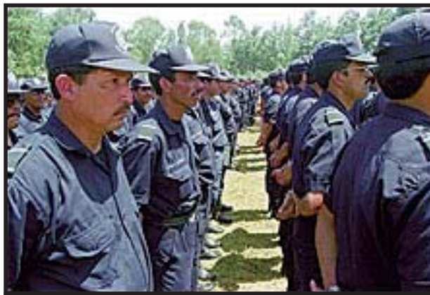
Bajo el pretexto de combatir la inseguridad están fortaleciendo los cuerpos represivos del Estado.

Se tiene previsto entre otras cosas la puesta en marcha de redes de comunicación, sistemas de circuito cerrado y botones para la activación de alarmas enlazadas directamente con la Policía Nacional Civil (PNC), lo cual pone de manifiesto que las autoridades San Carlistas tienen como principal objetivo coartar los derechos del estudiantado a través de medidas que benefician única y exclusivamente los intereses burgueses de los oligarcas que temen un inminente repunte de los grupos de izquierda.