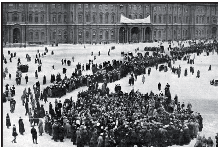
1917.- El Partido Bolchevique encabeza manifestación frente al Palacio de Invierno.

serían la base del nuevo Estado, eran los órganos más democráticos que ha conocido la humanidad, sus diputados eran electos por las bases, ya sean campesinas u obreras, podían ser removidos de sus cargos en cualquier momento si no respondían a los intereses de las bases y recibían el mismo salario que cualquier obrero ruso de la época, solo por mencionar algunas de sus particularidades.