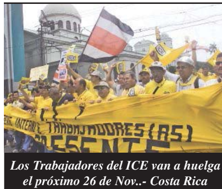
Los Trabajadores del ICE van a huelga el próximo 26 de Nov.- Costa Rica