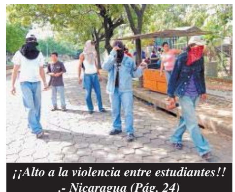
¡¡ Alto a la violencia entre estudiantes!! .- Nicaragua (Pág. 24)