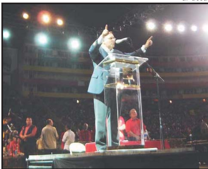
Mauricio Funes arenga a la Convención Nacional del FMLN.

En relación al funcionamiento de la economía, Funes dijo que “una cosa es que desde el gobierno se creen condiciones para el surgimiento de una fuerza empresarial pujante, que además de beneficiarse del crecimiento económico, promueva el desarrollo de la sociedad, y otra muy diferente es que la gestión pública esté dedicada a favorecer a unos cuantos empresarios, cada vez menos, en detrimento del resto de la sociedad, con exclusión de otros que