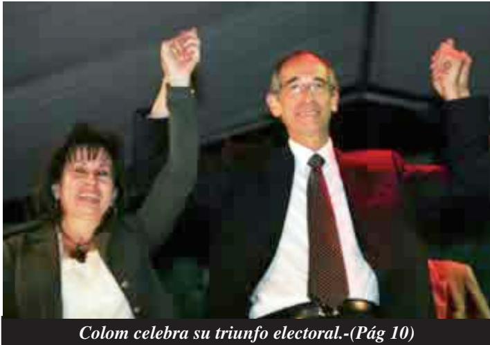
Colom celebra su triunfo electoral.-(Pág 10)

Los sindicatos y la izquierda deben luchar por sus reivindicaciones: