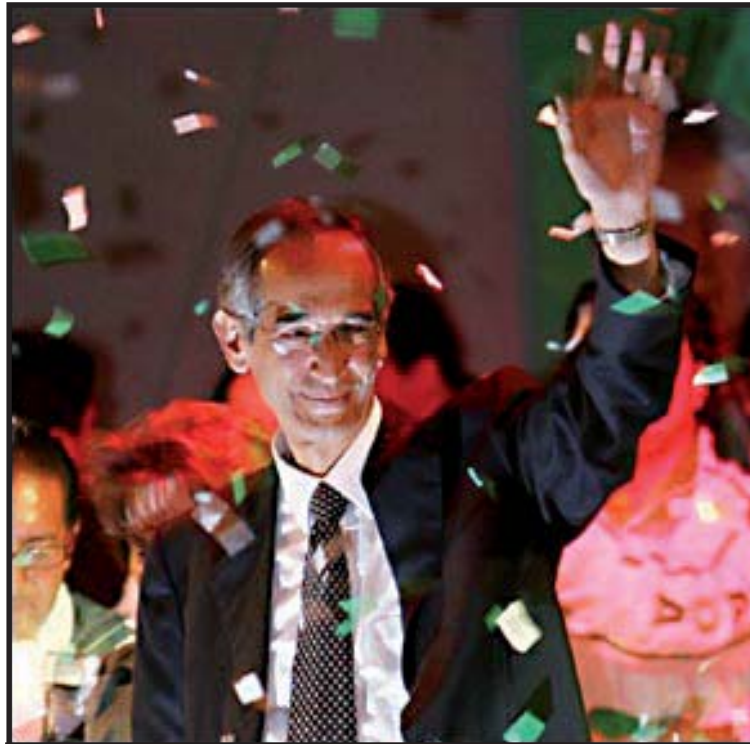
Álvaro Colom ganó la Presidencia en su tercer intento.

Con todo, Colom no está en un lecho de rosas. Las promesas de bienestar social hechas durante la campaña electoral requieren un incremento del 35% en el presupuesto del gobierno para ser cumplidas. Esto provocaría un déficit del 7% del PIB (Q14,628 millones) (Diario Siglo 21, 22/10/07).