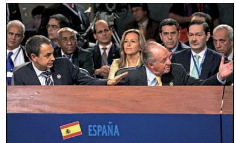
Intereses ocultos en la Cumbre Iberoamericana.- Internacional (Pág 12)

Cuando el proletariado tomó el cielo por asalto. 22