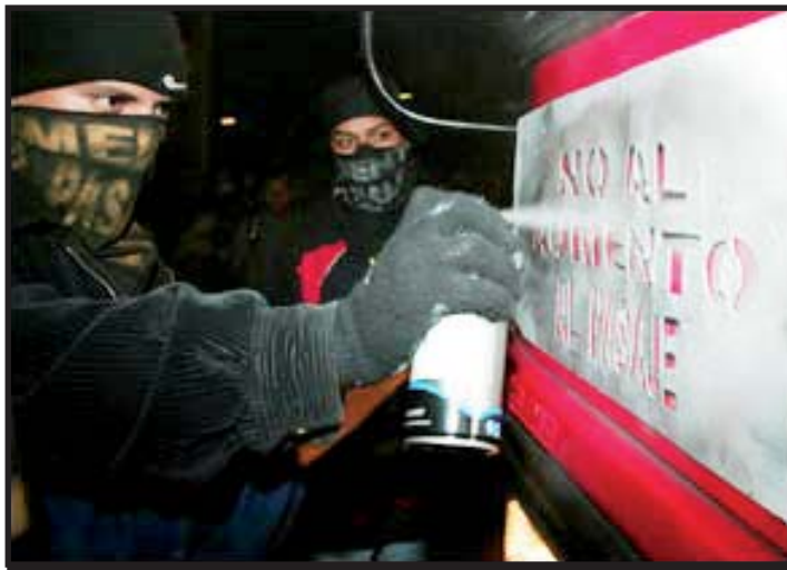
Protestas estudiantiles contra el alza del pasaje

Después de varias reuniones de negociación el gobierno acordó aumentar el subsidio a Q22.5