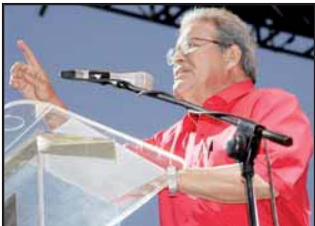
Salvador Sánchez Cerén fue confirmado como candidato a la Vicepresidencia por el FMLN.

En su discurso, Sánchez Cerén infundió ánimo a la multitud. A pesar de que se le considera representante del ala dura dentro del FMLN, dijo que “junto a Mauricio Fúnes, nuestro