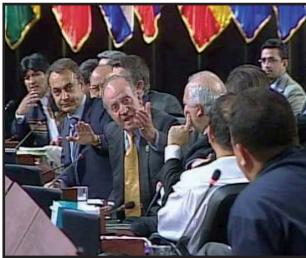
La Soberbia del Rey Juan Carlos de Borbón: ¿Porqué no te callas?

Este punto reviste una singular importancia, por que mientras los presentes Hugo Chávez y Daniel Ortega cuestionaban verbalmente al gobierno y empresas españolas, absolutamente todos los presidentes coincidieron en mantener, fortalecer