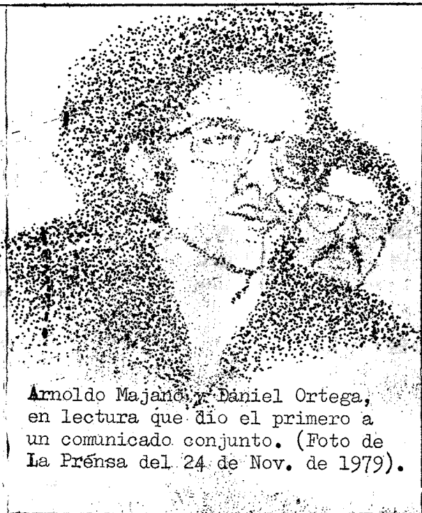
Arnoldo Majano y Daniel Ortega, en lectura que dio el primero a un comunicado conjunto.