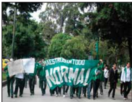
GUATEMALA.- Marcha de Estudiantes Normalistas

HONDURAS:- Libertad inmediata para Bertha Cáceres!! Alto a la persecución contra COPINH!!