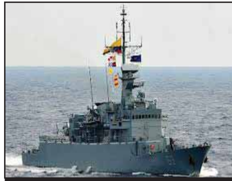
CENTROAMÉRICA.- Conflicto regional por el mar Caribe