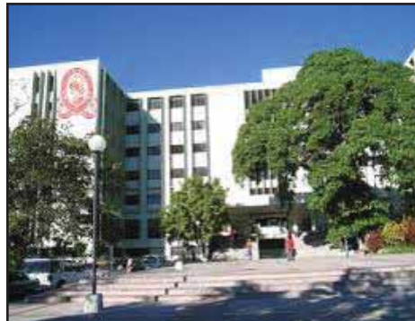
EL SALVADOR.- Crisis financiera en la UES