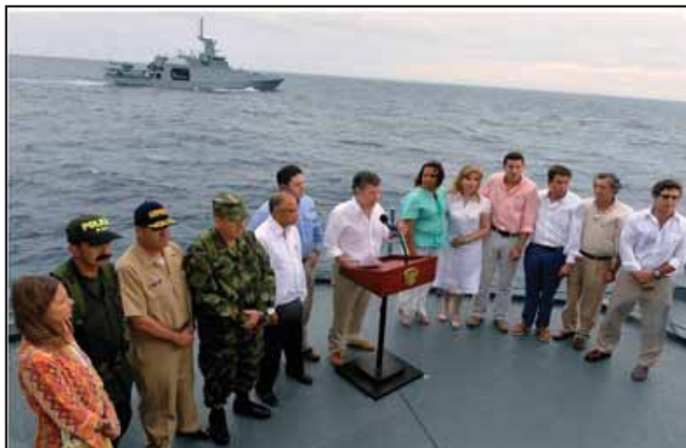
Juan Manuel Santos amenaza desde una fragata

La burguesía colombiana logró lavar los miles de millones de dólares del auge del narcotráfico, y hoy es una de las más fuertes de América Latina. Las empresas colombianas andan a la caza de activos en toda la región. Colombia compite directamente con México y Venezuela por su influencia comercial en Centroamérica y el Caribe. Desde hace 10 años el PIB de Colombia logró superar de manera individual a Venezuela, Chile, Perú y Argentina. Es la segunda economía de Sudamérica y la tercera de América latina, después de Brasil y México.