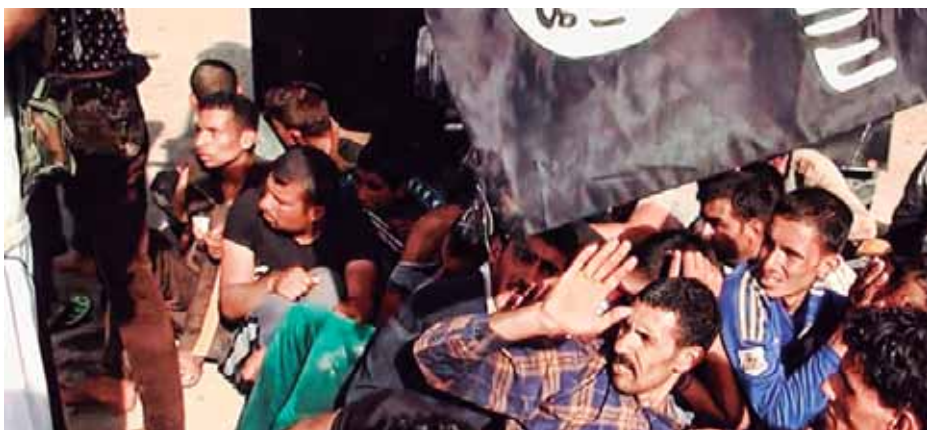
Manifestantes durante las actividades de la toma de Mosul

de los peshmergas (milicias kurdas) para contener el avance militar de los islamitas.