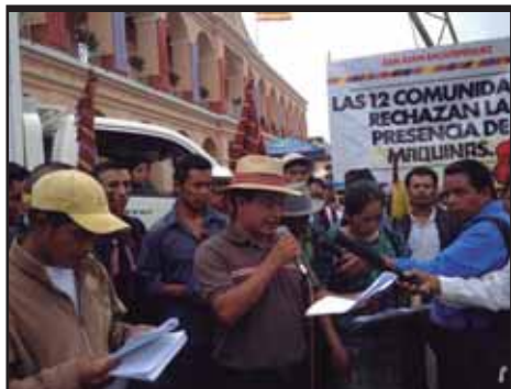
GUATEMALA.- Movilizaciones populares en San Juan Zacatepequez