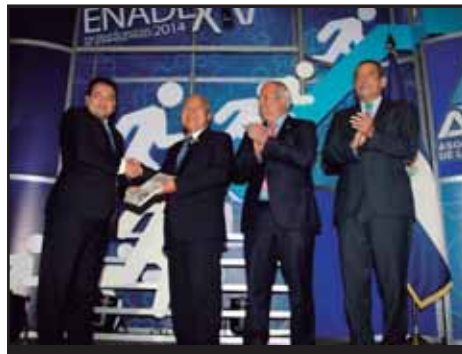
EL SALVADOR.- Gran entendimiento entre el gobierno del FMLN y ANEP