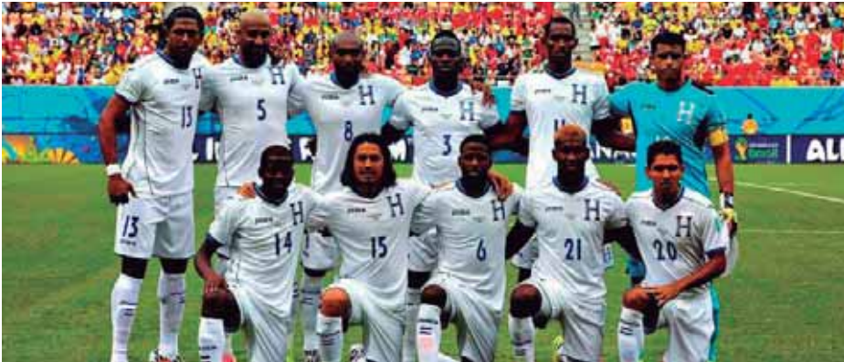
La selección Hondureña es parte del escape mental de la crisis actual