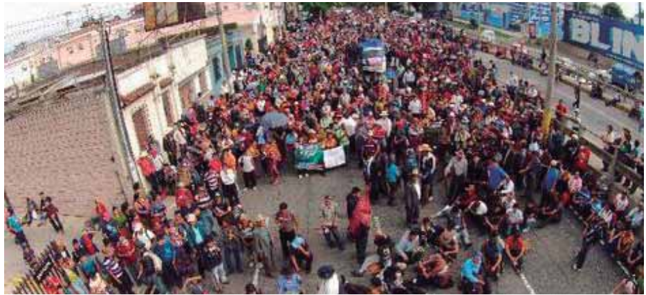
Marcha campesina de san juan sacatepequez

Las Doce Comunidades Kaqchiqueles acusan al Ministerio de Comunicaciones de despojar ilegalmente a propietarios de terrenos donde va pasar la vía. La empresa Cementos Progreso, además de beneficiarse con la carretera, será la