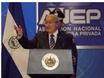
Cerén declarando en ENADE 2014

conocer muy satisfactoriamente que los esfuerzos realizados por su Gobierno por fortalecer y generar el ahorro público, han sido reconocidos por la misión del Fondo Monetario Internacional (FMI). Justificó estos esfuerzos diciendo que con ello podrán satisfacerse las demandas de servicios de calidad, seguridad ciudadana y jurídica, desarrollo logístico. En realidad lo que interesa a dichos organismos financieros internacionales es que el gobierno ahorre para que les pague los préstamos a costa de la clase trabajadora.