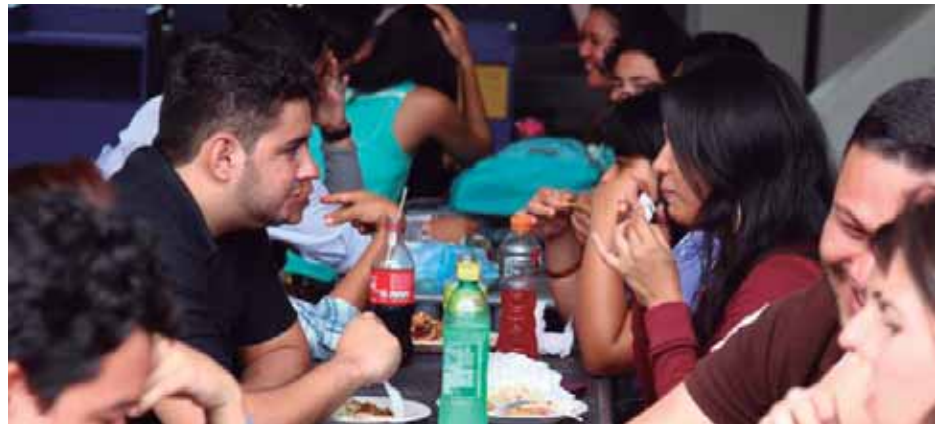
Debido a los reclamos se realizarán investigaciones por parte del Comisionado Universitario

Esta reingeniería se trata del despido de personal docente y administrativo, no implica un relevo generacional ni mejores condiciones de estudio para los alumnos. Todo lo contrario, significa la pérdida de docentes que trabajan para la universidad y la subcontratación de profesores por contrato que no están en función de reforzar las unidades académicas, sino