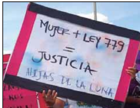
NICARAGUA.- Ley No 779: ¿El Triángulo de los Bermudas?