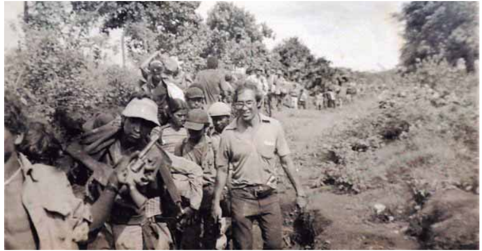
La conmemoración de El Repliegue de 1979 ha degenerado en un carnaval

“Jóvenes borrachos discutiendo por licor, empleados públicos llevados bajo amenazas y vendedores de todo tipo de artillugos rojinegros o revolucionarios fue