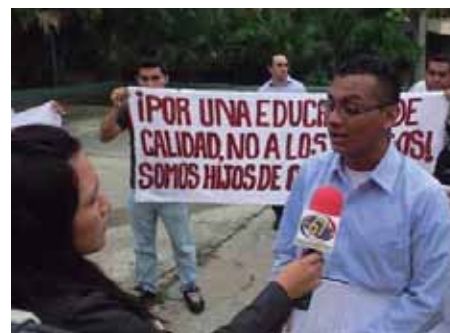
Estudiantes frente la Asamblea Legislativa

Desde el Partido Socialista Centroamericano (PSOCA) llamamos a crear colectivos estudiantiles en las diferentes universidades privadas y así mismo que se convoque a una asamblea de estudiantes de universidades privadas para que sean discutidos estos temas. Se debe luchar para que no se continúe