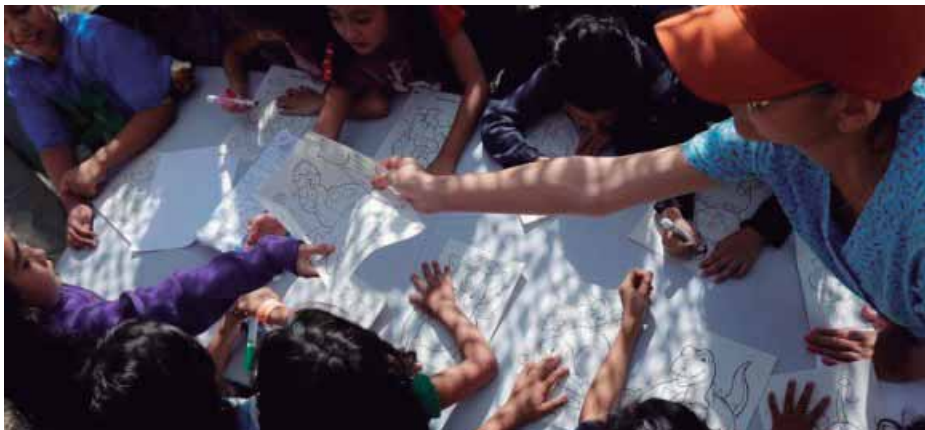
Niños migrantes son atendidos en Brownsville Texas