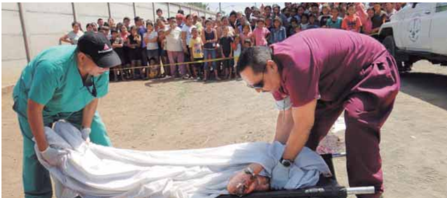
Los casos de feminicidios y agresión siguen aumentando a pesar de la Ley 779

Las mujeres siguen siendo víctimas de todo tipo de violencia, en el hogar y en la sociedad. La desigualdad, la dependencia económica, la impunidad ante los delitos y la falta de eco de las instituciones para detener los abusos de poder son el triángulo de las Bermudas donde se pierden todos los derechos de las mujeres. ■