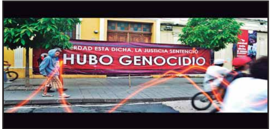
La celebración del 30 de Junio ha servido para denunciar el genocidio del Ejército

La revuelta inaugurada por los generales disidentes Miguel García Granados y Justo Rufino Barrios correspondía a la evolución armada de una lucha inter-burguesa entre los grandes terratenientes conservadores y la nueva burguesía agraria. La oligarquía conservadora hacia mediados de la década 1850 se había fracturado internamente debido al quiebre comercial