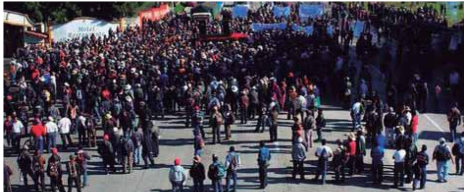
Campesinos bloquean el km 88.5 de la ruta Interamericana

En las protestas también participaron comunitarios de la resistencia de La Puya contra la mina El Tambor.