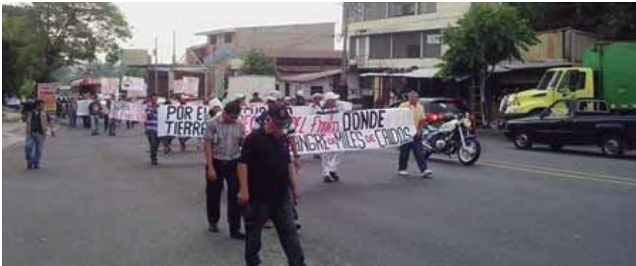
Las luchas por la reivindicación de sus derechos lleva años