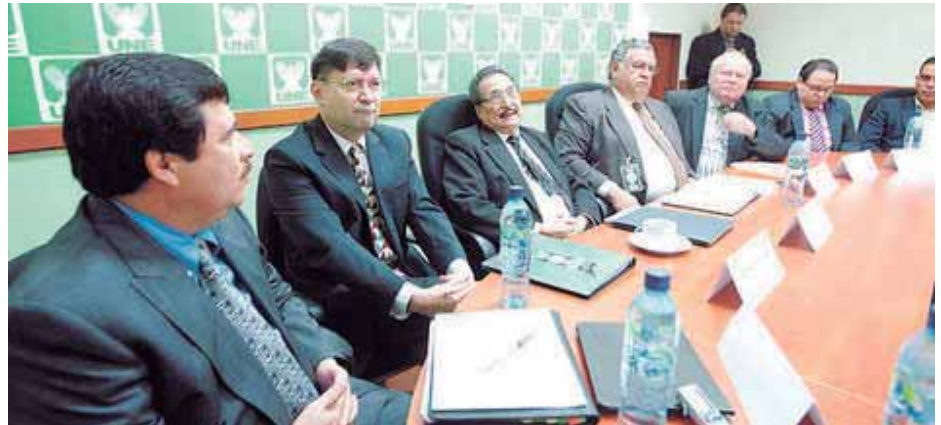
Viceministro de finanzas y miembros del directorio de la SAT

Los funcionarios argumentaron que se hará una licitación en base a los artículos 4 y 35 de la Ley Orgánica de la SAT, y al reglamento de contratación de servicios, diciendo además que no se