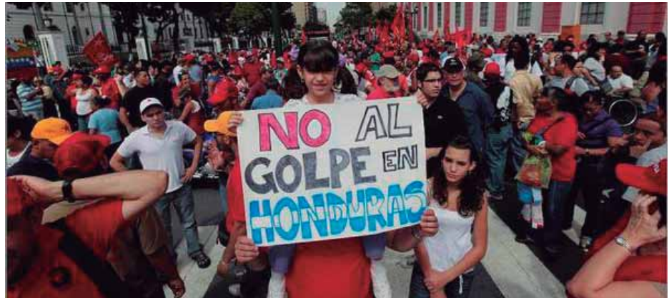
Las movilizaciones han desaparecido, por que se impuso el Golpe de Estado?

Los grandes ataques contra las conquistas obtenidas a través de intensas jornadas de luchas (el estatuto del docente hondureño, los distintos contratos colectivos), el desmantelamiento de las organizaciones gremiales y sindicales y de los institutos de previsión ante la aplicación de las políticas de reducción y de ajuste neoliberal, son parte de las pruebas concretas que evidencian los enormes errores políticos de la dirección y la arremetida de la burguesía hondureña.