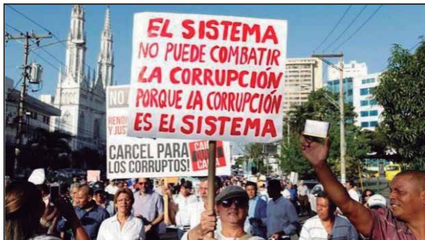
Sectores democráticos y la izquierda presionan en las calles

Sin lugar a dudas, en su momento Martinelli reflejaba las aspiraciones políticas de un nuevo sector burgués, que logró manipular hábilmente el rechazo de la población al bipartidismo que en los hechos se había instaurado, y que necesitaba tomar el poder para consolidarse económicamente. Una vez en el poder se aceleraron las contradicciones entre Martinelli y los otros sectores de la