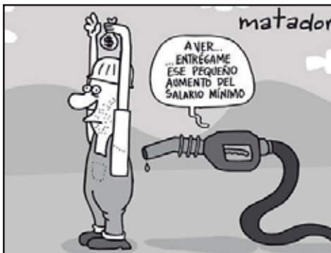
NICARAGUA.- El Salario Mínimo cuesta abajo