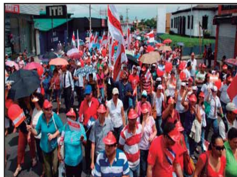
COSTA RICA.- La cuestión de la evaluación docente