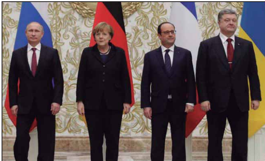
Putin, Merkel, Hollande y Poroshenko

La guerra ha causado más de cinco mil muertos y un poco más de un millón de desplazados. La situación de penuria de la población rusa ucraniana es calamitosa, sobre todo desde que Kiev le cortó en pleno invierno todo tipo de asistencia y recursos estatales. Si no es por los convoyes de asistencia humanitaria rusas, la situación sería peor. En el occidente, la situación económica no es mucho mejor; con las medidas impulsadas por el FMI y la UE, ha habido un encarecimiento de los productos básicos, además de que la libre movilidad al espacio de la UE ha sido una promesa vacía.