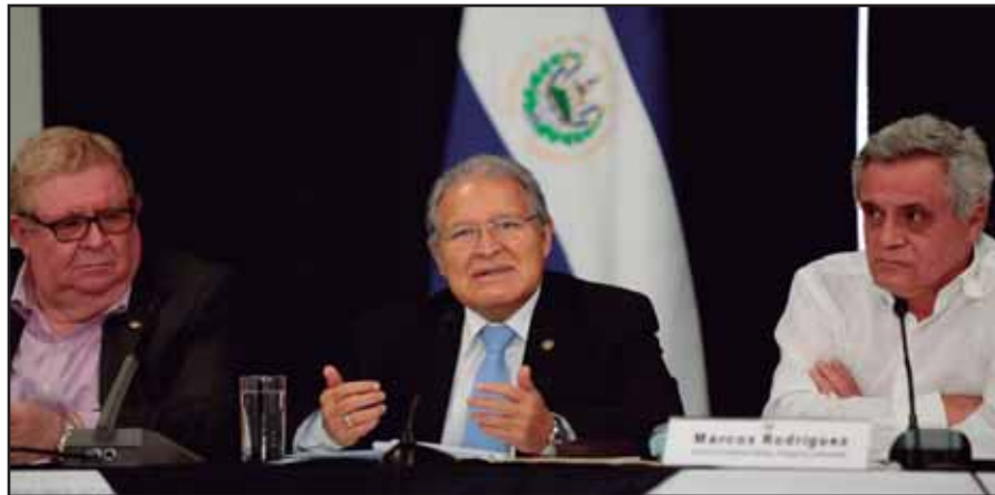
Sánchez Cerén anuncia Comisión Presidencial para Asuntos Laborales

Pero además no solo debe aumentarse el salario mínimo, si no todos los salarios; ya un buen porcentaje del sector profesional devenga más de salario mínimo pero estos salarios son insuficientes. Debemos exigirle al gobierno que dicha comisión no sea una táctica dilatoria más, o una medida mediante la cual los núcleos empresariales emergentes ligados al FMLN buscan presionar a la rancia oligarquía para obligarla a negociar.