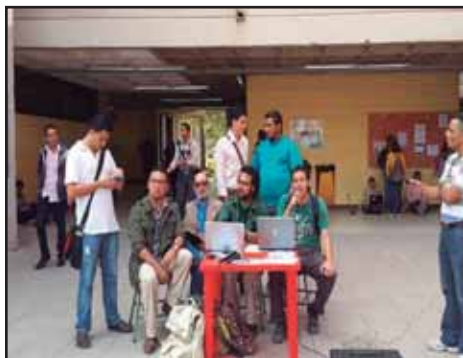
HONDURAS.- Es hora de replantearse el Plan de Lucha en la UNAH