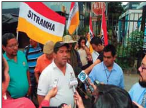
EL SALVADOR.- Un Programa para la Coordinadora Sindical Salvadoreña