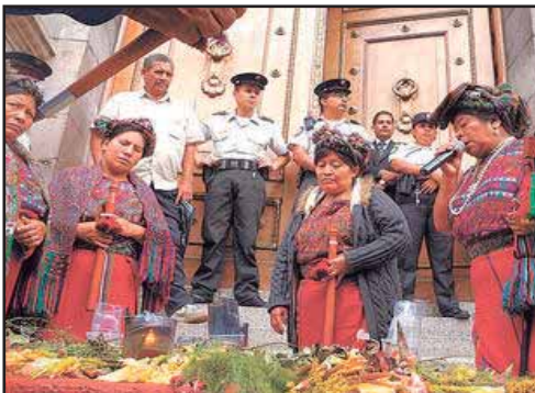
GUATEMALA.- De las calles a los Salones