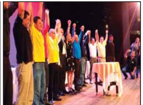
COSTA RICA.- Que significa y a donde conduce el acuerdo PAC-FA-PJ?