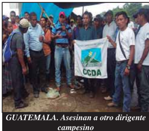
GUATEMALA. Asesinan a otro dirigente campesino

COSTA RICA.- Aparatosa asamblea del FEES