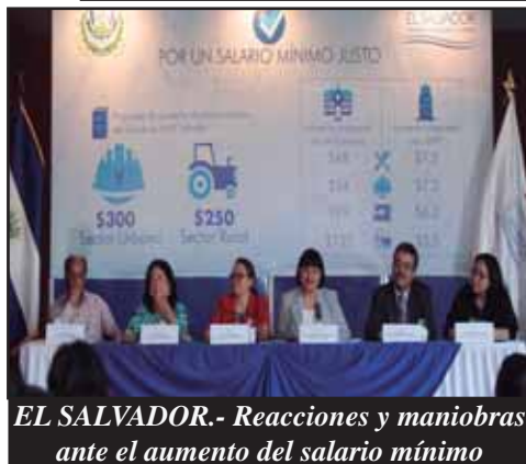
EL SALVADOR.- Reacciones y maniobras ante el aumento del salario mínimo