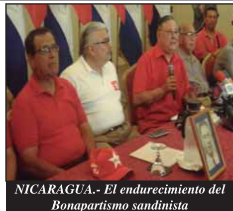
NICARAGUA.- El endurecimiento del Bonapartismo sandinista