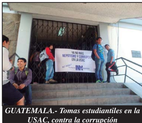
GUATEMALA.- Tomas estudiantiles en la USAC, contra la corrupción