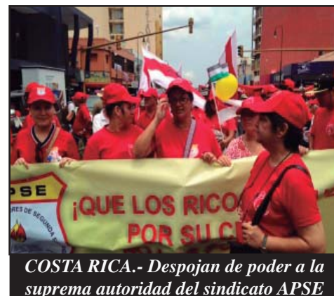
COSTA RICA.- Despojan de poder a la suprema autoridad del sindicato APSE