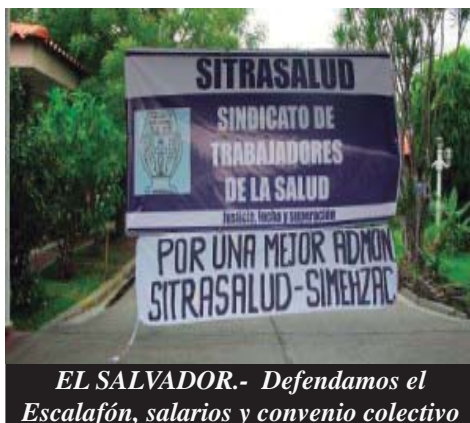
EL SALVADOR.- Defendamos el Escalafón, salarios y convenio colectivo