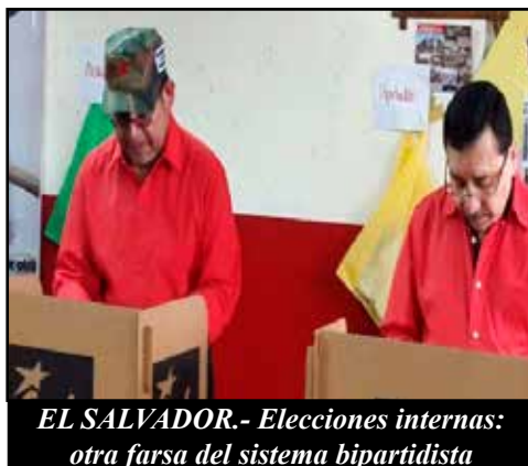
EL SALVADOR.- Elecciones internas: otra farsa del sistema bipartidista