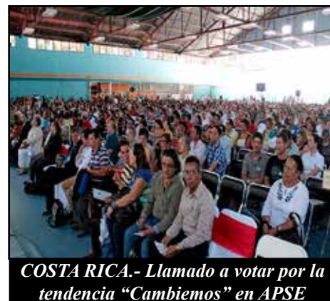
COSTA RICA.- Llamado a votar por la tendencia "Cambiemos" en APSE