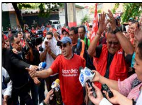
EL SALVADOR.- Internas del FMLN

GUATEMALA.- RELAJO, CONFUSIÓN Y ACUSACIONES DE FRAUDE ELECTORAL