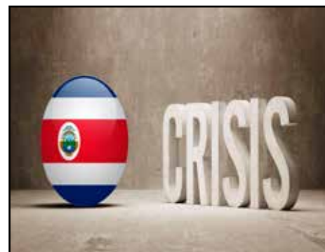
COSTA RICA.- ¿A Dónde va Costa Rica? II Parte