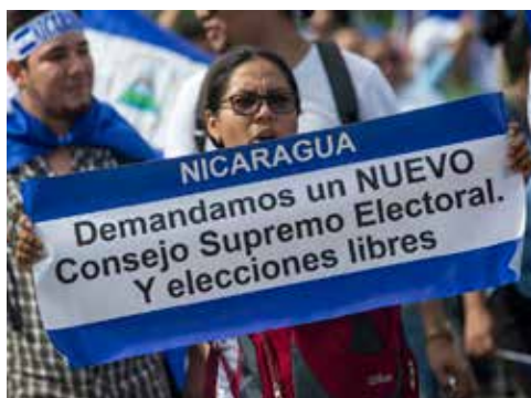
NICARAGUA.- Cruciales reformas electorales