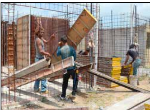
GUATEMALA. CACIF quiere imponer otro "salario mínimo" de hambre

HONDURAS.- LAS RANCIAS BUROCRACIAS EN LAS DIRECCIONES DEL MAGISTERIO