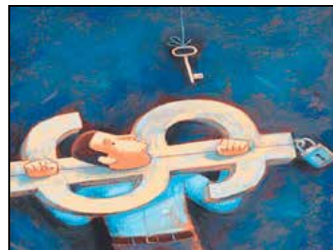
COSTA RICA.- Deuda pública y de los Hogares: el futuro está ejecutado