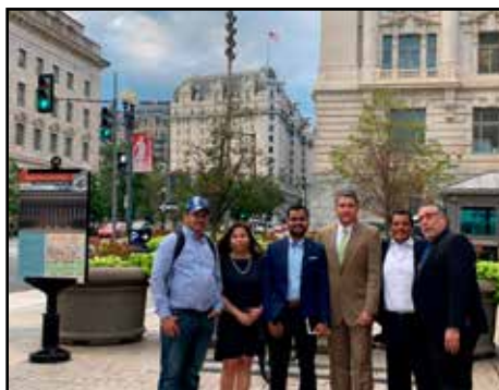
NICARAGUA. El grave error de confiar sólo en las sanciones internacionales