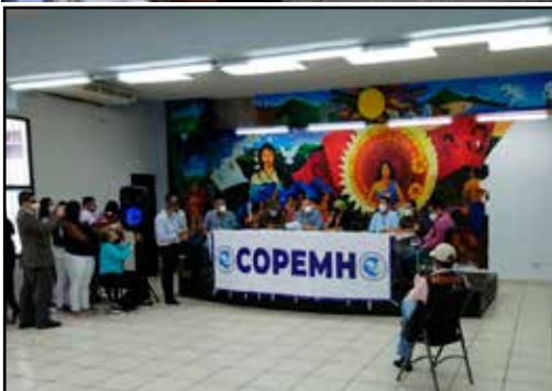
HONDURAS.- La base debe apropiarse del nuevo COPEMH