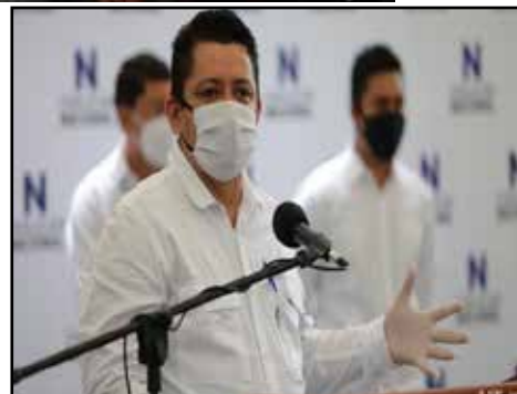
NICARAGUA.- Interminable crisis política de la oposición