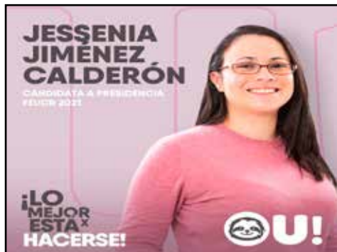
COSTA RICA.- ¿Por qué el PLN ganó las elecciones de la FEUCR?