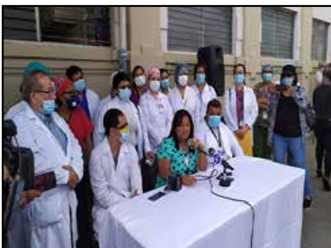
EL SALVADOR.- Reclasificación, nivelación y aumento para todos en ISSS