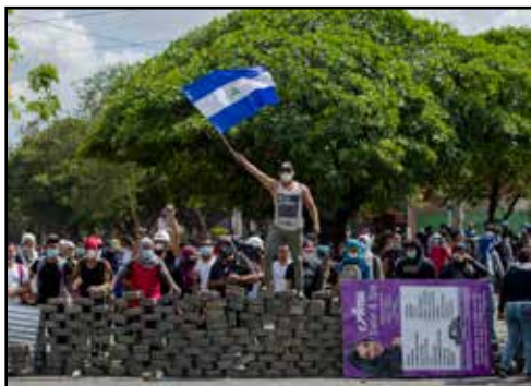
NICARAGUA.- ¿Por que fracasó la rebelión de abril del 2018?