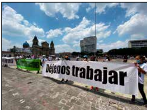
GUATEMALA. Trabajadores se oponen al Estado de Prevención

• Aumentos de salarios que cubran el costo de la vida. • Defensa y mejoramiento de la seguridad social. • R e n t a básica para los pobres. • Acceso inmediato y gratuito a las vacunas contra el COVID. • Unidad de acción sindical y popular