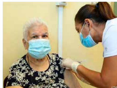
COSTA RICA.- ¿Hacia una catástrofe sanitaria por el COVID?