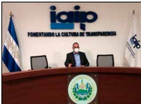
EL SALVADOR.- ¿Por qué Bukele quiere desvirtuar la lucha contra la corrupción?