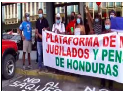
HONDURAS.- El Magisterio: Más dividido que nunca