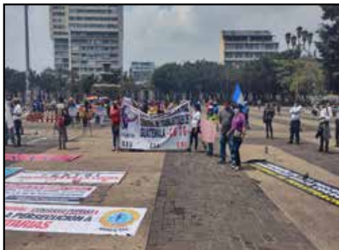
GUATEMALA.- Baja asistencia a la marcha del 1 de Mayo