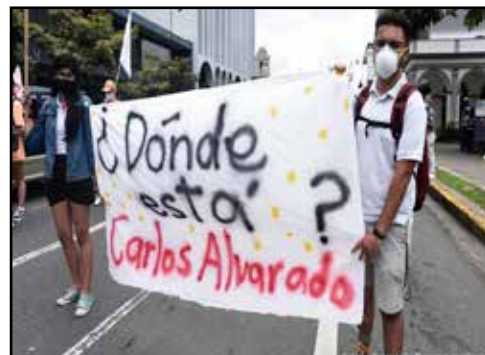
COSTA RICA.- Las políticas de Shock de Carlos Alvarado contra los trabajadores