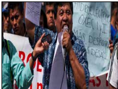
GUATEMALA.- Campesinos e indígenas defienden sus tierras