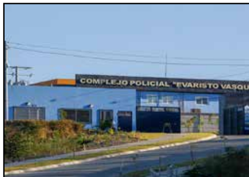
NICARAGUA: Represión, conflictos con el gran capital e incertidumbre en elecciones