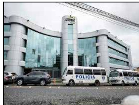
COSTA RICA.- La corrupción: un mal estructural