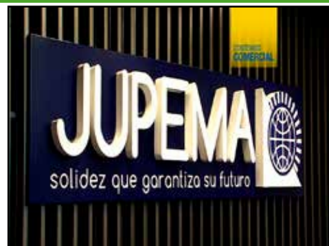
COSTA RICA.- Por la defensa del Fondo de Pensiones del magisterio nacional