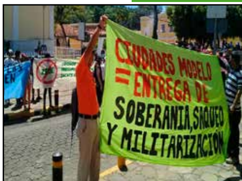
HONDURAS.- Falaz discurso de la ultra derecha sobre las ZEDE