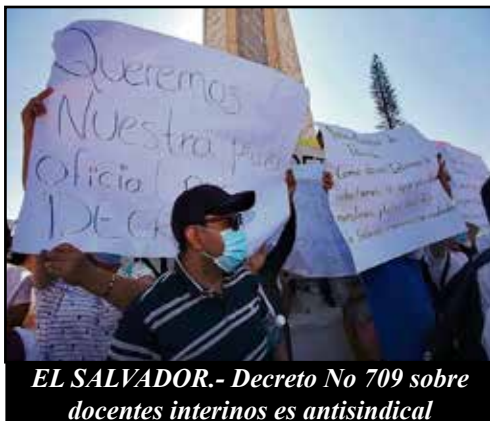
EL SALVADOR.- Decreto No 709 sobre docentes interinos es antisindical