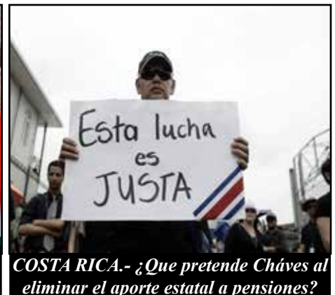
COSTA RICA.- ¿Que pretende Chaves al eliminar el aporte estatal a pensiones?