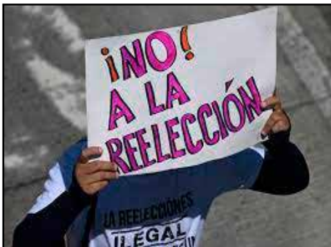
EL SALVADOR.- Bukele en ruta hacia la reelección indefinida