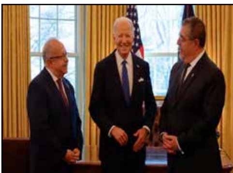
GUATEMALA.- Biden prioriza a Arévalo como el principal vasallo de la región