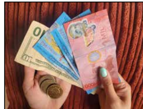
COSTA RICA.- Debate sobre la apreciación del Colón