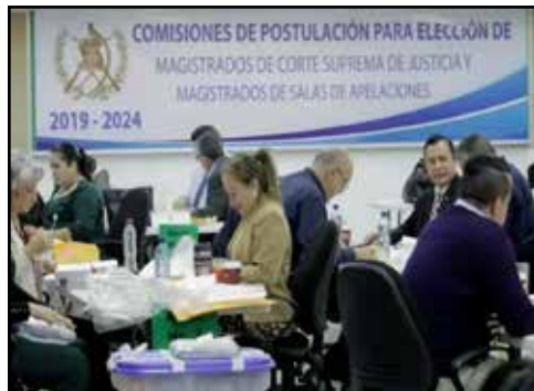
GUATEMALA.- Agrias disputas en las Comisiones de Postulación

5 DE JUNIO DE 1967: ISRAEL INICIA LA GUERRA DE LOS SEIS DÍAS