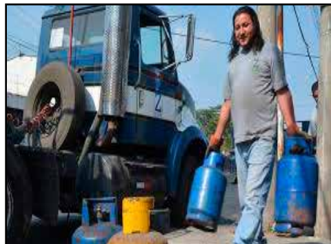
EL SALVADOR.- Dosis de medicina amarga con focalización subsidio al gas