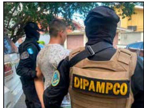
HONDURAS.- Estado de Excepción resulta ineficaz contra criminalidad