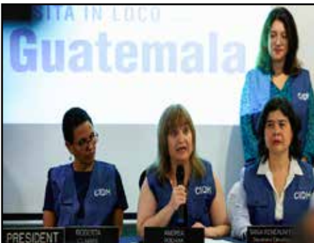
GUATEMALA.- Impotencia de la CIDH para frenar violaciones a DDHH