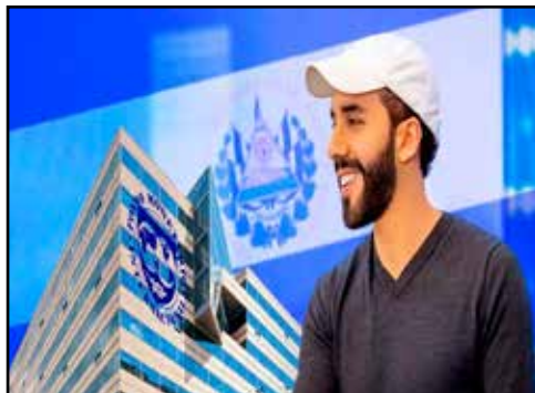
EL SALVADOR.- Acuerdo Bukele-FMI: despidos, impuestos y más deuda