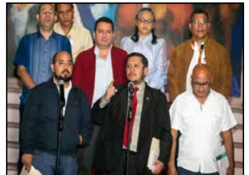
HONDURAS.- ¿Perdió el magisterio su identidad de lucha?