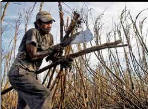
GUATEMALA.- Sindicatos aceptan docilmente miserable aumento salarial

FECHAS.- DECLARACIÓN DE LA SIERRA DE LAS MINAS