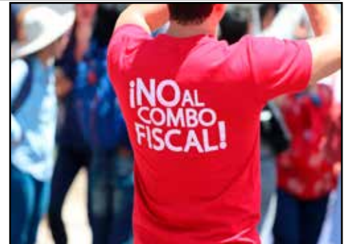
COSTA RICA.- El agotamiento del Combo Fiscal y la reducción de impuestos