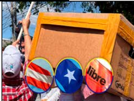
HONDURAS.- No hay propuesta revolucionaria en elecciones internas