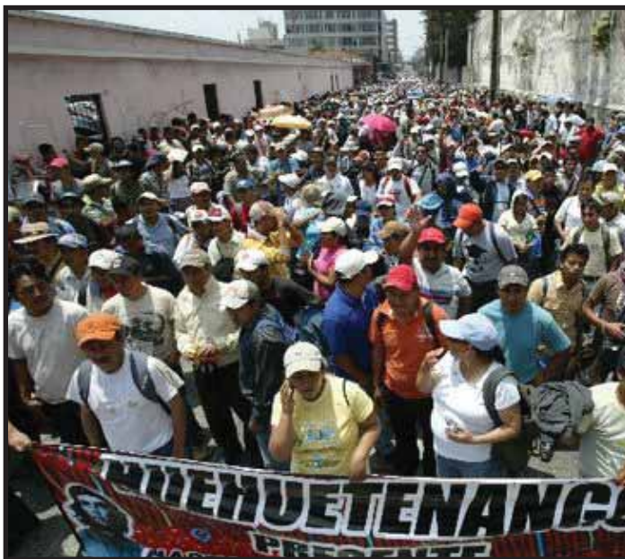
MOVILIZACIONES EN GUATEMALA