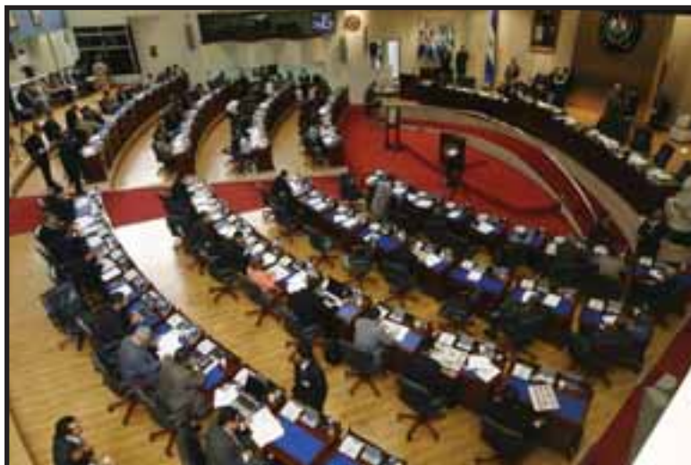
La Asamblea Legislativa discutirá el veto a las reformas electorales

El Partido Socialista Centroamericano (PSOCA) al respecto declaró no apoyamos la sentencia de la Corte Suprema de Justicia, por considerarla una maniobra política y porque es insuficiente. Conocemos cuales son los objetivos de la derecha, pero no podemos permitir, ni apoyar restricciones a los derechos democráticos de los