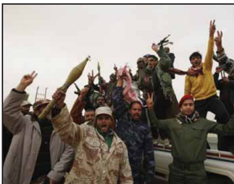
LIBIA.- Reflexiones sobre el curso de la guerra civil