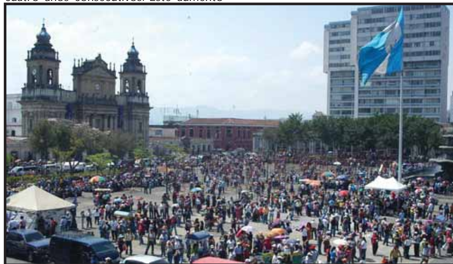
Los maestros protestan en la Plaza central de Guatemala

Para el 7 de abril se anunciaron bloqueos de carreteras, pero fueron suspendidos porque las cámaras