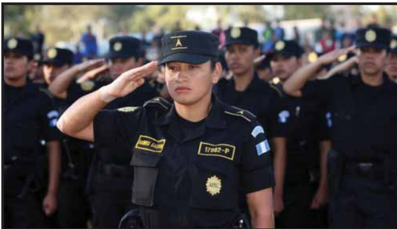
Funes fortalece el aparato militar

Así mismo en un artículo de la Prensa Gráfica del día 15 de abril se señala "Seguramente, la instalación en el país de una Comisión Internacional Contra la Impunidad en El Salvador (CICIES), al estilo de su versión guatemalteca, sería la cereza en el pastel. De cuajar dicho proyecto, Funes haría un aporte