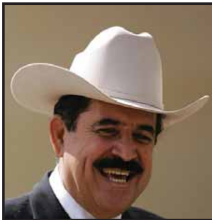
Manuel Zelaya: el gran perdedor

El editorial de La Tribuna del 11 de abril, sin ser marxista, explica las motivaciones económicas de este nuevo romance entre la burguesía hondureña y el chavismo: "Petrocaribe permite al país comprar en condiciones preferenciales el crudo a Venezuela, bajo un mecanismo en que un porcentaje del alto precio que se paga –porque no hay rebaja de precios– se acredita como financiamiento. O sea, no se paga el precio total de lo que se consume, sino que una parte se asume como deuda, financiamiento que el país puede utilizar,