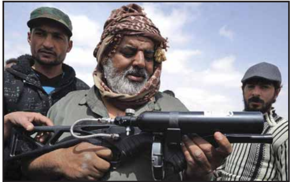
Los rebeldes pelean en condiciones desventajosas

En realidad, Fidel Castro no tiene preguntas, el mismo afirma en otro párrafo que "El imperialismo y la OTAN —seriamente preocupados por la ola revolucionaria desatada en el mundo árabe, donde se genera gran parte del petróleo que sostiene la economía de consumo de los países desarrollados y ricos— no podían dejar de aprovechar el conflicto interno surgido en Libia para promover la intervención militar".