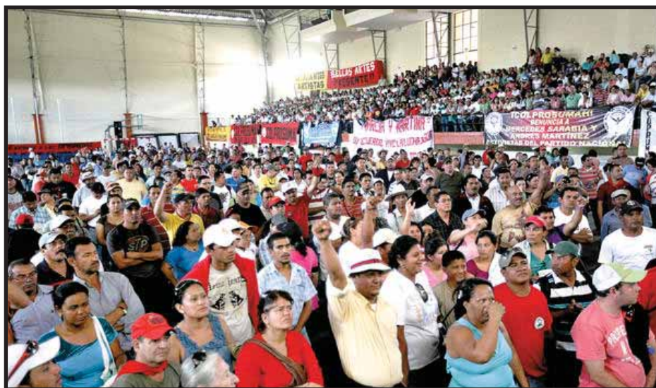
Asamblea de maestros en Tegucigalpa

En el 2010 nuevamente el magisterio se fue a la lucha y la base siguió dividida.