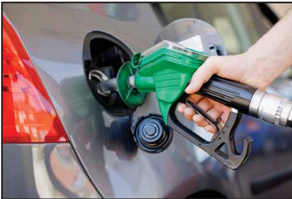
Los altos precios de los combustibles elevan los precios de la canasta básica

Ante la amenaza de los transportistas (transporte colectivo y de carga) de irse a huelga, cerrar las fronteras y paralizar el país, el Gobierno del Frente Sandinista acordó otorgar un subsidio a los transportistas y venderles la gasolina más barata, sin embargo, este subsidio no es suficiente y los transportistas continúan sin ver ganancias. La clase media también se ha visto afectada ya que al otorgárseles este subsidio a los transportistas, la gasolina incremento para los dueños de vehículos particulares, quienes son los que realmente están pagando el subsidio.