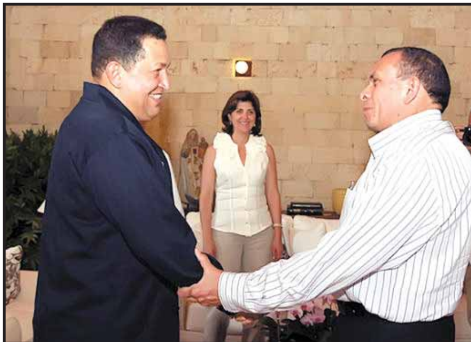
Ver para creer: Hugo Chavez reconoció a Porfirio Lobo y con ello al golpe de Estado

A todas luces el gobierno ilegítimo de Porfirio Lobo ha tratado de abogar por todos sus medios por el reconocimiento del Estado de Honduras a los organismos supranacionales, pero ante la intransigencia de la derecha de no permitir el retorno de Zelaya al país sin ser perseguido por