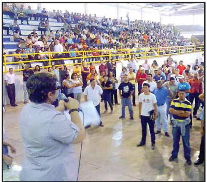
LUCHAS Y REPRESIÓN EN HONDURAS