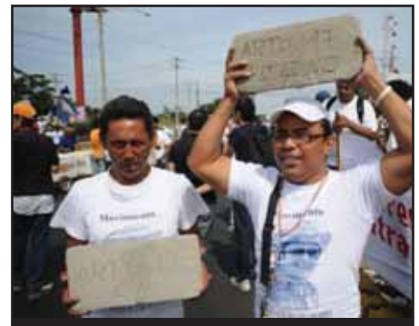
NICARAGUA.- Lucha contra la reelección y limitación a las libertades