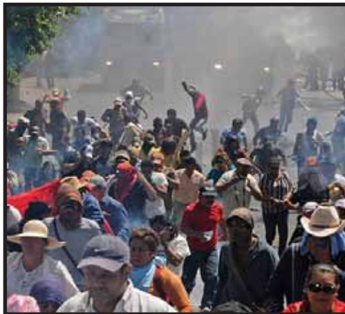
Lobo reprimió violentamente las protestas

desconocen la lucha que se realizó a inicios de la década de los 80, para lograr la aprobación del Estatuto del Docente, también desconocen las constantes intenciones de los gobiernos de Carlos Flores y Maduro por abolir las conquistas del magisterio. Con esta nueva generación de docentes se deben realizar talleres previos a ingresar a la docencia para que