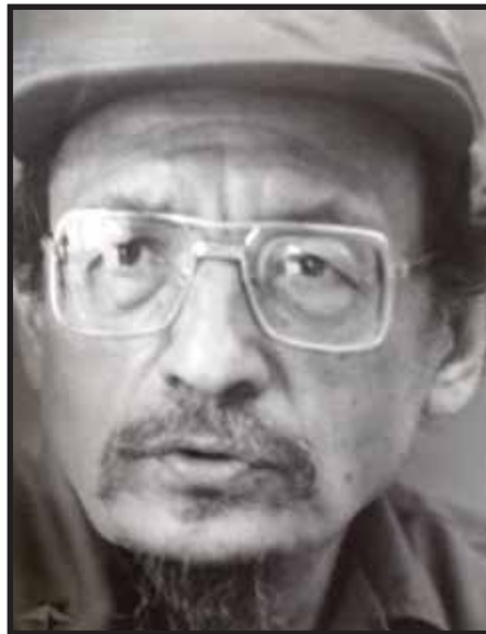
Salvador Cayetano Carpio, líder histórico de la guerrilla salvadoreña

La concepción de Marcial fue la de Guerra Popular Prolongada (GPP) , que aunque toma en cuenta a