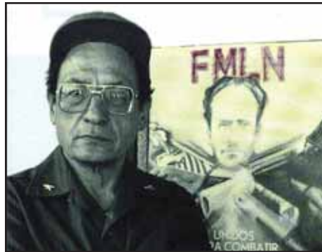
FECHAS: 28 años del "suicidio" del Comandante Cayetano Carpio