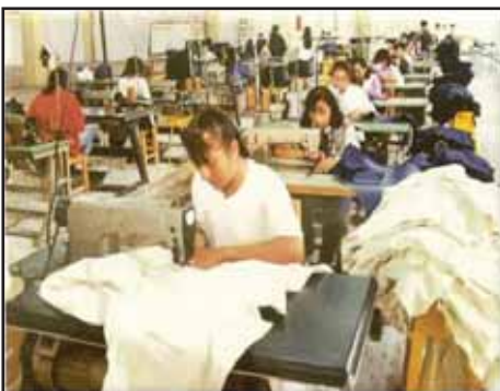
GUATEMALA.- Miserable aumento del salario mínimo

SIRIA: ¡¡ ABAJO LA DICTADURA DE BASHAR AL ASSAD!!