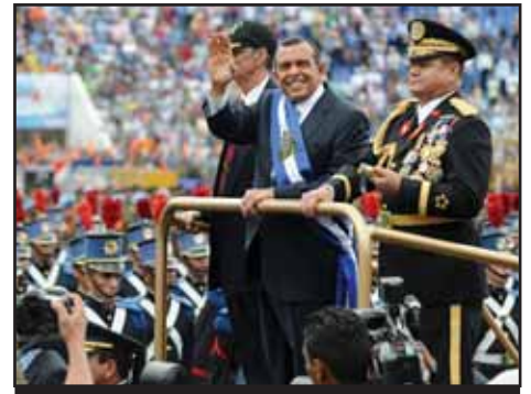
HONDURAS.- Dos años de gobierno de Porfirio Lobo