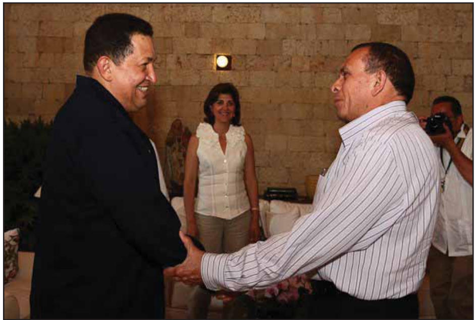
La reconciliación de Chavez con Porfirio Lobo

cadena nacional de larga duración se le comunicaron al pueblo hondureño los nuevos ajustes para todos los sectores (...)El acuerdo STSS0012012 fue oficializado ayer en presencia del mandatario y de los representantes de las áreas empresarial y trabajadora de Honduras para darle vigencia al nuevo ajuste salarial para 2012 y 2013 con aumentos automáticos para el sector de la maquila (...)El aumento en el salario mínimo es desde 5.6 y 7.5%, lo que depende del número de empleados y de