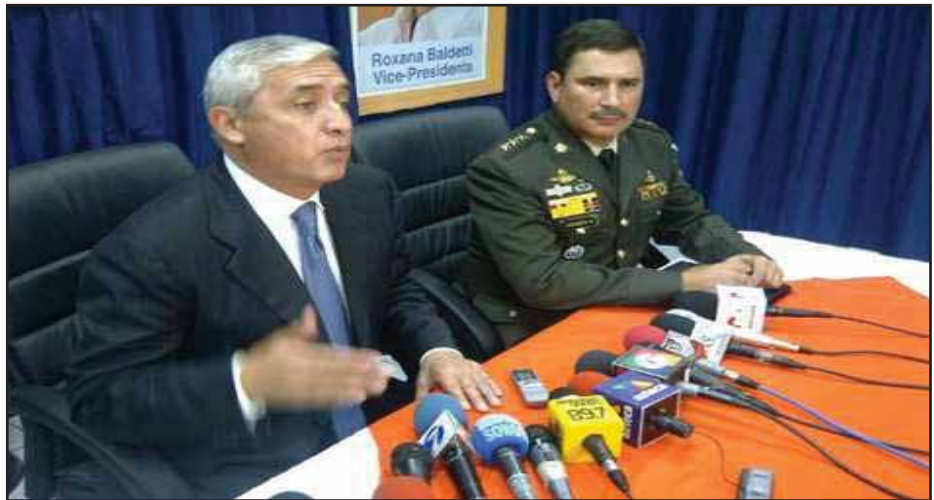
Pérez Molina y Noe Anzueto, Ministro de Defensa

autoridades utilizarán los recursos legales a su alcance para atacar los bloqueos de carreteras, huelgas, ocupaciones y tomas de edificios, tal como los empresarios