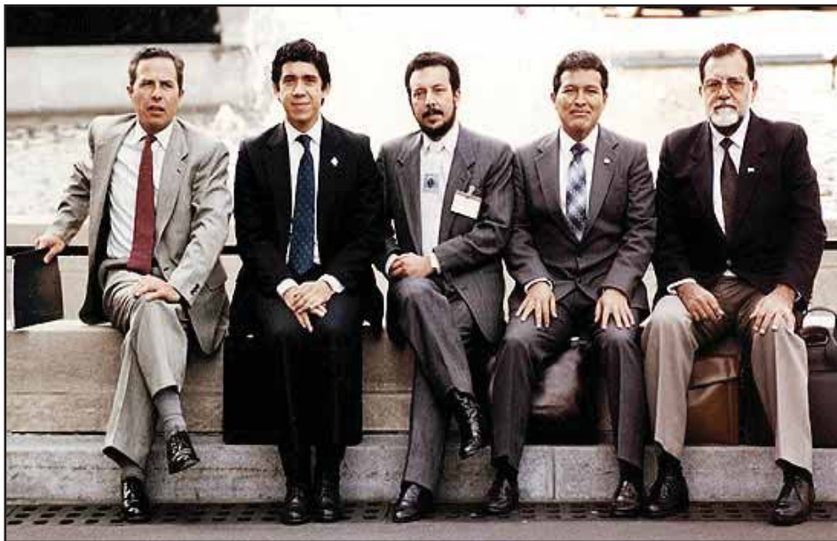
La Comandancia General del FMLN

Los Acuerdos de Paz entonces, se avizoran como la máxima muestra del proceso de reacción democrática impulsado desde el Departamento de Estado de los Estados Unidos, y que buscaba pacificar la región para posteriormente justificar sus planes de “Apertura Comercial” en la región Centroamericana