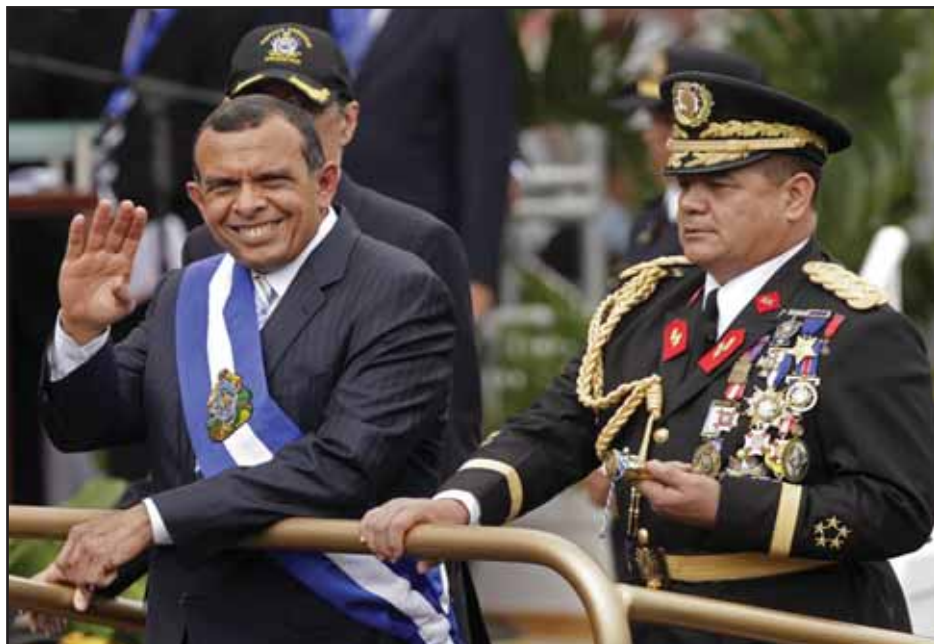
Porfirio Lobo y el Gral Romeo Velasquez

Mientras, en control de corrupción obtuvo -0.08, y los niveles deben estar en 0.00. Es en este indicador donde se incluyen la falta de respuesta ante las