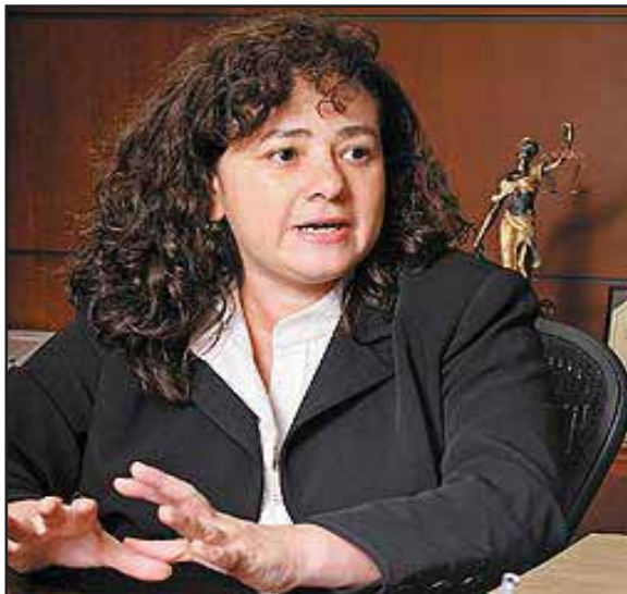
Claudia Paz y Paz, Fiscal de Guatemala

criminales contra miembros de organizaciones guerrilleras. Estas son evidentes luchas y confrontaciones por la búsqueda de poder político por parte de los ex militares. Su intención es acallar la función que la Fiscal General ha tenido en el ejercicio de la política criminal democrática, siendo un claro ejemplo el combate contra aquellas personas que cometieron o estuvieron vinculados a los delitos de lesa humanidad durante el conflicto armado interno.