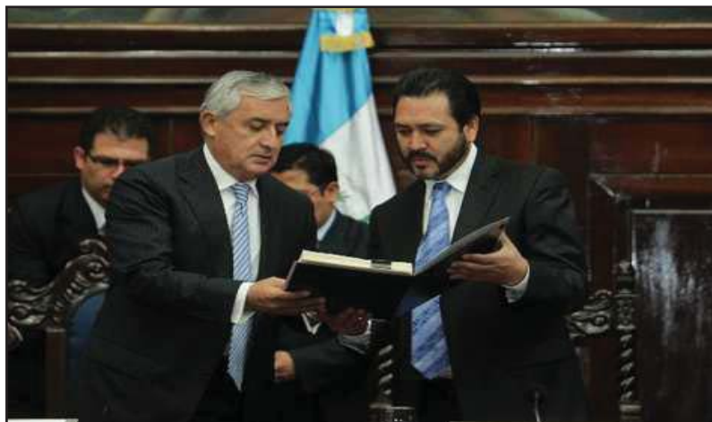
Otto Pérez Molina entrega la propuesta de Reforma Fiscal

Las reformas no tocan a las maquilas, empresas de zonas francas y otro tipo de empresas que gozan de exenciones fiscales con el pretexto de incentivar la inversión, pero que se llenan los bolsillos con la explotación de sus obreros sin pagar los impuestos de ley. Estas exenciones reciben el nombre de gasto tributario, y representan al Estado alrededor de Q 29 mil millones que deja de recibir