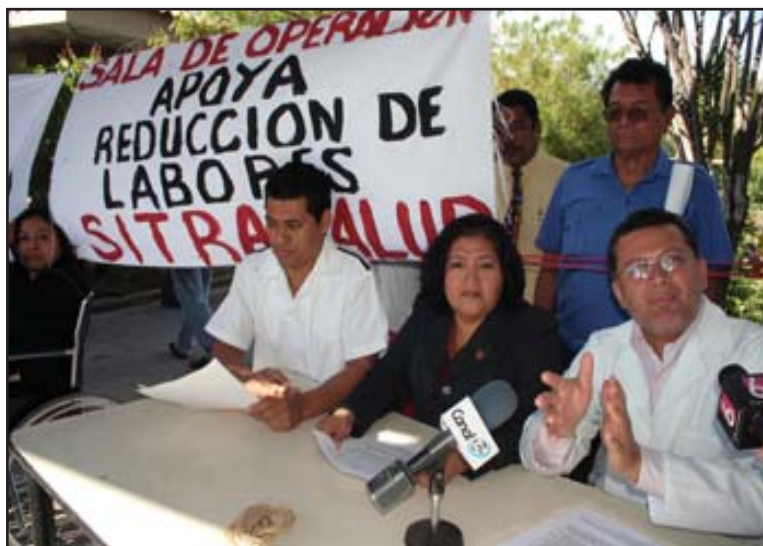
Médicos del Hospital Zacamil en pie de lucha

puedan tener una atención digna. Las autoridades hacen caso omiso y no toman en serio la problemática"... "No somos escuchados y los únicos afectados son los pacientes, ya que a ellos les toca