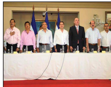
HONDURAS.- Centrales Obreras firman "Acuerdo Nacional" con Porfirio Lobo