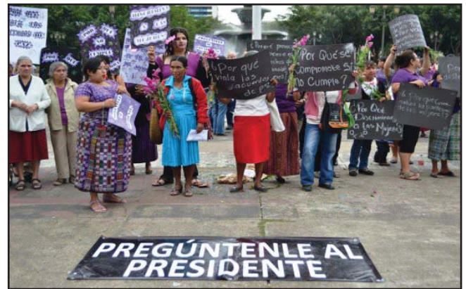
Protesta de mujeres por cambios en Seprem

Esto es un claro ejemplo de centralismo y de control de información