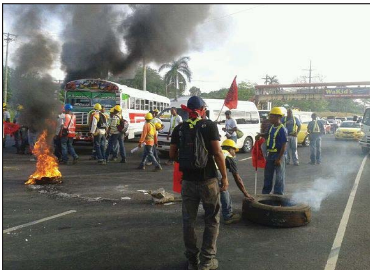
Trabajadores de la construcción apoyaron la lucha indígena

Los individuos y la empresa que lleva a consecución el proyecto de la hidroeléctrica, hablan tajantemente