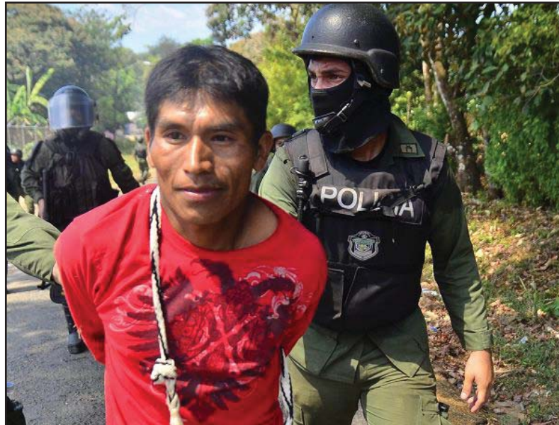
Indígena capturado por la Policía

se desarrollaban los hechos y presionados por toda la nación, perdían credibilidad y confianza de los ciudadanos hacia sus políticas. "Si yo fuera Martinelli me daría vergüenza hablar, por tener un gobierno incapaz y no querer atender al pueblo. Él es un presidente que compra conciencias,