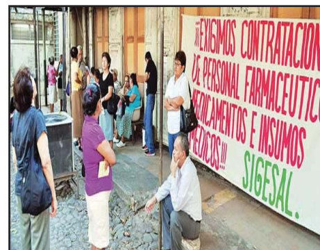
EL SALVADOR.- SIGESAL lucha por mejorar las condiciones de trabajo