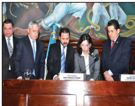
GUATEMALA.- La Reforma Fiscal beneficia a los empresarios