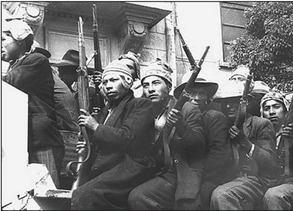
Milicias populares, abril de 1952.

La Junta Militar, presidida por el general Hugo Ballivián, declaró nulas las elecciones y prosiguió gobernando hasta abril de 1952, oportunidad en que uno de sus miembros, el Ministro de Gobierno, general Antonio Seleme, que en esta ocasión representaba en las filas gubernamentales, se manifestó dispuesto