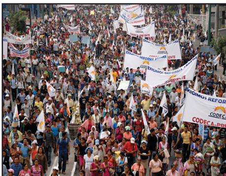
GUATEMALA.- Protesta de campesinos y trabajadores de la salud

BOLIVIA: 60 ANIVERSARIO DE LA REVOLUCION DE 1952