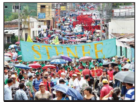
HONDURAS.- A organizar el Paro Cívico Nacional de 24 horas!