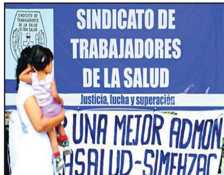
EL SALVADOR.- Trabajadores de la salud y maestros nos enseñan el camino