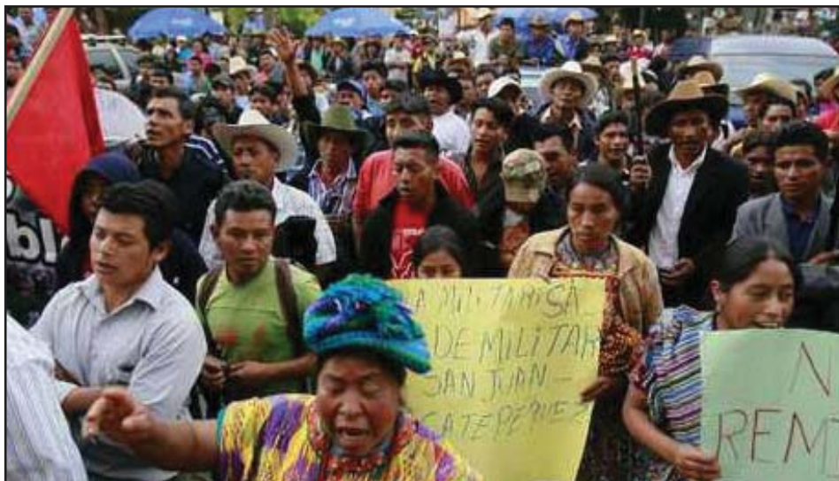
Pobladores rechazan la presencia de Brigada Militar

evidente confrontación simbólica por parte del gobierno, hacia las comunidades en resistencia, que luchan por la imperiosa necesidad del cambio estructural, repudiamos las acciones que buscan sentar la base de legitimación militar sobre la clase burguesa-oligárquica; mediante el control armado sobre la población y poder establecer negociación de intereses de clase, manteniendo la opresión hacia los obreros, campesinos e indígenas. Nuestra solidaridad con los pueblos en resistencia y nuestra lucha contra el proyecto burgués, POR LA UNIFICACIÓN SOCIALISTA DE CENTRO AMÉRICA, RESISTENCIA Y LUCHA CONTRA EL PROYECTO BURGUÉS