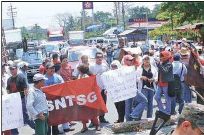
Protesta de trabajadores de la salud

Cabe comentar que esta es la tercera movilización campesina con demandas similares. Una fue la marcha del 19 al 27 de abril organizada principalmente por el Comité de Unidad Campesina (CUC). El 26 la Coordinadora Nacional Indígena y Campesina se reunió con representantes del gobierno para plantear demandas similares a las que traía la marcha del CUC. Y el 17 marchan las organizaciones de la CNOc exigiendo temas parecidos.