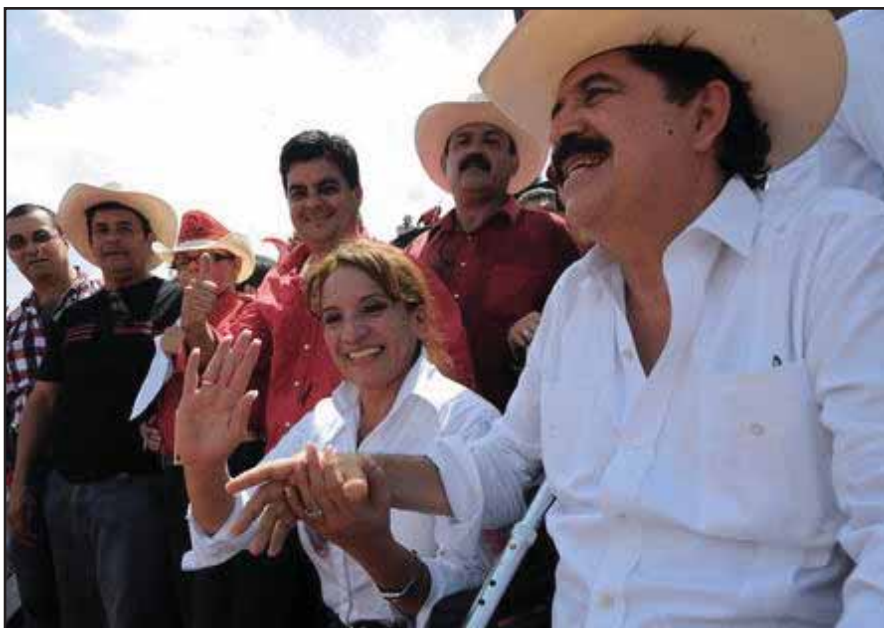
Xiomara Castro fue impuesta por el “consenso” de los dirigentes, se requiere elegir candidatos obreros y populares

A pesar de las grandiosas movilizaciones populares, Micheletti no fue derrocado porque siempre la conducción política del FNRP, al mando del expresidente Manuel Zelaya,