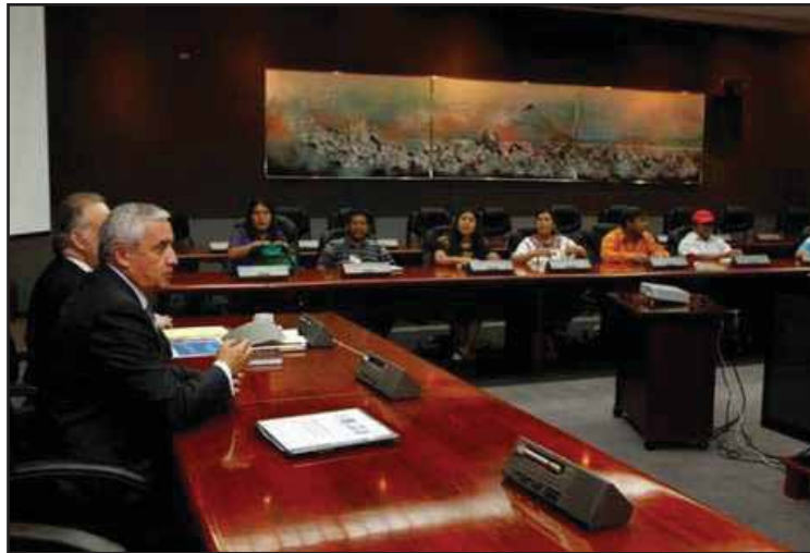
Otto Pérez Molina expone su proyecto de reformas constitucionales

Otra propuesta polémica es que la Corte Suprema de Justicia sea la