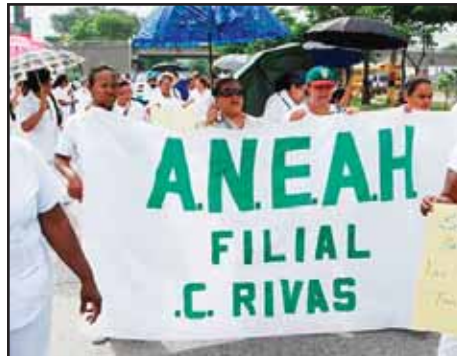
HONDURAS.- Heroica huelga de enfermeras en defensa del salario