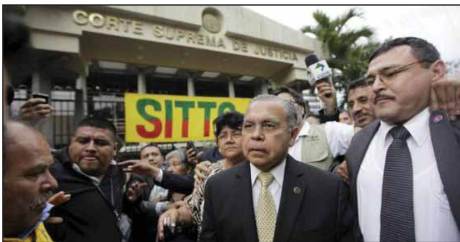
Ovidio Bonilla, presidente electo, llega a la Corte Suprema a asumir su cargo

Ya se demostró tras la llegada del FMLN al gobierno, que el sistema