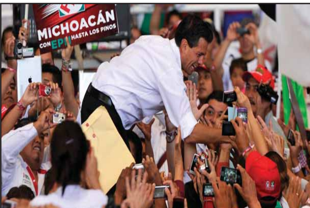
México: la Resurrección del PRI