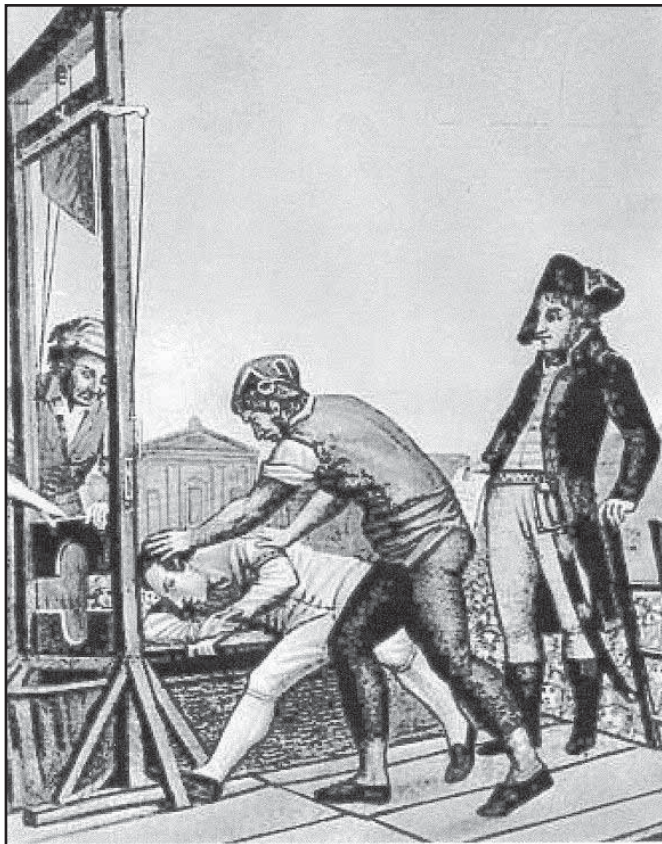
Robespierre, el Incorruptible, es finalmente guillotinado

Robespierre: "¿Es que hay que juzgar las precauciones exigidas por la Salud Pública en tiempos de crisis, provocada por la impotencia misma de las leyes, con el código criminal en la mano?" Y aclaraba: "Si el atributo del gobierno popular en épocas de paz es la virtud, sus atributos en tiempos de revolución son a la vez la virtud y el terror: la virtud sin la cual el terror es funesto; el terror sin el cual la virtud es impotente. El terror no es sino justicia rápida, severa, inflexible; es por tanto emanación de la virtud". (citado por Nahuel Moreno, Dictadura Revolucionaria del Proletariado) ■