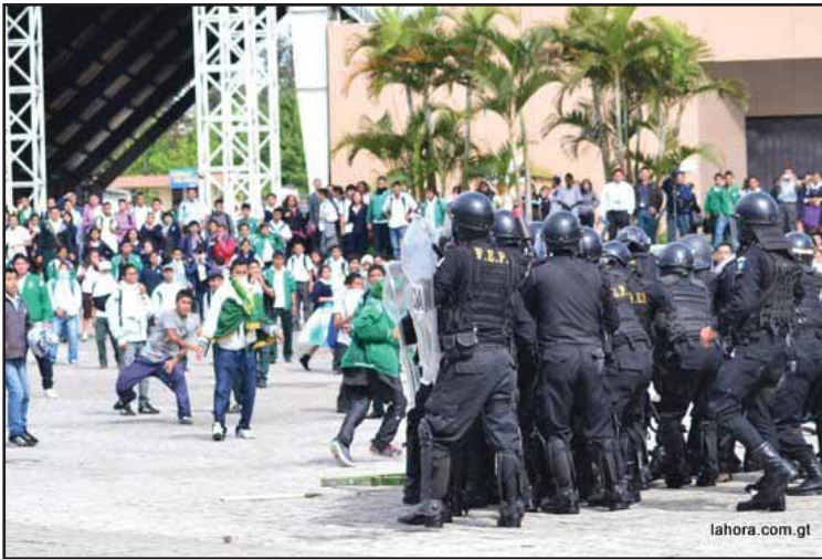
Enfrentamientos entre la Policía y estudiantes Normalistas en el Parque de Industrias

Guatemala estudiantes tomaron la principal vía de acceso. Impresionante fue la marcha del 6 que recorrió las principales arterias de la ciudad hasta el Congreso de la República, donde una cantidad de estudiantes de los institutos normales de la capital se movilizaron junto a docentes y padres de familia, con el apoyo de organizaciones sindicales, campesinas, universitarias y derechos humanos.