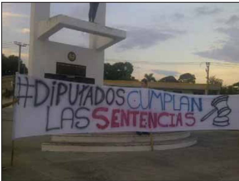
La derecha defiende sus cuotas de poder

cuestionado y sin competencia, en lugar de respetar las sentencias de la Sala de lo Constitucional..." ( http://www.anep.org.sv ).