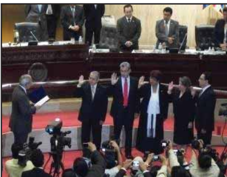
EL SALVADOR.- La crisis del sistema de dominación