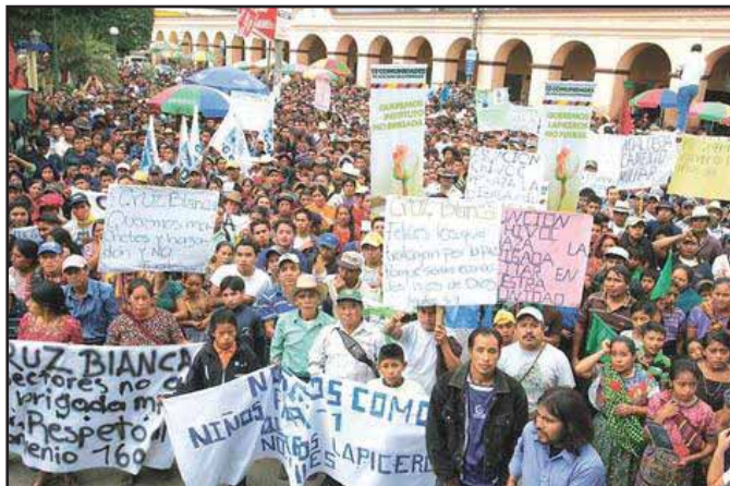
Protesta contra la brigada militar en San Juan Sacatepéquez

relacionada a la no instalación de la base militar de San Juan Sacatepéquez no fue escuchada, ni tomada en cuenta, ya que solo se reubicará, pero siempre será instalada. Esto acentúa los niveles de tensión y conflictividad social existentes con los actuales patrullajes del ejército.