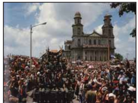
NICARAGUA.- A 33 años del triunfo de la insurrección popular de 1979