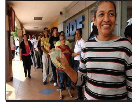
NICARAGUA: Aumento de salarios YA!!