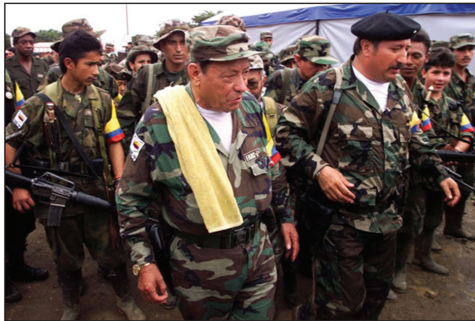
La dirigencia histórica de las FARC fue aniquilada

En 1958, preocupados por la situación de violencia, los Partidos Liberal y Conservador firmaron un pacto político, de alternancia en el gobierno, llamado Frente Nacional, que duró hasta 1974. Los diferentes gobiernos del Frente Nacional tuvieron como principal meta acabar con las "repúblicas independientes", refiriéndose a amplias zonas campesinas liberadas y bajo