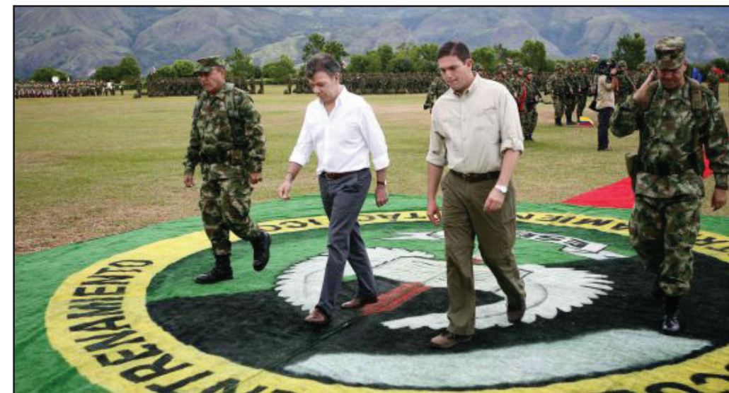
El Presidente Juan Manuel Santos y el ministro de defensa Pinzon

Las maniobras del Congreso y la Corte se ven venir. El movimiento popular, sindicatos y gremios deben llamar a movilización nacional para oponerse a la creación de las RED, la pretensión de los políticos es poner al servicio del capital zonas estratégicas como el Golfo de Fonseca y costas del norte del país. ■