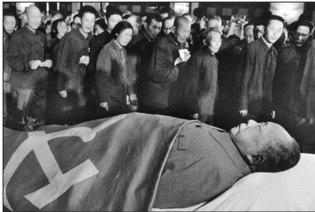
El cuerpo de Mao Tse Tung es velado en Pekin

La burguesía china que ya identifica sus intereses como contrarios a los obreros y campesinos, tomó el desprestigiado Komunitang (partido de gobierno) usando a su caudillo Chiang Kai Shek, que apoyado por