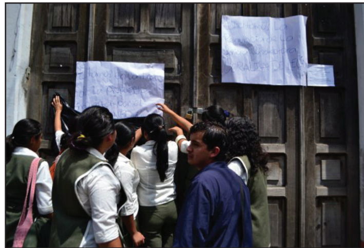
Toma del Instituto Belen

El martes 18 de septiembre la ministra de educación Cynthia del Águila anunció en conferencia de prensa la propuesta final del Ministerio en torno a la transformación de la carrera de magisterio. Respaldada por el presidente Pérez Molina, la vicepresidenta y sus viceministros, la ministra presentó básicamente el mismo planteamiento que hizo desde marzo: que los estudiantes cursen por dos años un bachillerato con orientación en educación y luego tres años de especialización universitaria. El 16 de agosto la Mesa Técnica que elaboró la propuesta de Formación Inicial Docente había presentado