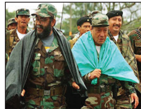
COLOMBIA: La derrota militar de las FARC y la negociación