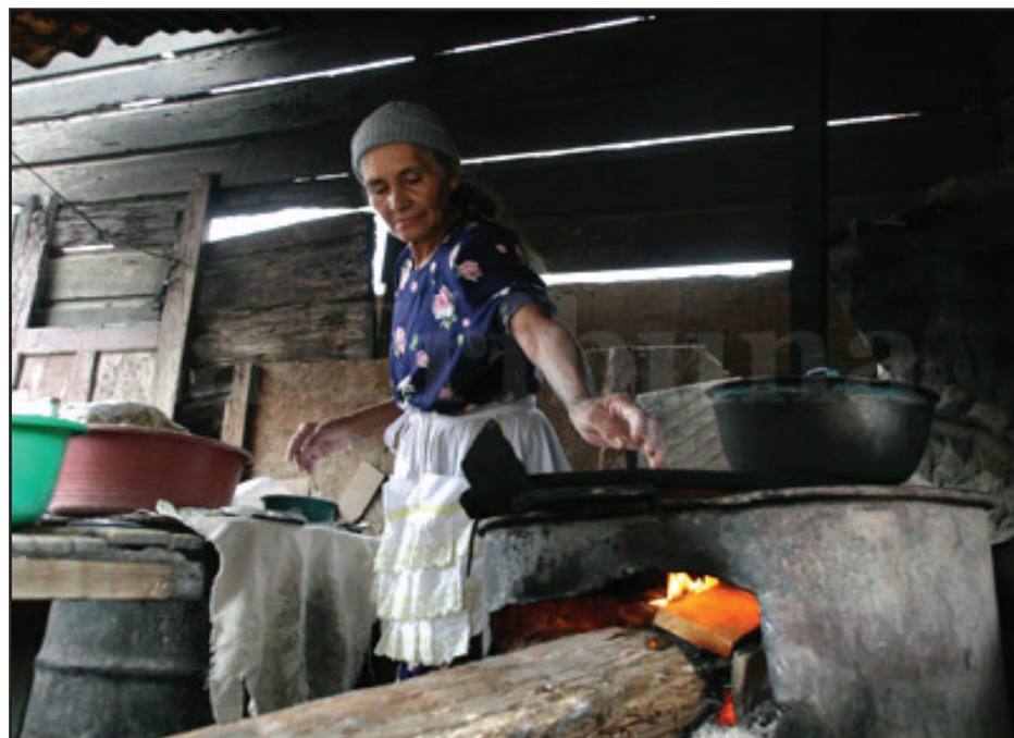
La pobreza aumenta día a día en Honduras

las variaciones económicas repercuten de forma directa en la lucha de clases. Una variedad de movimientos sociales se manifiestan como respuestas ante los planes de ajuste y de miseria que imponen las clases hegemónicas para equilibrar la profunda crisis que atraviesa el modo de producción capitalista.