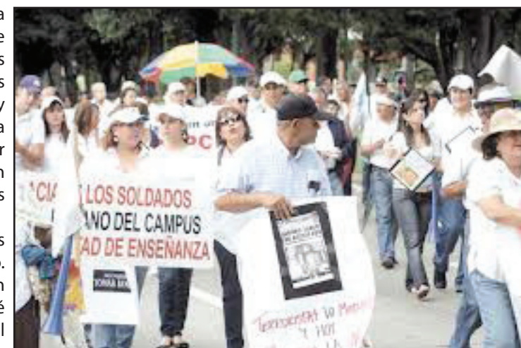
Familiares de militares presionan en las calles

políticos, y por ende en la posguerra se les considera un sector emergente de la burguesía nacional. El poder político evidentemente es necesario para que los distintos segmentos de la burguesía militar sigan manteniéndose a flote. Si miramos el caso del exgeneral Ríos Montt, tenemos un ejemplo concreto del caso: su poder político está en decadencia, está sindicado de genocidio. Cosa que no puede pasarle, por ahora, al presidente Otto Pérez Molina, acusado de crímenes de lesa humanidad contra la población Ixil. Por eso hay que pensar en la burguesía militar como cualquier otra burguesía tercermundista: con un oportunismo capaz de devorarse a sus hermanos más lerdos. ¿Será que el gobierno de este otro genocida saldrá al rescate de la dignidad militar? Probablemente no. ¿Quisiera