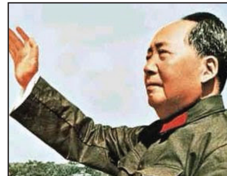
FECHAS: 9 de septiembre de 1976, fallece Mao Tse Tung

EL SALVADOR: GOBIERNO QUIERE QUE TRABAJADORES PAGUEN LA DEUDA