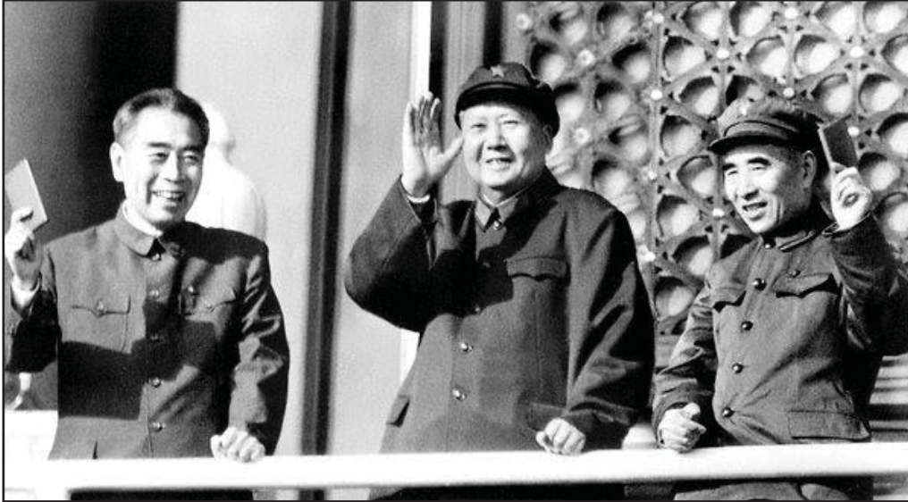
Chu En Lai, Mao Tse Tung y Lin Piao, la cupula dirigente del PCCH

La victoria del Ejército Popular de Liberación dirigido por el Partido Comunista Chino y Mao Tse Tung a la cabeza de éste, un 1 de octubre de 1949, marca el inicio de la revolución socialista en la nación más poblada del mundo, dejando importantes lecciones para la revolución mundial.