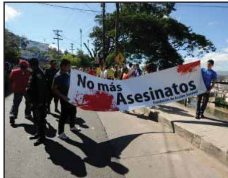
HONDURAS.- ¿Y que esperamos para detener la ola de asesinatos?