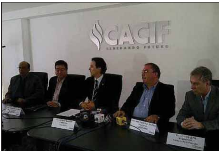
Empresarios del CACIF derramaron lagrimas de cocodrilo por la masacre en Totonicapán

El Partido Socialista Centroamericano (PSOCA) rechaza la persecución legal que el CACIF pretende hacer contra los dirigentes campesinos, y exhorta a las organizaciones indígenas y campesinas a no desmayar y a no doblegarse frente a las coacciones ejercidas por parte de los sectores oligárquicos, a partir de los actos abiertos de represión llevados a cabo el jueves cuatro de octubre. La población debe buscar la unidad en función de canalizar las demandas que con el pasar de los días cobran mayor vigencia. ■