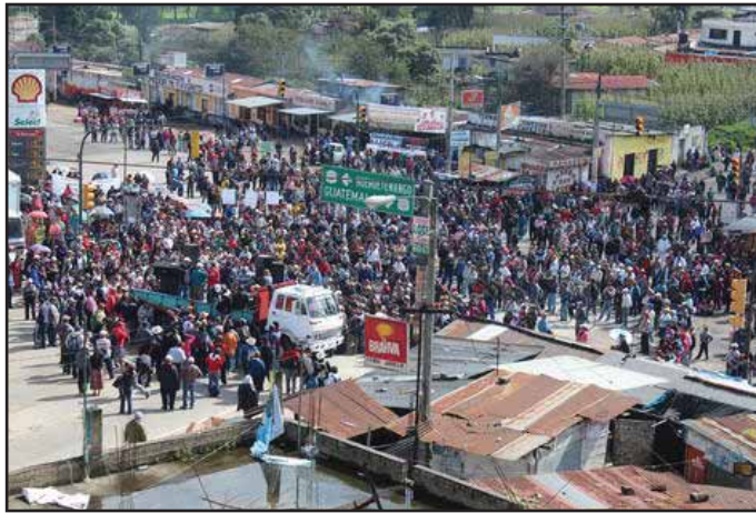
Bloqueo de Cuatro Caminos, antes de la masacre

Aún no está claro cómo se dieron los hechos. Si la masacre fue una orden directa de Pérez Molina y sus ministros de defensa y gobernación, ello significaría un giro dramático en la política del gobierno, hacia una represión cruda, descarada y abierta. Este es el análisis de una buena parte de la izquierda guatemalteca, que anuncia el regreso de los años 80s. Pero la situación es más compleja y tiene múltiples aristas. El gobierno del Partido Patriota no es un calco de los gobiernos militares de los años del conflicto armado. 30 años no han pasado en balde. Pérez Molina pretende basar su gobierno en una democracia burguesa –sesgada, plagada de imperfecciones y parcializada hacia los poderosos- que mal que bien le exige seguir reglas. Guatemala tiene actualmente la presidencia temporal del Consejo de Seguridad de la ONU y el presidente se ha presentado como el adalid de las formas alternativas de combatir el narcotráfico. Dar la orden de asesinar indígenas en una protesta pública acarrearía la desaprobación de la comunidad internacional y el desprestigio. La embajada de los Estados Unidos y el secretario general de la OEA ya han pedido una investigación, lamentando lo acontecido. La masacre de