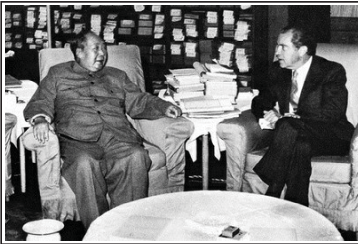
Mao negocia con el presidente Richard Nixon

cuestionó el enquistamiento en el poder de estas capas parasitarias propias de la transición al socialismo en momentos de flujo y reflujo de la lucha de clases a nivel mundial. Al final fue detenida ante el temor del surgimiento una auténtica democracia socialista, y las distintas capas burocráticas hicieron frente común para desarmarla. El saldo es conocido: tras esto, Mao fue perdiendo fuerza en la dirección, del Estado y del partido, los sectores más reaccionarios empezaron a