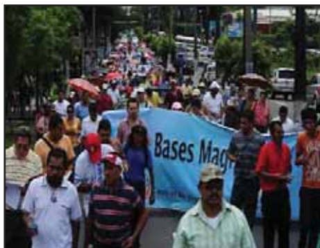
EL SALVADOR.- El magisterio sigue firme en lucha por justas demandas

GUATEMALA: QUE UNA COMISIÓN INDEPENDIENTE INVESTIGUE LA MASACRE DE TOTONICAPÁN