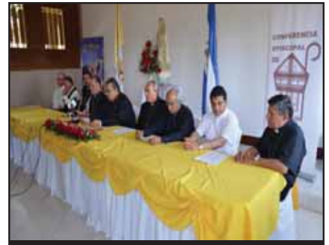
NICARAGUA.- Crítica a la Carta Pastoral de la Conferencia Episcopal