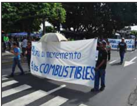
EL SALVADOR.- Ruina de transportistas y negocio con el petróleo

HONDURAS: LLAMADO A CONFORMAR EL COLECTIVO "MANUEL FLORES ARGUIJO"