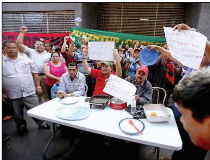
Trabajadores protestan para que el gobierno pague los salarios

Docente les concede ese derecho para trabajar a tiempo completo en beneficio de sus agremiados; se prohíben las deducciones mensuales de aportación a los colegios magisteriales, préstamos de colegios, financieras, cooperativas o bancos que tuvieran los docentes,