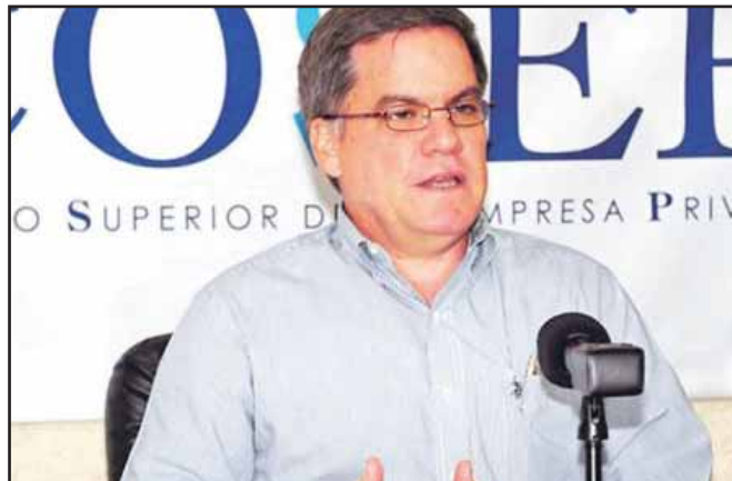
El COSEP está feliz con la reforma tributaria

garantiza a toda costa los beneficios fiscales para las Zonas Francas (maquilas), por el otro lado, la Comisión Tripartita del Salario Mínimo para el Sector Maquila se apresuró a aprobar un "Acuerdo Salarial" para el período 2014-2017 de un mísero 8% anual. Este acuerdo, avalado por el Ministerio del Trabajo y las Centrales Sindicales sandinistas (dos de los tres miembros