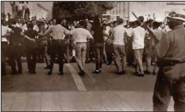
La Guardia Nacional se prepara a disparar contra los manifestantes

Esta cooperación política de los conservadores comenzó cuando Emiliano Chamorro, jefe de la fracción parlamentaria de su partido votó la "amnistía" para los asesinos confesos del Gral. Sandino en 1934, pasando