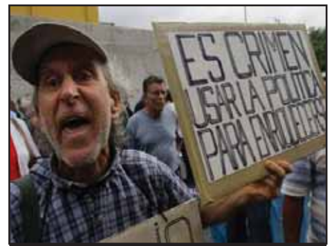
COSTA RICA.- Sigue la lucha por un justo aumento de salarios