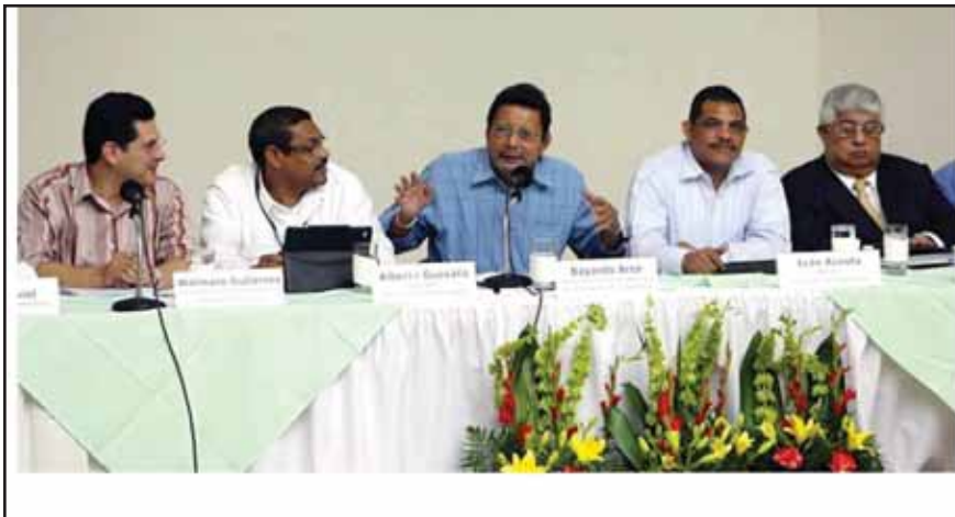
El equipo económico del gobierno sandinista

A fin de congraciarse con la clase media, el gobierno efectivamente aumentó para los asalariados el techo exento de pago de Impuesto sobre