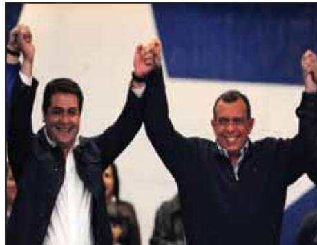
HONDURAS.- Bonapartización del régimen Lobo- Hernandez