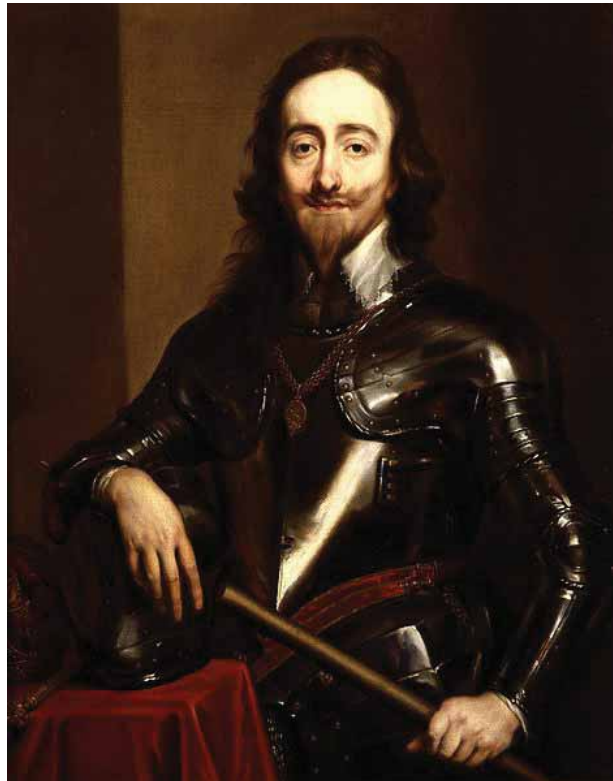
Carlos I de Inglaterra

la guerra. Las batallas más importantes serían las de East Anglia, la batalla campal de Marston Moor y la indecisa Segunda Batalla de Newbury. En esa época tuvo un altercado con el duque de