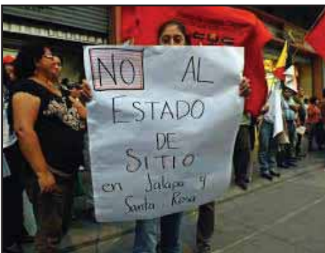
GUATEMALA.- !!Alto a la represión en Jalapa y Santa Rosa!!

VISITA DE OBAMA: TIRÓN DE OREJAS A LOS GOBIERNOS DEL SICA