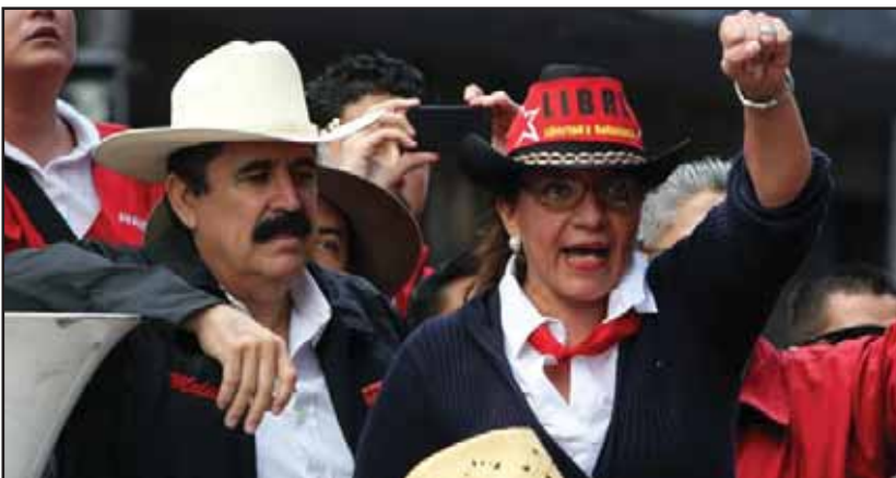
Las encuestas dan como ganadora a Xiomara Castro de Zelaya

Xiomara Castro lideran las encuestas con una cifra paupérrima del 18.67%, mientras que Salvador Nasralla con un 17.33%, seguido de Juan Orlando Hernández con un 16.33% y Mauricio Villeda con el 10.33% (encuesta Le Vote, El Herald, 22/4/2013). El país atraviesa la peor crisis jamás vista en la historia. Al pueblo lo que más le interesa es que llegue un gobierno que desbarate la criminalidad, el alto índice