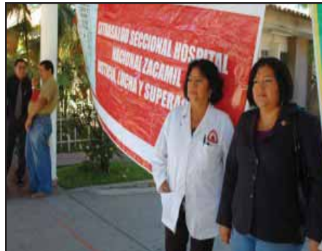
EL SALVADOR.- Recurrentes luchas de trabajadores del Hospital Zacamil