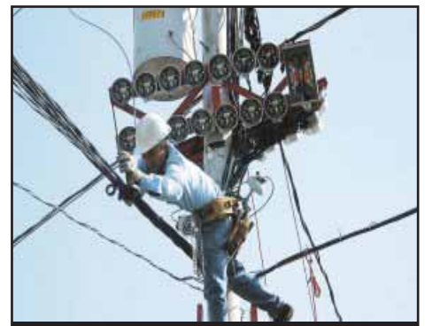
NICARAGUA.- Por la nacionalización de la industria eléctrica