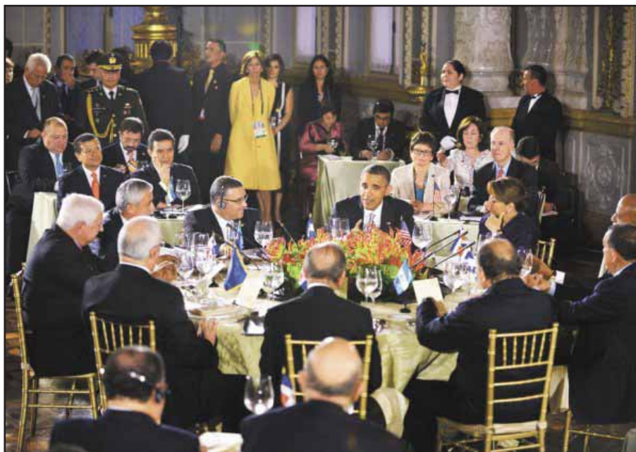
Barack Obama cenando con los presidentes centroamericanos

La segunda visita de Barack Obama a Centroamérica, el 3 y 4 de Mayo del año 2013, y su reunión con los presidentes del Sistema de Integración Centroamericana (SICA) estuvo marcada por la secretividad, y por el énfasis en el libre comercio, la integración económica regional y la conversión definitiva de Centroamérica en un área de libre comercio, tutelada por Estados Unidos.