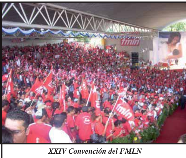
XXIV Convención del FMLN

economía de privilegios la que debemos desmontar. Para ello necesitamos un estado fuerte y efectivo, el estado social y democrático de derecho, la institucionalidad y la igualdad ante la ley, un estado capaz de corregir las fallas del mercado. No vamos a acabar con la propiedad privada y menos con el mercado. Mi gobierno será el mejor defensor de la iniciativa privada, porque entiende que para repartir con equidad y justicia la riqueza, primero hay que producirla. Y para ello necesitamos que los emprendedores privados y el Estado sellen una fuerte alianza desde el inicio. Mi gobierno, por el contrario, construirá una alianza entre el Estado, los grandes, pequeños y medianos empresarios del campo y la ciudad, los trabajadores y los sectores excluidos.