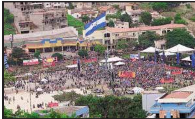
La CNRP aportó manifestantes para el acto de adhesión al ALBA

Estas declaraciones del Presidente Zelaya son una falacia, y es una campaña publicitaria para impresionar a los demás presidentes. Zelaya necesita una base social que lo apoye y esa base social es el movimiento