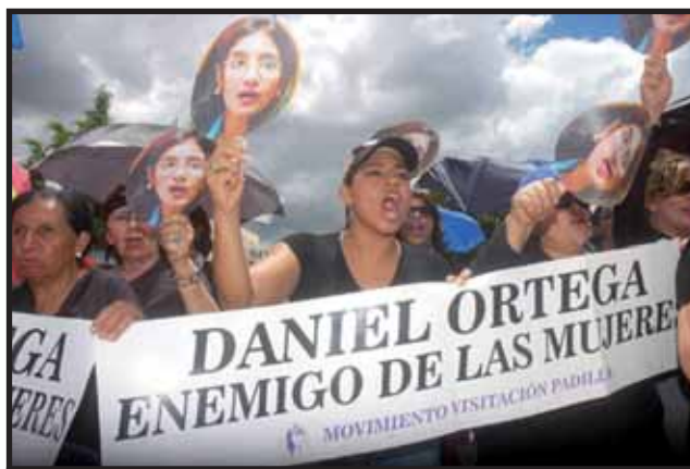
Activistas del Grupo “Las Chonas” protestan contra la presencia de Daniel Ortega en Honduras

Es respetable la posición asumida por las Chonas. En cambio, es totalmente repudiable la conducta del presidente Daniel Ortega, ya que cuando fue acusado de delitos de abusos deshonestos, violación y acoso sexual en contra de su