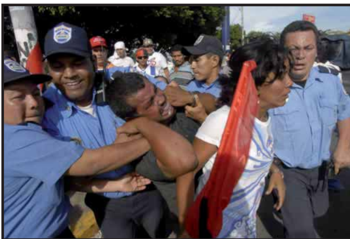
La Policía Nacional reprime a simpatizantes sandinistas que atacaron al Grupo PUENTE

Paradójicamente, el gobierno ha venido enarbolando un discurso en Pro de la unidad y reconciliación nacional, es así que los personajes y medios que han criticado al gobierno, como el otrora símbolo de la revolución