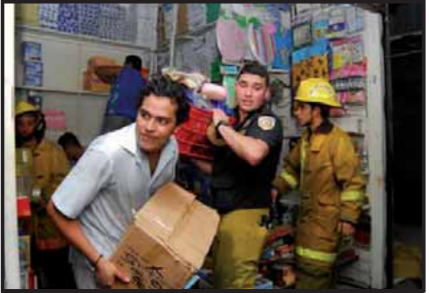
Comerciantes salvando su mercadería durante el siniestro

El Gobierno, ha otorgado un préstamo de 3.5 millones de dólares, el cual beneficiara a 700 comerciantes. Este préstamo proviene del Banco de Desarrollo Económico y Social de Venezuela (BANDES), y será asignado a los comerciantes por CARUNA, un Banco del Gobierno en turno, a mejor dicho de la familia Ortega Murillo. Cada comerciante tendrá acceso a 5 mil dólares, el cual será pagado en tres años y con el 3% de interés anual. Con esto el Gobierno trata de dar la impresión de ser el único que se preocupa por la tragedia ocurrida