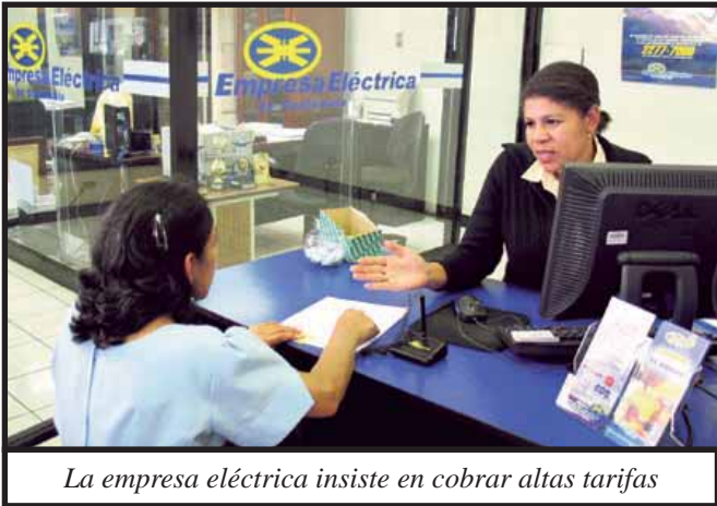
La empresa eléctrica insiste en cobrar altas tarifas