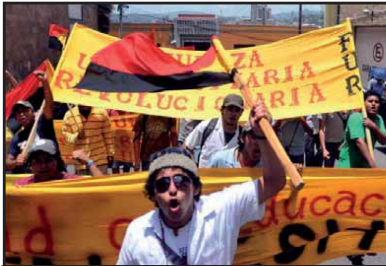
Manifestación en Tegucigalpa durante el III Paro Cívico

una estrategia para la redistribución permanente de la riqueza, reducción drástica del costo de las remesas, educación pública gratuita, derogación del contrato con Semeh y plantas térmicas. Un programa eminentemente democrático.