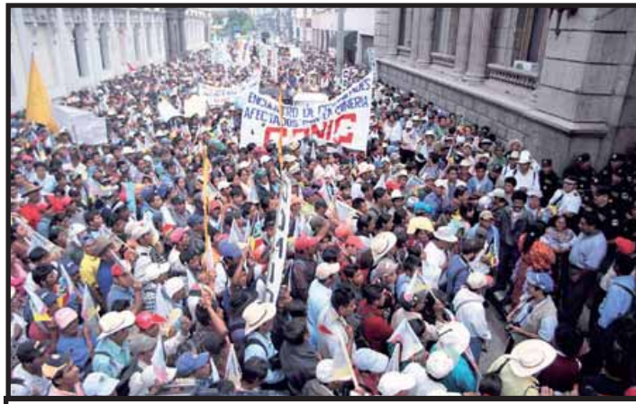
Marcha campesina de la CONIC frente al Congreso

Según Colón ellos tienen razón en cuanto al incumplimiento, el cual, dijo, no es producto de la mala fe, sino de la inviabilidad de los proyectos. Además, el mandatario responsabilizó al ex ministro de agricultura, Raúl Robles, de incumplir algunas de las promesas. El jefe del ejecutivo dijo que Robles ofreció programas de producción agrícola y tierras que costaría al Estado, máquina de opresión, casi Q400