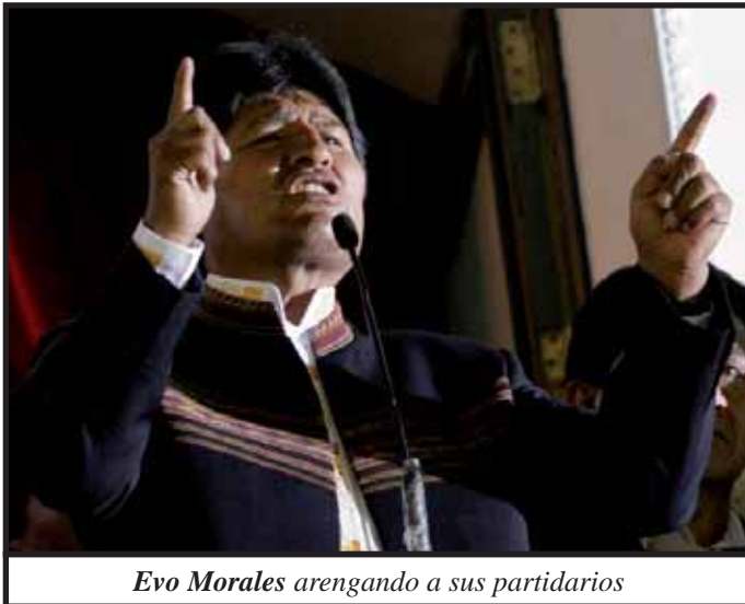
Evo Morales arengando a sus partidarios