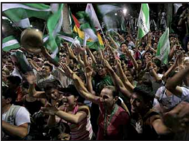
Partidarios del opositor Gobernador de Santa Cruz

La huelga del 19 de agosto persigue exigir al Gobierno: "que devuelva a las autonomías una renta petrolera que el Gobierno destina desde principios de año a pagar una ayuda a los mayores de 60 años." (El País 20/08/2008). Medida que fue asumida por Morales para debilitar económicamente a las provincias, pues redujo sus ingresos procedentes del Impuesto Directo a los Hidrocarburos.