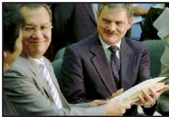
El ministro de finanzas Alberto Fuentes Knight (derecha) entrega "Proyecto de Reforma Fiscal" al Presidente del Congreso.

Los socialistas revolucionarios denunciamos al gobierno de Cólom y la UNE, que una vez más se ha doblegado ante la voluntad y la presión de los capitalistas explotadores guatemaltecos, que en una actitud reaccionaria no aceptan ni la reforma fiscal moderada se proponía. Llamamos a los trabajadores asalariados del campo y la ciudad, a los campesinos pobres, a los desempleados y a las masas populares a exigir del gobierno una verdadera reforma fiscal que castigue a los que siempre han controlado las riquezas del país. ■