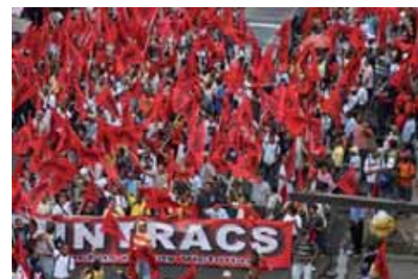
Paro Nacional de 24 horas el 4 de Septiembre.- Panamá (Pág.- 14)