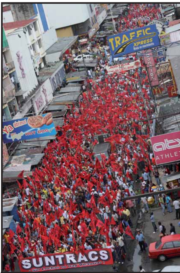
Marcha del 14 de Agosto