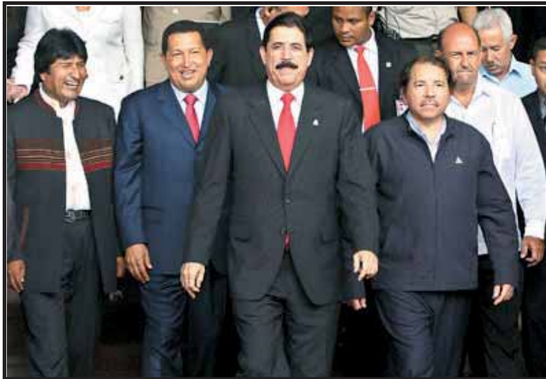
"Mel" Zelaya airoso encabeza a los Presidentes del ALBA

Al diputado Ham se le olvido decir que en el caso de Honduras el sector productivo agrícola está en manos de los terratenientes, ya que la mayoría de nuestros campesinos no tienen tierra para producir. También lo anormal de este convenio con Petrocaribe es que en la reciente visita de funcionarios del FMI, estos avalaron dicho acuerdo, solo se limitaron a expresar lo siguiente: "consideramos que la creación de un Fideicomiso en el Banco Central de Honduras para