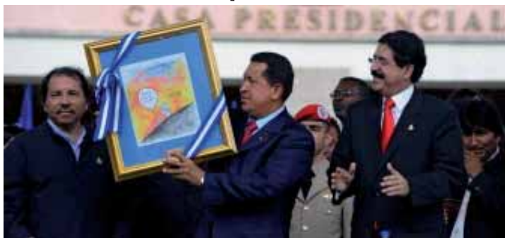
Adhesión de Honduras al ALBA (Pág.- 12)

Después del Referendo: BOLEA EN EL LABERINTO DE LA DEMOCRACIA BURGUESA