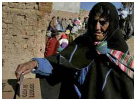
¿Que reflejó el Referendo Revocatorio?.- Bolivia (Pág.-20)