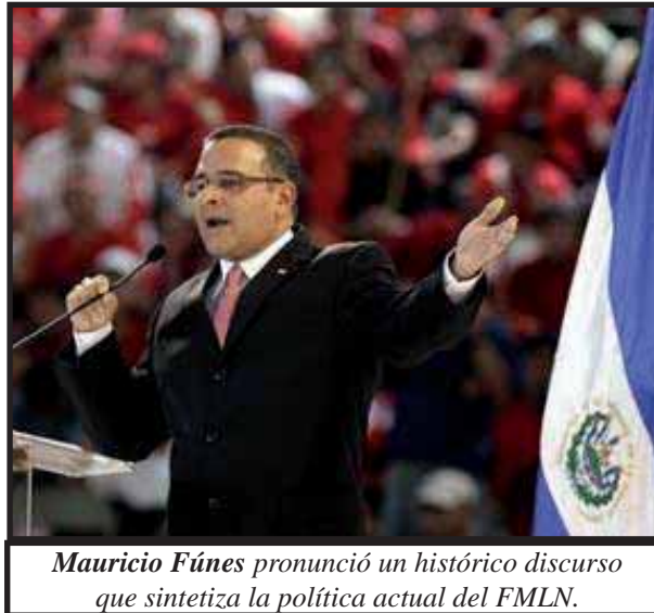
Mauricio Funes pronunció un histórico discurso que sintetiza la política actual del FMLN.

La XXIV Convención Nacional delegó en el Consejo Nacional del FMLN la aprobación de la lista de diputados, aparentemente en un compás de espera para formar con otros partidos