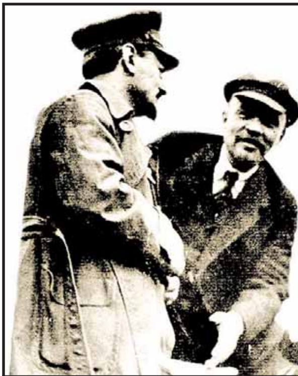
León Trotsky y Vladimir Lenin en 1918

espionaje soviético en la Alemania nazi, comentando las atrocidades del estalinismo se pregunta y responde: “¿Pero quien protesto en aquella época? ¿Quién se levantó para gritar su hastío? –Los trotskistas pueden reivindicar este honor. A semejanza de su líder, que pago su obstinación con un pioletazo, los trotskistas combatieron totalmente el estalinismo y fueron los únicos que lo hicieron. En las épocas de las grandes purgas ya solo podían gritar su rebeldía en las inmensidades heladas, a las que los habían conducido para mejor exterminarlos. En los campos de concentración, su