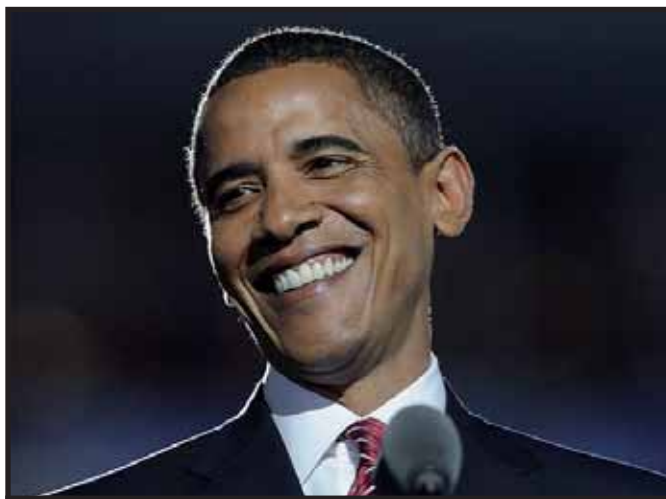
Barack Obama personifica el populismo imperialista

Contrario a lo que pueda pensarse, el discurso cautivante de Obama ayuda a revitalizar las alicaídas instituciones de la democracia burguesa en Estados Unidos. Devuelve la credibilidad en el sistema, sobre todo en la juventud, uno de los segmentos sociales que mas apoya su candidatura. Sin embargo, en la medida en que Obama fue obteniendo triunfos en las elecciones