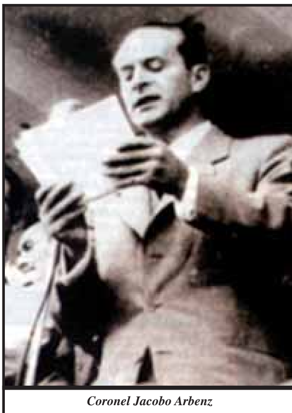
Coronel Jacobo Arbenz

En junio de 1944 el estudiantado universitario inició la lucha frontal contra la dictadura. Ese mes fueron distribuidos clandestinamente miles de volantes invitando a la población a sabotear la celebración del 30 de junio (aniversario del triunfo de la Revolución Liberal de 1871), cuyo desfile encabezaría Ubico. El 14 fue apresado un grupo de estudiantes por causa de un delator. El encarcelamiento generó protestas parte de círculos estudiantiles y profesionales, que exigieron la renuncia de las autoridades