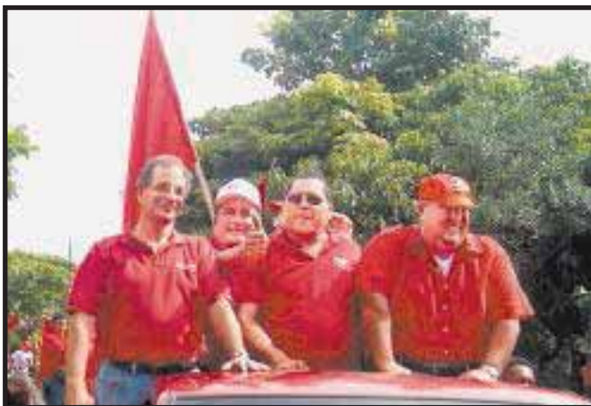
Eduardo Montealegre y Arnoldo Alemán hacen campaña conjuntamente.

Aunque el liberalismo se ha presentado unificado en las actuales elecciones municipales, tanto Alemán como Montealegre reflejan proyectos políticos diferentes. En una simbiosis dialéctica, Alemán pretende sumar los votos que Montealegre consiguió en las últimas elecciones presidenciales, y con ese caudal electoral redefinir en una negociación las cuotas de poder