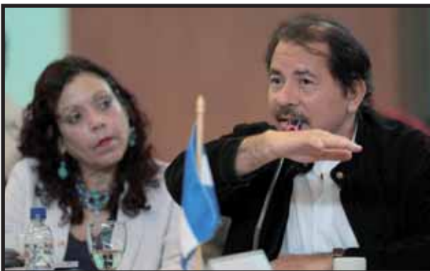
Rosario Murillo, esposa de Daniel Ortega, encabeza el ataque contra las organizaciones feministas.

Los revolucionarios propugnamos la emancipación de la mujer, y criticamos el feminismo burgués (tanto el de las organizaciones "feministas" como el de Doña Rosario), pues buscan "maquillar" el patriarcado mediante "reivindicaciones civiles". La opresión del hombre hacia la mujer es una extensión de la opresión del hombre por el hombre, paradigma del capitalismo; por lo tanto, las mujeres sólo lograremos la igualdad combatiendo al capitalismo y su ideología de opresión: El Patriarcado. ■