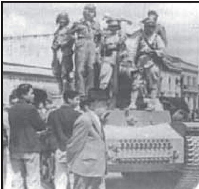
Fuerzas Rebeldes durante la Revolución de Octubre

A esta efervescencia organizativa y reivindicativa, Ponce Vaides