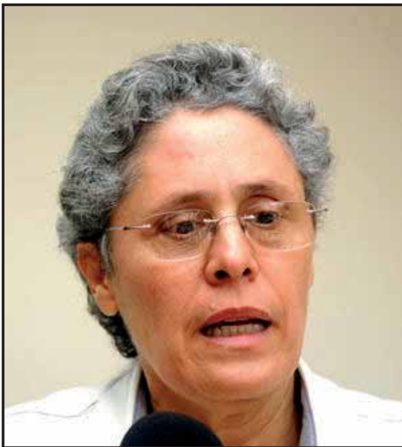
Dora María Téllez llama a votar por el PLC