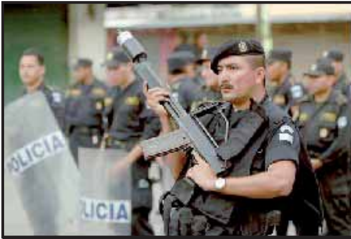
100 policías y 100 soldados fueron enviados a Coatepeque