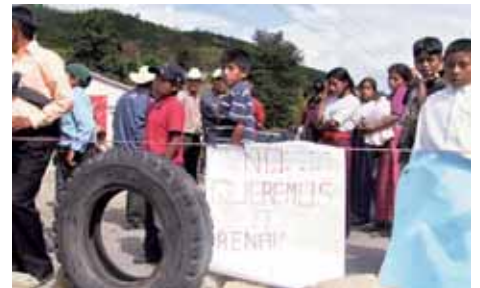
Pobladores rechazan el RENAP.- Guatemala (Pág.- 18)

Elecciones en EEUU: "CRASH FINANCIERO" Y POPULISMO IMPERIALISTA