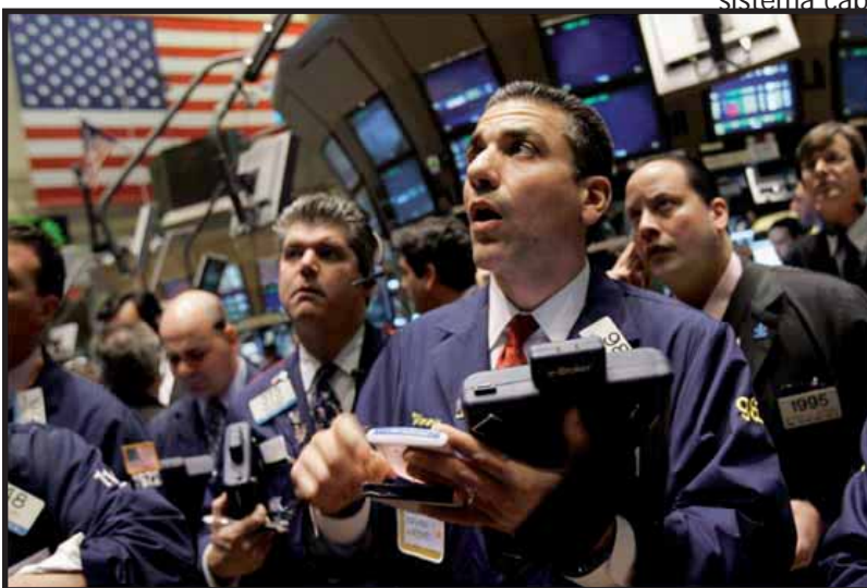
La crisis financiera catapultó el liderazgo de Barack Obama

Independientemente de las promesas del candidato Obama, debemos luchar por la nacionalización de la banca bajo el control de los sindicatos. Los sindicatos del sector financiero están llamados a jugar un rol importante en esta crisis. Es hora de presentar la alternativa de los trabajadores y del pueblo. ■