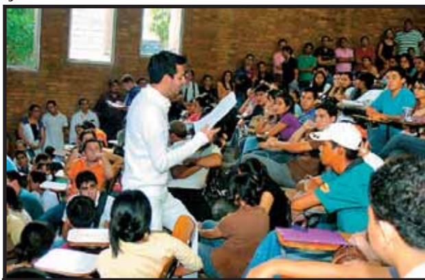
Asamblea de estudiantes de Medicina

Como todas las cosas en este país, La Educación y la Salud son un negocio redondo, como un ejemplo claro y concreto la Universidad Católica que recibe más de 100 millones de