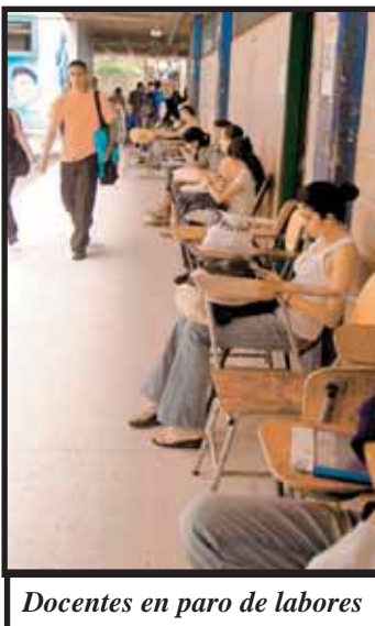
Docentes en paro de labores

Los docentes seguirán en asambleas para determinar si continúan realizando medidas de presión a pesar de que estas afectan de manera directa al estudiantado de la UNAH. En medio del paro los profesores denunciaron violaciones al Estatuto del Docente y ratificaron que no se someterán al proceso de evaluación que establece la Ley Orgánica.