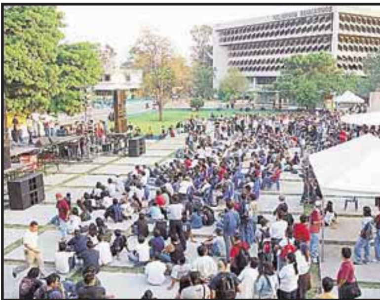
Universidad de San Carlos

El tema se volvió a tocar, junto a otros temas, el miércoles 14 de este mes en una reunión entre el Consejo Superior Universitario (CSU) y la Asamblea General de Estudiantes Universitarios, conformada por distintas unidades académicas y algunos grupos políticos. La respuesta del CSU fue nuevamente de medias tintas, pues tras las jornadas de febrero se pedía el desacato a la resolución de la corte, algo que se negó y se acordó hacer consultas a instancias que trabajan el tema legal y suspender momentáneamente las elecciones. En esta ocasión el CSU planteó que un desacato traería la