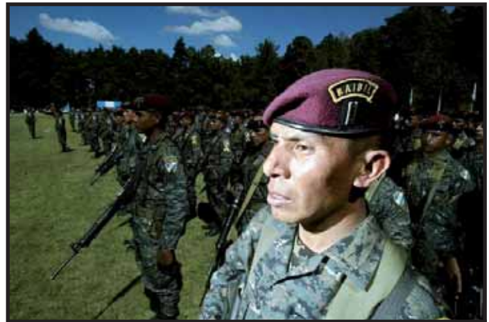
Cólom refuerza a los Kaibiles , la fuerza represiva élite del Ejército Guatemalteco.

No es casualidad que en la reapertura de la base de Izabal, zona de conflictos campesinos, estuviera presente el embajador gringo Stephen