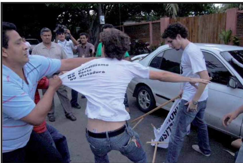
Militantes del FSLN reprimen violentamente al "Grupo NO"

Hay que exigir una reforma electoral que permita la participación ciudadana, ya estamos cansados de los mismos Partidos Políticos que lejos de sacar al país adelante lo siguen hundiendo en la miseria y la pobreza e n r i q u e c i e n d o solamente la misma clase social a la que ellos pertenecen. Hay que organizar más movimientos de jóvenes universitarios que al igual que el "Movimiento No", sean independientes. Ya desde hace varios años el Frente Sandinista ha perdido el control de las Universidades y de los Movimientos Estudiantiles, ahora los reprime y no los permite organizarse.