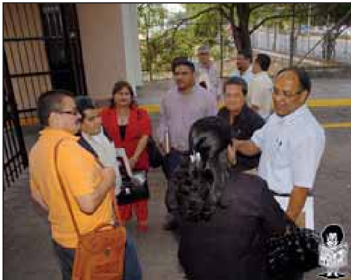
Delegación del Magisterio en diálogo con el Gobierno