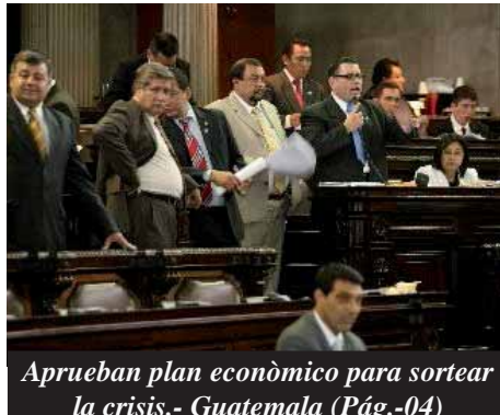
Aprueban plan económico para sortear la crisis.- Guatemala (Pág.-04)