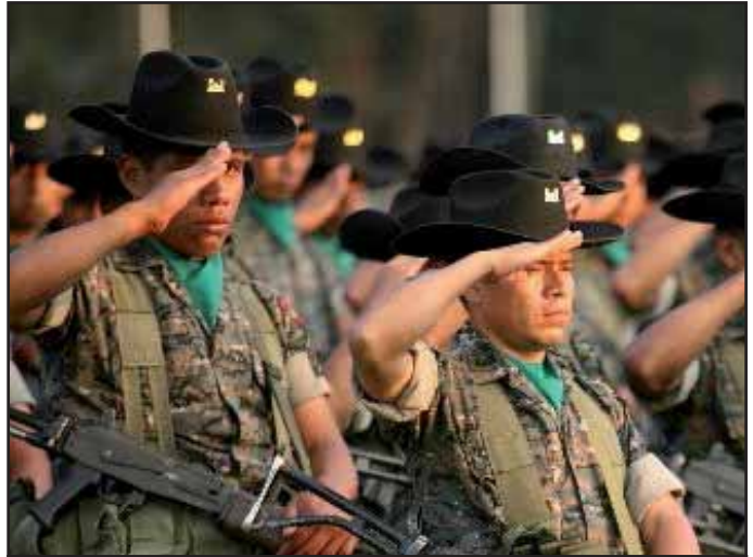
La burguesía guatemalteca no cesa en fortalecer su ejército

La lucha contra el narcotráfico no va poder ser detenida mientras las ganancias de este negocio no sean controladas, específicamente los márgenes que obtienen bancos de las naciones imperialistas, por lo tanto en el sistema capitalista regido por la