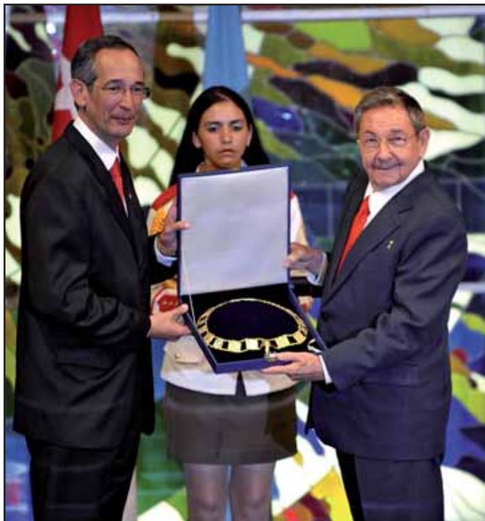
Álvaro Colom entrega a Raúl Castro la condecoración para Fidel Castro