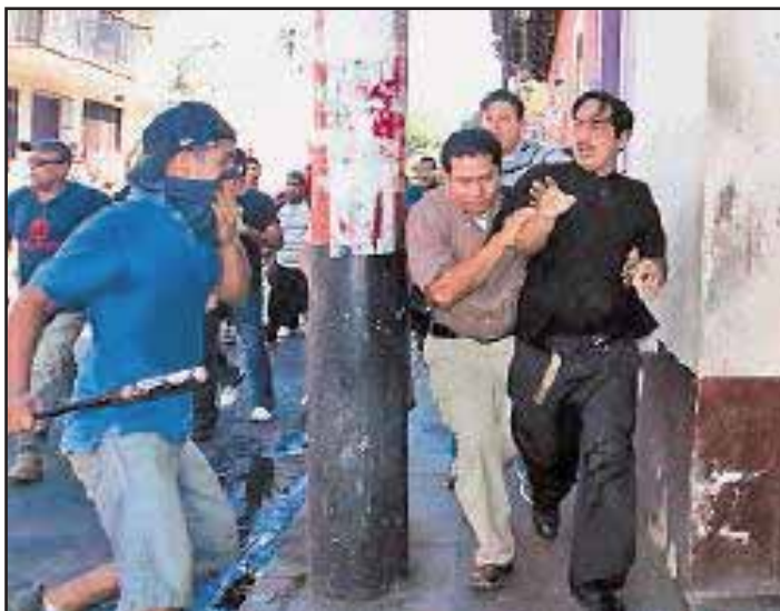
Enfrentamiento entre dos fracciones de la burocracia de UNEN

La división y los constantes conflictos políticos por conseguir mayores cuotas de poder dentro de las filas del partido gobernante, ha llegado hasta la Unión Nacional de Estudiantes de Nicaragua (UNEN) , organismo encargado del manejo del presupuesto asignado a las universidades subvencionadas por el Estado, y que históricamente ha sido el brazo armado de las "luchas sociales" dirigidas por el FSLN, siempre fiel a los intereses partidarios del actual gobierno.