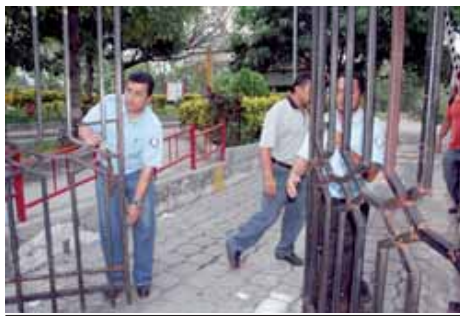
¡Alto a la represión contra el SETUES!.- El Salvador (Pág.- 14)