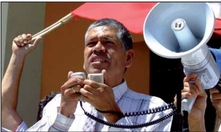
Rufino Quezada, Rector de la UES

En las diferentes luchas que se libran en el interior de la UES, las autoridades del CSU han manejado una estrategia que consiste en la total desaprobación, recurrir al desprestigio de quienes están al frente de las luchas, y el uso de aparato represivo