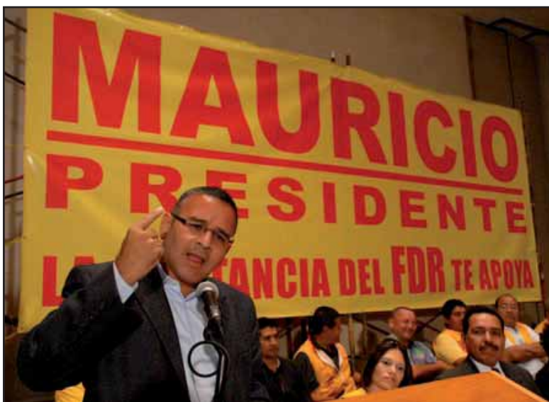
Mauricio Funes recibió el apoyo de una de las fracciones del FDR

Los resultados electorales del pasado 18 de enero permiten medir que tan cerca está el FMLN de ganar las elecciones presidenciales, aunque los resultados lo ubican como primera fuerza por la cantidad de votos, ARENA conservo casi intacta su caudal electoral a nivel de Diputados. El FMLN no logro arrancarle ninguno. El incremento de diputados del FMLN fue