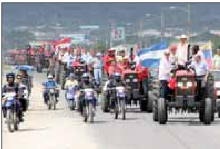
Tractores donados por el Gobierno de Venezuela

Pero en este evento gubernamental no solo estuvieron los "patricios", los "melistas", también acudieron a la cita representantes del Bloque Popular, una parte de los dirigentes de la Coordinadora Nacional de Resistencia Popular (CNRP), y casi todo el movimiento popular.