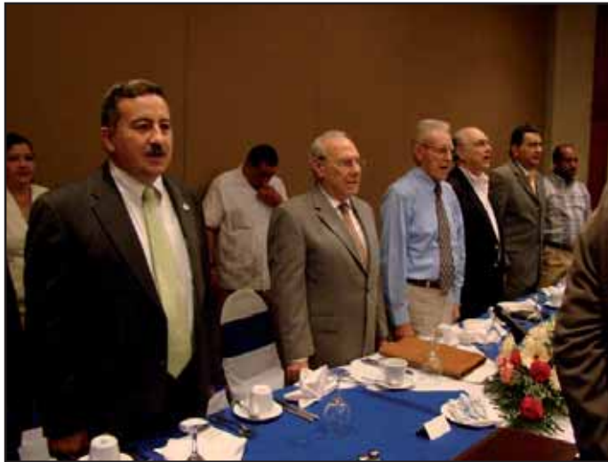
Rectores del CNU en reunión con el Vice Presidente Jaime Morales Carazo