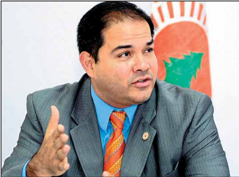
La dirigencia del PINU está ansiosa de aliarse con el Movimiento Popular.

luchas obreras y populares, para el triunfo de la revolución socialista en