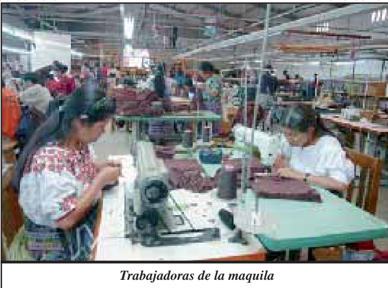
Trabajadoras de la maquila

Se han realizado varios intentos de forjar alianzas alrededor de temas puntuales, que constituyen importantes pasos adelante, esfuerzos de los que formamos parte. Sin embargo, los resultados aún están muy distantes de las necesidades de las luchas. Por ejemplo, la escasa participación de los miembros de las organizaciones que realizaron la actividad por los presos políticos, en especial Ramiro Choc, el 14 de febrero, es sintomático de las carencias de las corrientes revolucionarias guatemaltecas. Invitamos a las y los compañeros de estas agrupaciones a que realicemos un análisis colectivo de esta problemática. La crisis actual del capitalismo ofrece una oportunidad como pocas para su derrumbamiento por parte de los oprimidos, pero sin un movimiento revolucionario sólido que impulse y de coherencia a las luchas, la oportunidad se perderá y el capitalismo encontrará la manera de sobrevivir, como lo ha hecho en otras crisis. ■