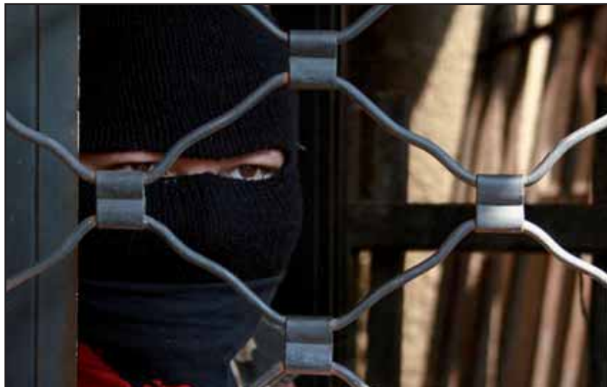
Miembros del SETUES deben usar capuchas para evitar represalias de la Rectoría.