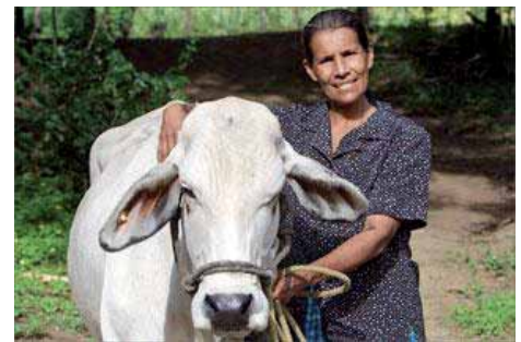
El gran negocio del Programa "Hambre Cero".- Nicaragua (Pág.-13)