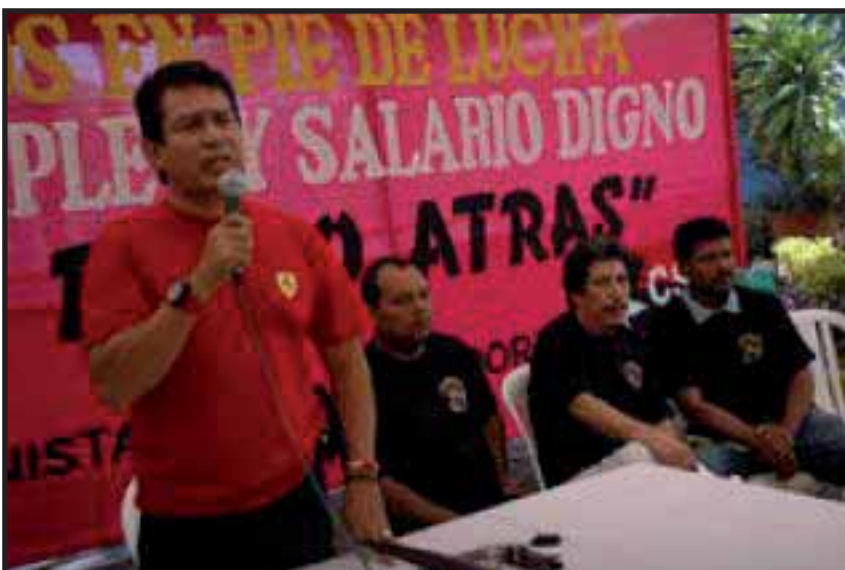
Los sindicalistas sandinistas guardan un silencio cómplice ante el recorte de las conquistas de los trabajadores del Estado

El gobierno sandinista sufre en la actualidad una crisis financiera, el Presupuesto General de la República se encuentra es fraco desfinanciamiento. Esto se debe a dos factores básicos elementales, el primero, es que por la crisis económica mundial las exportaciones han bajado, así como la actividad comercial se ha visto