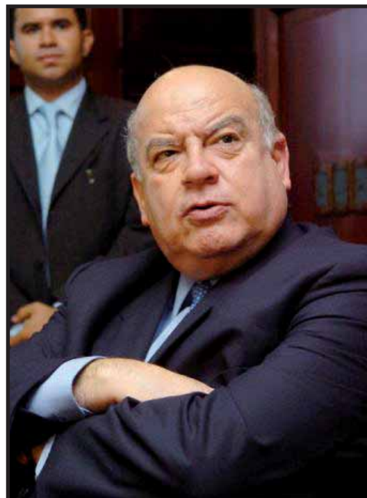
Jose Miguel Insulza recibió a una Comisión del gobierno golpista

Y las marchas blancas pasaron a la historia, ya no hay dinero para financiarlas pues se dice que muchos empresarios están retirando su aporte