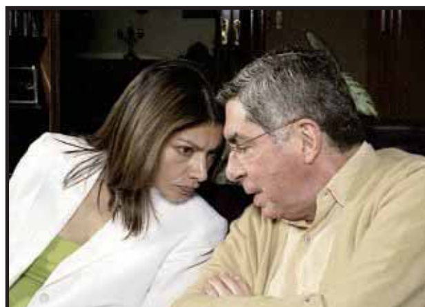
Laura Chinchilla recibe instrucciones de Oscar Arias

organizaciones de izquierda clasista, a realizar una Asamblea para empezar a discutir democráticamente la necesidad de unir fuerzas dentro de un marco programático común. Estamos a tiempo para lograrlo. ■