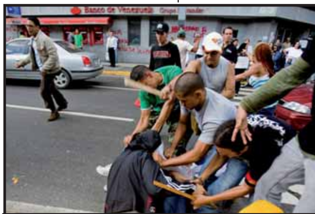
El chavismo comienza a utilizar métodos de ataques físicos contra los opositores

El cierre de 34 medios de comunicación no ayuda a elevar el nivel de conciencia y de organización de la clase obrera y sus aliados populares. En las condiciones actuales, el cierre de 34 medios de comunicación no puede ser considerado una medida anticapitalista, progresiva, sino todo lo contrario. La verdadera "democratización de la información" en Venezuela se producirá en la medida en que aumente el poder, la influencia y la independencia de la prensa obrera y popular. Bajo el capitalismo estas posibilidades son muy limitadas. La autentica ampliación de la libertad de