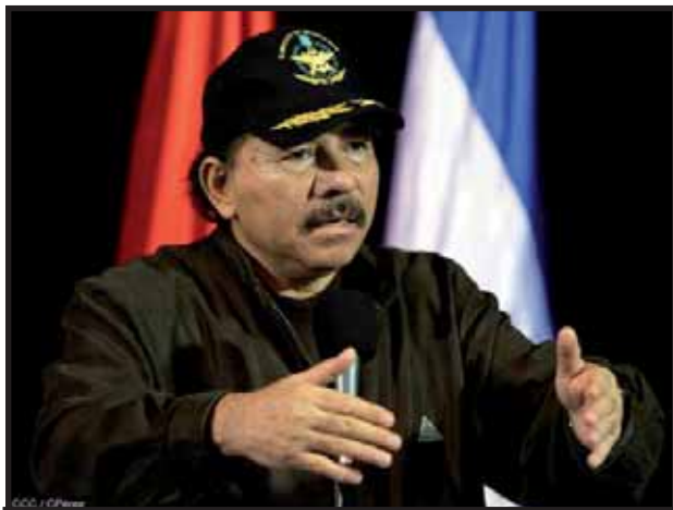
Daniel Ortega ha suavizado el discurso