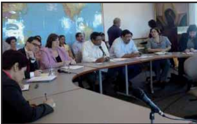
Grupo de Apoyo Presupuestario mantiene el chantaje económico sobre el Gobierno de Daniel Ortega

La fracción liberal de Eduardo Montealegre es la que se mantiene disidente, pero sin lograr desencadenar un movimiento de masas. Por el momento, la oposición al nuevo régimen bonapartista proviene únicamente del extranjero, de los países imperialistas donantes, quienes presionan por una apertura y por un compromiso democrático, al menos en el tema de la transparencia electoral. A nivel interno, solo la contrarrevolucionaria Iglesia Católica ha formulado críticas sistemáticas al gobierno de Daniel Ortega. Mientras los trabajadores y los jóvenes no se movilizan de manera independiente, Daniel Ortega podrá hacer de las suyas, pero no por mucho tiempo. ■