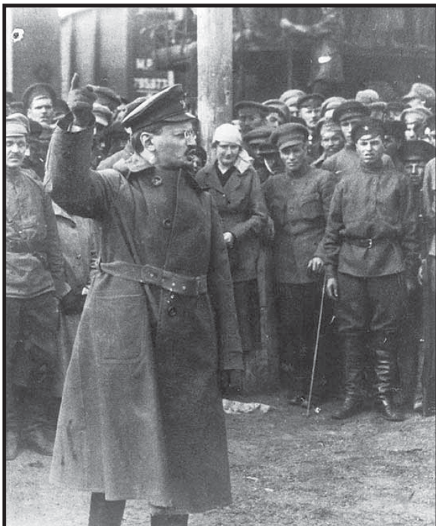
León Trotsky, durante la guerra civil, arengando a las tropas del Ejército Rojo