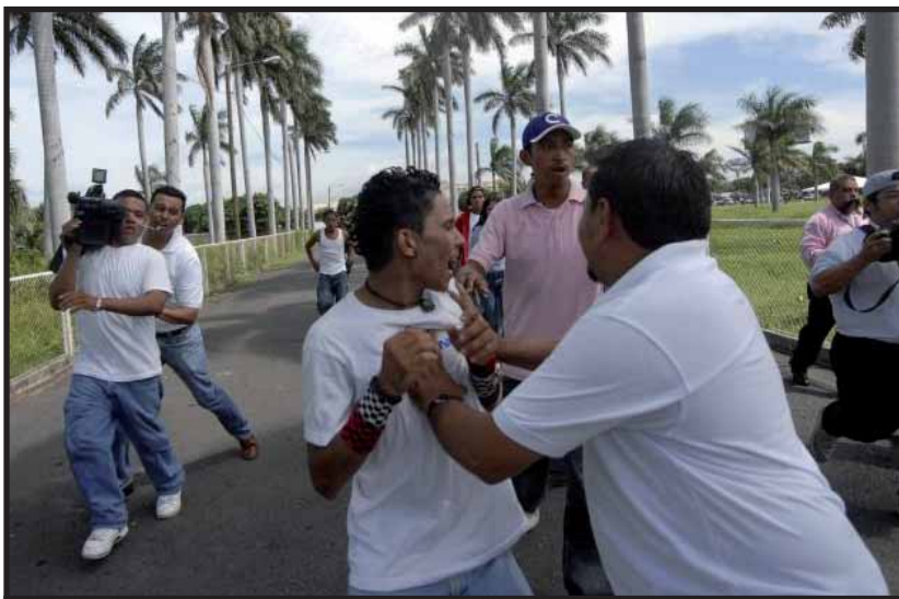
Simpatizantes sandinistas atacan a miembros de la Coordinadora Civil

Ante este endurecimiento del régimen político por parte del Frente Sandinista, no podemos dar marcha atrás y amedrentarnos ante estos ataques, todos tienen derecho a expresarse, debemos de seguir luchando conjuntamente a través de las movilizaciones masivas, solo de esta forma podremos frenar estos actos vandálicos con los cuales el déspota gobierno de Daniel Ortega y Rosario Murillo tratan de callar la voz del pueblo, de los estudiantes, de los obreros, los trabajadores y todas sus organizaciones. Solo organizándonos en una sola lucha y uniéndonos bajo la consigna de un Gobierno para los Trabajadores lograremos acabar con estos gobiernos burgueses y totalitarios.