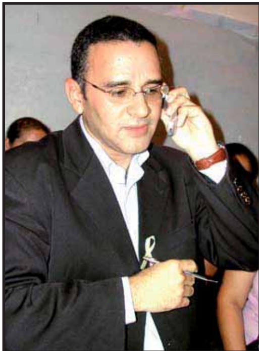
Mauricio Funes afirma que cien días es un período muy corto de evaluación