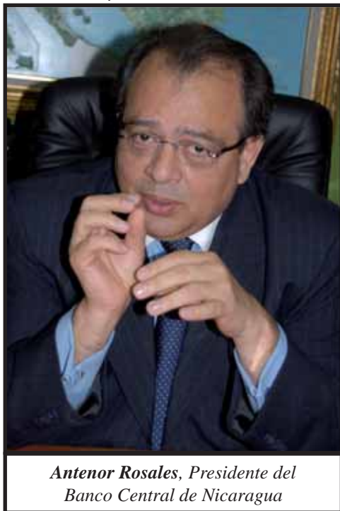
Antenor Rosales, Presidente del Banco Central de Nicaragua

quién según sus posibilidades. Esta realidad es aceptada por el Gobierno, que busca reducir: "ese riesgo regresivo que tiene la tributación actual que obliga a pagar más a los que tienen menos y crea protecciones fiscales a los que tienen más recursos y pagan menos". (Declaración de Wálmaro Gutiérrez.- www.pueblopresidente.com.-27/02/2009)