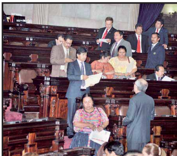
Diputados Oficialistas y opositores discuten la Reforma Fiscal

Al final de tantas negociaciones y regateos, el presidente y su gobierno se dieron cuenta de que el proyecto de reforma, manipulado, manoseado y recortado, ya no les servía para nada. No sólo no les permitiría obtener los ingresos urgentes para financiar el presupuesto, sino que, según un comunicado de prensa del Ministerio de Finanzas, "Las últimas propuestas de enmienda a la iniciativa original han sido erosionadas seriamente,