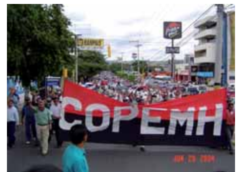
Lucha contra la burocracia sindical.-Guatemala.- Pág.-28

Las características especiales de los nuevos golpes de Estado