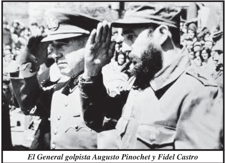
El General golpista Augusto Pinochet y Fidel Castro

Al pueblo de Chile le costó enormes esfuerzos deshacerse de la dictadura de Pinochet. A partir del referéndum de 1988, desafiando a los "milicos" asesinos, las masas salieron a las calles a enfrentar al régimen. Pero ocurrió el mismo fenómeno de siempre: los partidos burgueses que apoyaron el golpe de Estado y aclamaron a Pinochet como el "salvador de la Patria", se transmutaron en "demócratas" y lo exhortaron a abandonar pacíficamente el poder, porque temían profundamente