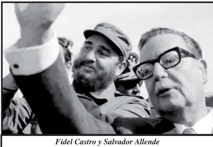
Fidel Castro y Salvador Allende