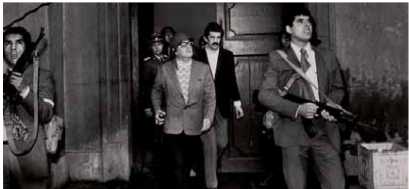
11 de Septiembre: 36 Aniversario del Golpe de Estado en Chile