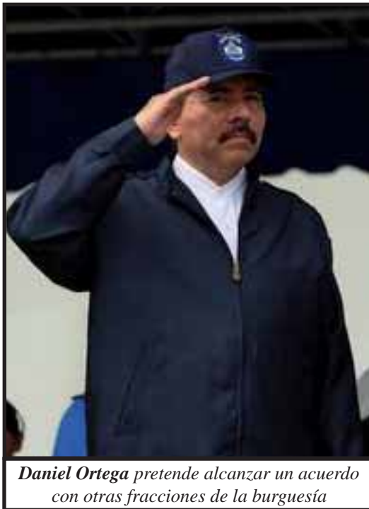
Daniel Ortega pretende alcanzar un acuerdo con otras fracciones de la burguesía

Esta es la gran pregunta. Si las fracciones de la burguesía (sandinista incluida) ven con agrado el actual sistema impositivo, ¿Cuál es entonces la motivación de la Reforma? ¿Por qué