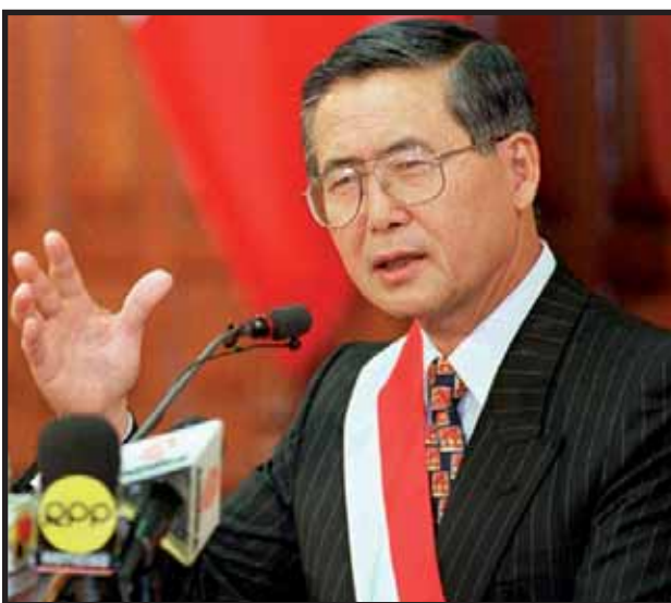
Alberto Fujimori sentó un nuevo precedente con el auto-golpe de Estado

El hecho de que los últimos golpes de Estado, salvo el caso de Haití, no tengan estas características tan brutales, no cambia la naturaleza contrarrevolucionaria de los mismos, ni es una generosa concesión de las burguesías o del imperialismo. La intensidad de la violencia de la burguesía contra las masas