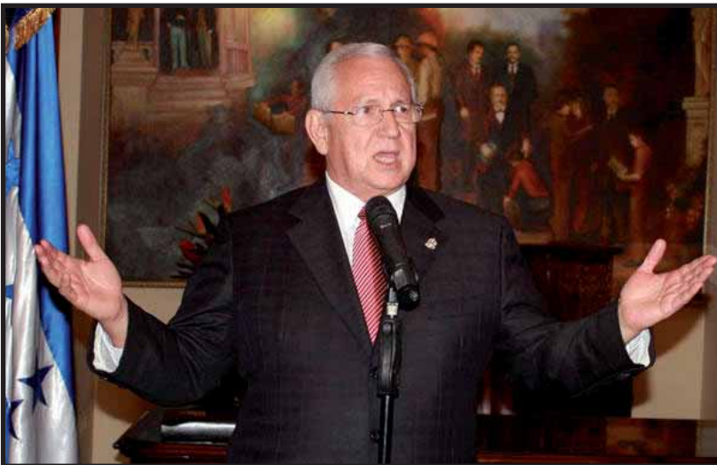
Roberto Micheletti encabezó la conspiración contra el Presidente Manuel Zelaya

Pero a pesar de las incontables diferencias sobre la correlación de las fuerzas sociales entre Perú y Honduras, distintos personajes, complejas situaciones políticas y programas