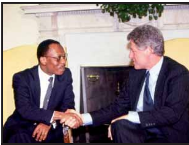
Jean Bertrand Aristide y Bill Clinton en Octubre de 1994

El 5 de abril de 1992, el presidente peruano Alberto Fujimori disolvió ambas cámaras del Congreso que se negaban a concederle amplios poderes, derogando la Constitución de 1979 y convocando a elecciones para elegir una Asamblea Constituyente. Aunque Fujimori podía disolver legalmente la cámara baja, no podía disolver el senado. Este es el más emblemático de los recientes golpes de Estado porque logró imponerse contra el aislamiento internacional creando un nuevo orden constitucional.