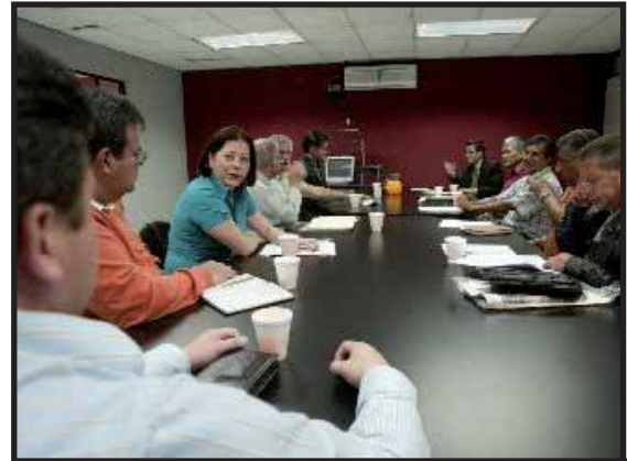
Comisiones Paritarias no logran acuerdo para fijar el Salario Mínimo del 2010

cubra efectivamente las necesidades de la población trabajadora, tomando en cuenta el costo de la canasta básica. Conociendo la costumbre de Colom de doblegarse ante la burguesía, es posible que tome como argumento la crisis económica para no aumentar el salario mínimo. Debemos estar preparados para esta