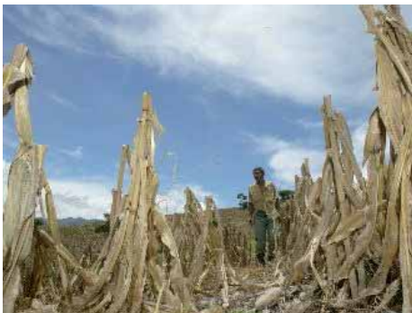
La permanente y mortífera crisis alimentaria.- Guatemala.- Pág.-26

Abajo las Elecciones Antidemocráticas de Micheletti