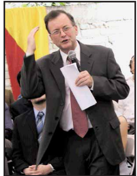
Ottón Solís, líder del Partido Acción Ciudadana (PAC)

El PLN logra por medio de la Sala Constitucional que se apruebe la reelección presidencial. Este procedimiento es viciado por que la Sala no tiene la potestad de cambiar la Constitución. Este hecho empieza a crear fisuras cada vez más grandes entre los sectores. Los hermanos Arias emergen como el más fuerte y logra copar todos los puestos de mando