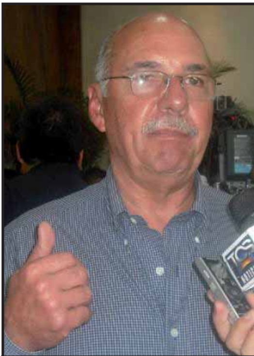
El ex Presidente Alfredo Cristiani ha resucitado en la política como miembro del COENA

La clase trabajadora, campesinos, indígenas y demás sectores populares, quienes dieron su voto de confianza al FMLN tiene exigir que se cumplan las promesas de campaña, que se expulsen a todos los burgueses del gobierno de Mauricio Funes y del FMLN, luchar por un gobierno de trabajadores, campesinos, indígenas y popular y por un programa en beneficio de los mismos. ■