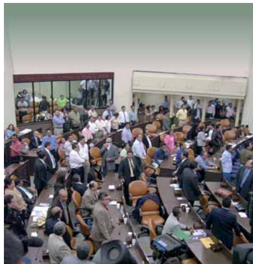
Nuevo Diario 18/02/2010)

Jaime Morales Carazo, ex director de la contra y ahora vicepresidente de la República, en un lenguaje sibilino expuso una crítica abierta a las actuaciones del poder judicial: "Se dan casos vergonzosos en que algunos jueces y magistrados inescrupulosos manipulan impudicamente a una cada vez más desacreditada justicia, inclinando la balanza hacia el lado de los intereses que le ordenan aquellos prepotentes que, con inmunidad e impunidad, hacen uso indebido del poder político o del dinero (...) nos referimos a los que pretenden implantar una dictadura de la judicatura". (El