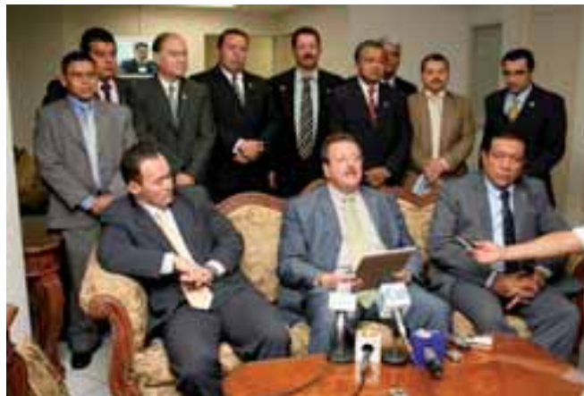
Diputados disidentes de ARENA fundaron el partido GANA, de centro derecha

el golpe de Estado en Honduras, promovido por la oligarquía criolla en complicidad con el imperialismo yanqui, el cual dejó como mensaje que las clase dominantes tradicionales cuando ven amenazados sus intereses promueven estos nuevos golpes de estado, al igual que en los pasados regimenes de dictaduras militares y realizan las alianzas respectivas.