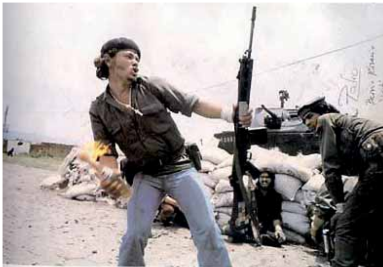
Un miliciano popular se enfrenta al Guardia Nacional de Somoza

Esta vigorosa influencia de la revolución reabrió una vieja discusión entre los socialistas centroamericanos: Los cinco países centroamericanos constituyen, en realidad, una nacionalidad, un sólo país artificialmente dividido en pequeñas "republiquetas" por el naciente imperialismo norteamericano y el colonialismo inglés en el año 1840, fecha en que fue disuelta la República Federada Centroamericana. A mediados