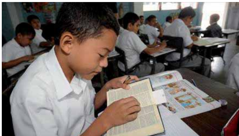
La lectura obligatoria de la Biblia en las escuelas ha generado una agria polémica

La comunidad educativa ante tan clara imposición respecto a esa decisión inconsulta se muestra en completo desacuerdo y las razones son sobradas por que esta ha sido una decisión inconsulta como en otras ocasiones y demuestra el alto grado de autoritarismo de los partidos conservadores ultraderechistas quienes se han caracterizado por aprobar medidas impopulares e inconsultas que poco o nada benefician a la población y que harán más daño que beneficio a la comunidad educativa y estudiantil de todo El Salvador ya que tenemos