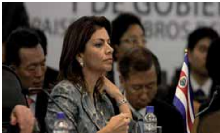
Laura Chinchilla y la Asamblea Legislativa aprobaron el ingreso de la flota imperial

La presencia de la flota norteamericana en aguas de Costa Rica nos hace recordar que la