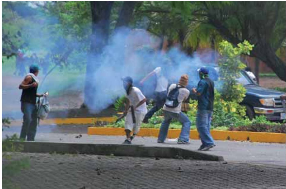
Entrentamientos a morteros para copar la dirección estudiantil

La única forma de frenar la descomposición que se vive dentro del movimiento estudiantil es