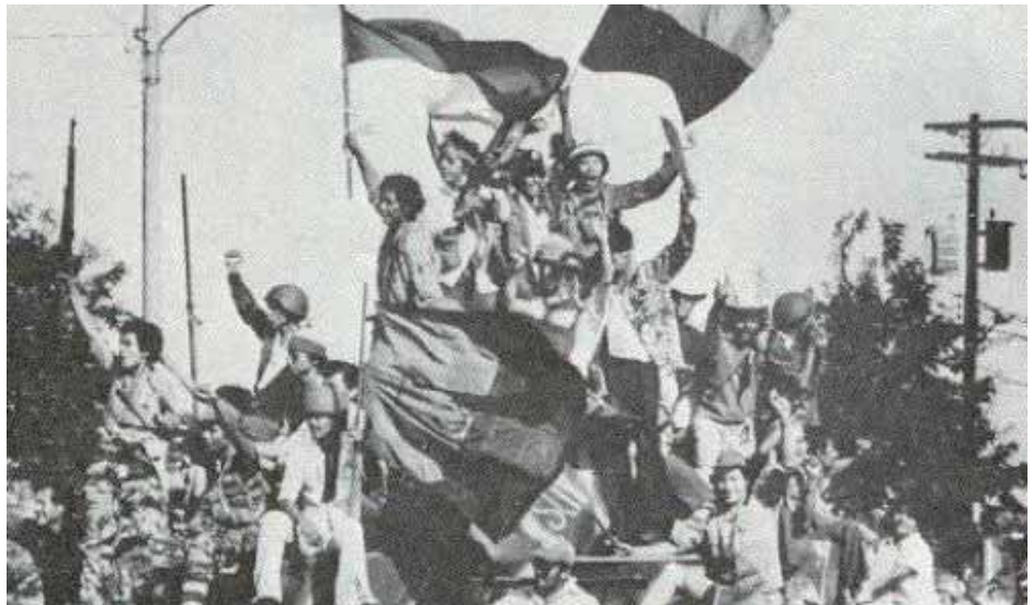
Las masas insurrectas celebran el triunfo militar sobre la dictadura

La contradicción existente entre el gobierno de Unidad Nacional, por un lado, y el desarrollo de los embrionarios organismos de poder de las masas, por el otro, provocaron grandes conflictos en los