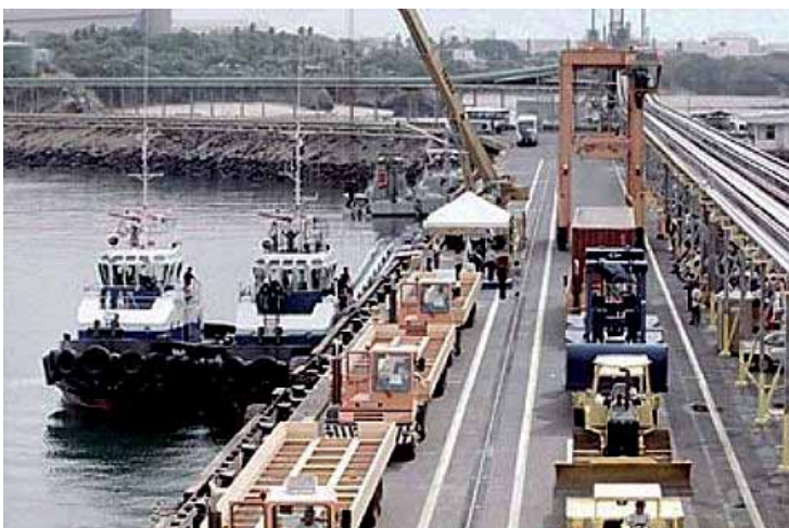
El PSOCA llama a luchar por la estatización y el control obrero en el puerto de Acajutla

Portuaria Autónoma (CEPA) acaba de contratar los servicios de estibadores a tres empresas creadas por los afiliados al STIPES. Entre estas empresas están: Estibadores de El Salvador S.A. de C.V. (Estisal) , Empresa Salvadoreña Portuaria de Acajutla S.A. de C.V. (Espac) y Servicios Portuarios Salvadoreños S.A. de C.V. (Serposal) . De esta forma, empresas que en las administraciones areneras habían monopolizado dicho comercio se vieron relegadas mostrando