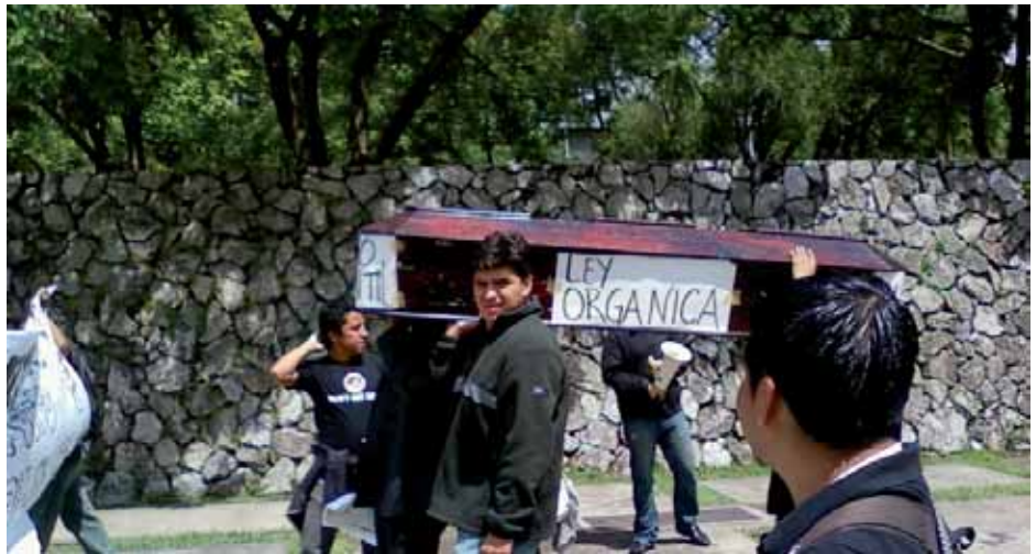
Jornada de protesta en la USAC

Éstas han sido medidas de presión para la restitución de los derechos despojados y hasta ahora sin mayor efecto. El paro de los 11 días en el Campus Central, Centro Metropolitano Universitario y Centros Regionales, es reflejo del descontento por la manera como las autoridades han decidido llevar la Universidad por donde les conviene, haciendo a un lado la opinión de tantos profesionales, catedráticos y estudiantes, de nuestro gobierno TRIPARTITO, sin mencionar