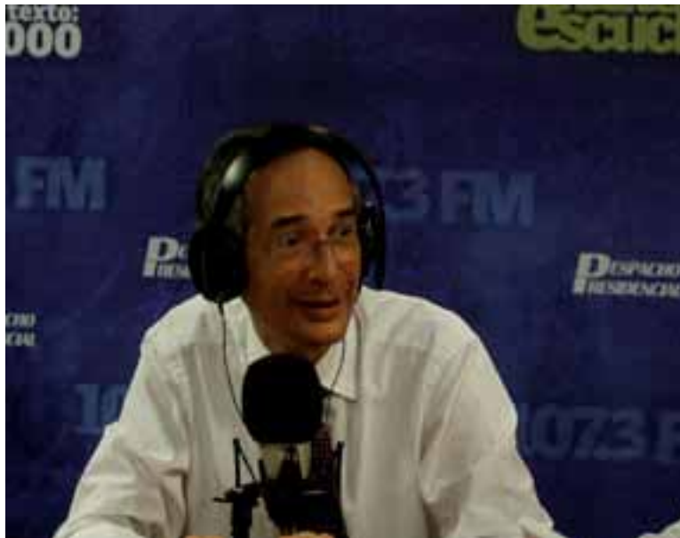
Alvaro Colom ha denunciado una conspiración para desestabilizar a su gobierno

La prensa burguesa, las organizaciones patronales y los grupos de la sociedad civil al servicio de la oligarquía salieron defendiéndose de que esta es una ofensiva del gobierno