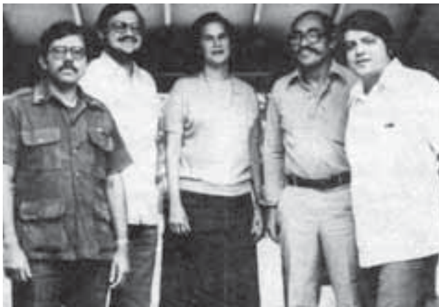
La primera Junta de Gobierno: Daniel Ortega, Alfonso Robelo, Violeta Chamorro, Moises Hassan y Sergio Ramirez Mercado

La disolución de las milicias populares, embrionarios organismos de poder de las masas, y la creación de la Policía y el Ejército regular, dos clásicas instituciones del estado burgués, al servicio del gobierno burgués de Unidad Nacional, fue posible por la combinación de dos factores: por un lado, la represión a las corrientes revolucionarias que se opusieron al desarme y, por el otro, la enorme credibilidad política de las masas en el FSLN. Todo ello debilitó a los organismos