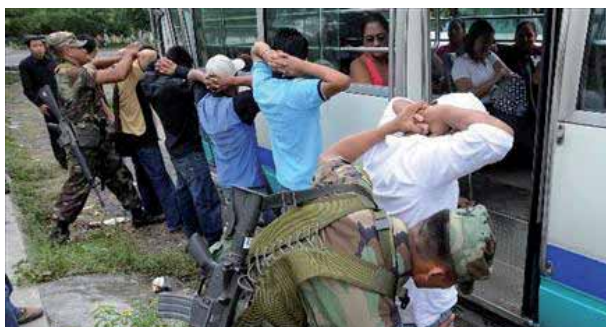
Cateos en la vía pública

El actual gobierno de Mauricio Funes y del FMLN continua actuando de forma negligente de igual manera como lo hicieron los gobiernos areneros ya que cuenta con todo el aparataje de la inteligencia del Estado OIE, inteligencia policial, etc para poder combatir a la delincuencia pero no lo realiza en donde todo apunta que se pretende continuar utilizando este flagelo de los asesinatos, inseguridad y del temor de la población con fines políticos electorales, el cual posiblemente será explotado por estos dos partidos de ARENA y del FMLN y demás partidos en las próximas elecciones.