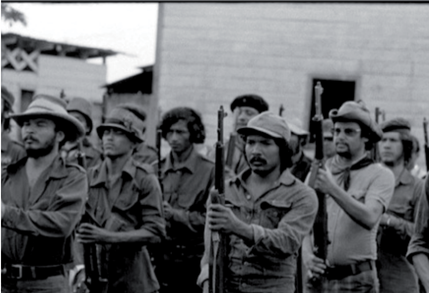
El FSLN controló buocráticamente los organismos de masas y se apoyó en ellos en su lucha contra la burguesía y el imperialismo

En la medida en que el imperialismo norteamericano intensificó sus ataques contra la revolución nicaragüense, el FSLN, para poder mantener su proyecto de colaboración de clases, extendió su control burocrático a todos los sindicatos y organizaciones de masas, a todos los aspectos de la vida política y social, capitalizando los sentimientos antiimperialistas de las masas y fortaleciendo relativamente su régimen político bonapartista sui generis. ■