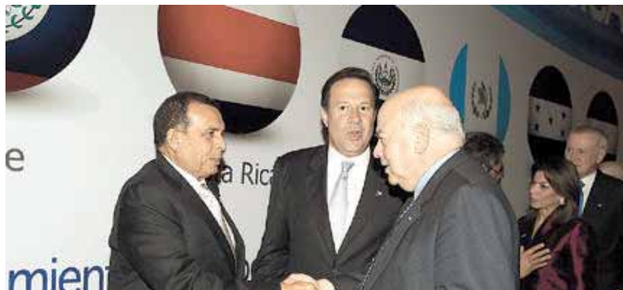
El reingreso de Honduras en la OEA es el capitulo final del golpe de Estado

La mayoría de hondureños reconocen el papel mediador de la OEA en el conflicto. Lejos de imponer duras sanciones y arremeter con las violaciones profundas a los derechos humanos, José Miguel Insulza fue fiel colaborador de la política trazada por el departamento de Estado de los Estados Unidos, que no era más que dilatar el proceso a través de las negociaciones para obtener todo el tiempo posible, cansar a las masas en resistencia y blanquear el golpe de estado a través del proceso electoral. Cabe señalar, que todos los intentos de restablecer el orden constitucional a través del dialogo se vieron truncados, el mismo Zelaya resulto engañado de un proceso amañado. Lo obtenido de este proceso de negociación, por cierto ampliamente jerarquizado por el Ex Presidente fue su exilio y la derrota pacífica de las masas en resistencia.