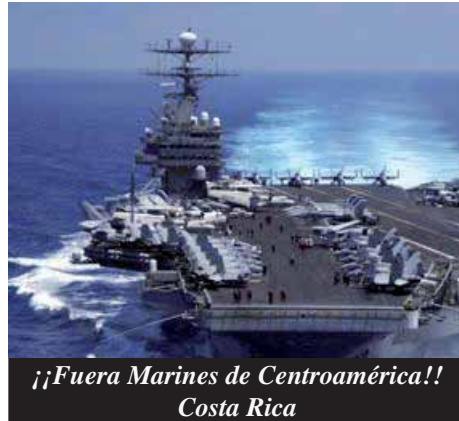
¡¡Fuera Marines de Centroamérica!! Costa Rica