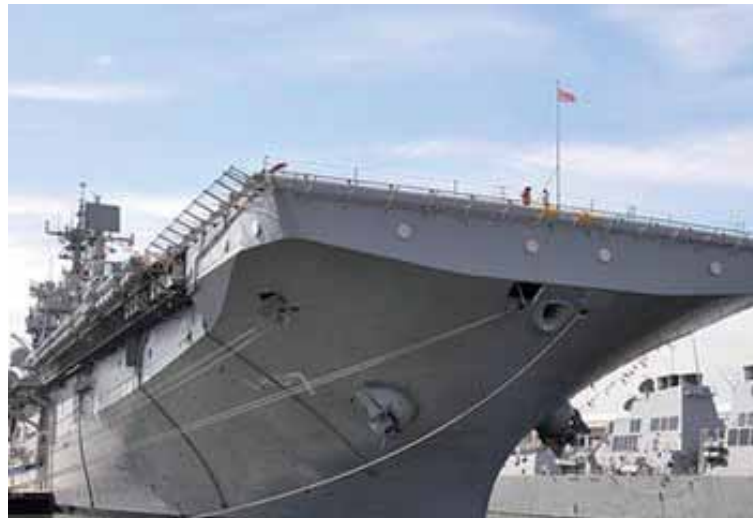
La flota norteamericana en las costas cenbntroamericanas

Unidos por medio de la creación de la necesidad de bases en el territorio colombiano y la destrucción operativa de las FARC. Los golpes efectuados por el ejército colombiano a la estructura de las FARC han sido un trabajo de inteligencia que sólo puede