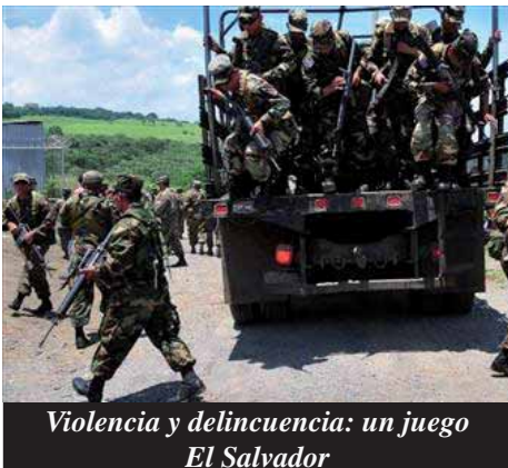
Violencia y delincuencia: un juego El Salvador

PANAMÁ: ¡¡POR LA DEROGACIÓN DE LA LEY N° 30!! ¡¡PAREMOS LA REPRESIÓN DEL GOBIERNO DE MARTINEZ!!