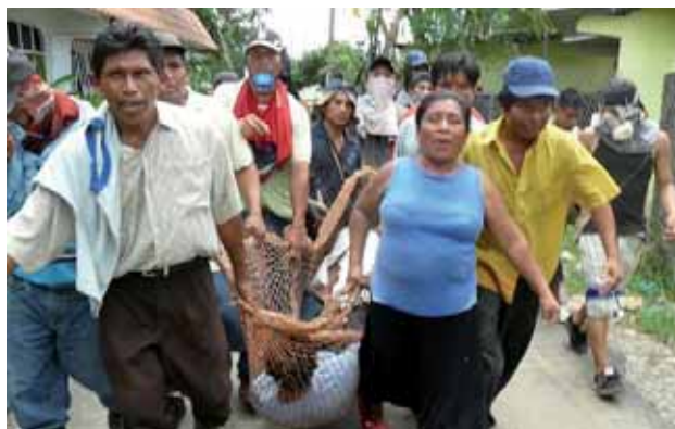
Heridos por la represión en Changuinola

Desde mediados de junio, comenzó la repuesta popular, la que fue intensificándose al pasar los días.