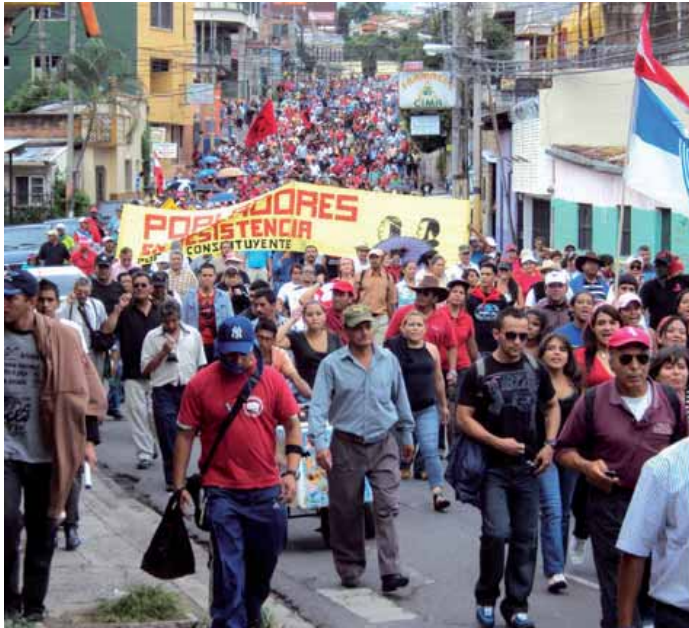
El FNRP es la conquista política y organizativa más importante del pueblo hondureño en las últimas décadas

Hacer frente a la realidad abiertamente; no buscar la línea de menor resistencia; llamar a las cosas por su nombre; decir la verdad a las masas, por amarga que sea; no temer a los obstáculos; ser valiente cuando llega la hora de la acción, tales son las normas que deben de imperar en la organización que aspiramos. ■