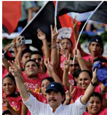
Daniel Ortega, saluda a sus partidarios en la Plaza

Este año, el acto del 19 de Julio no fue utilizado para atacar a la dispersa oposición burguesa, mucho menos al imperialismo norteamericano, sino que sirvió para rendir un informe sobre los logros del gobierno sandinista. Daniel Ortega se mostró satisfecho