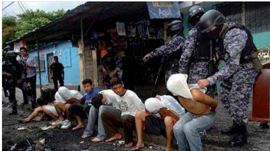
Las maras constituyen un fenómeno social

De esta forma la ultraderecha arenera presentaba una respuesta a una de las principales necesidades de la población, lo que sería de gran utilidad en los eventos electorales; en el siguiente gobierno arenero de Tony Saca quien anunció un nuevo plan llamado plan de la Super mano dura, siendo estos planes utilizados por el partido de derecha como su plataforma para mantenerse en el poder. Fue bajo el plan de la súper mano dura donde las pandillas lograron dar el salto hacia el crimen organizado y el narcotráfico desarrollando a la vez una