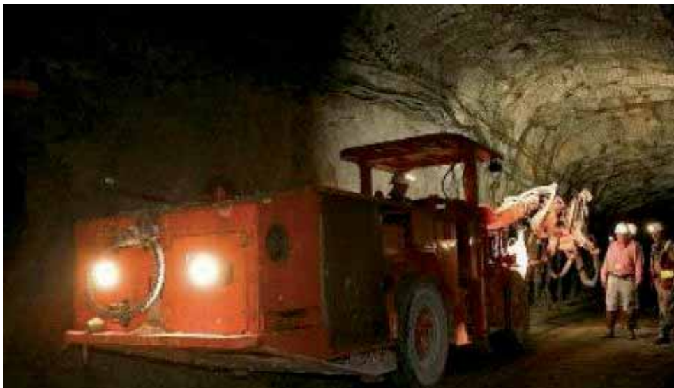
Actividades en la Mina Marlin

En cuanto a la recomendación de la CIDH de garantizar la vida y la integridad física de los miembros de las 18 comunidades cercanas a la mina, el gobierno afirmó que