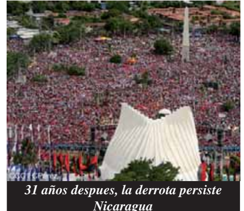
31 años después, la derrota persiste Nicaragua