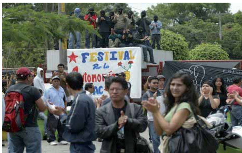
Integrantes de EPA en pie de lucha, a la entrada de la USAC

lugar la petición presentada por los estudiantes, dejando el camino libre al Consejo para convocar a elecciones, por primera vez sin la participación estudiantil. Por otro lado, la mesa de diálogo formada para resolver otras demandas nunca funcionó. Los miembros del CSU realizaron una serie de maniobras dilatorias y finalmente declararon que los acuerdos a que se llegara no serían vinculantes, los que constituye una burla y una total falta de respeto hacia lo acordado con la EPA. Esto impulsó a los estudiantes a cerrar la Universidad.