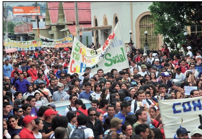
Movilizaciones por el 13% para el FEES en COSTA RICA

¡¡Apoyo total a la lucha de EPA!! ¡¡Huelga General para derrotar la intrasigencia de Pepe Lobo!! ¡¡Huelga en las universidades para obtener el 13% para el FEES!!