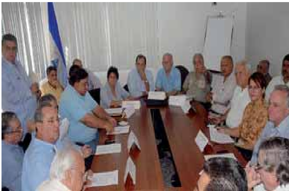
Las cúpulas partidarias de la oposición burguesa en el fondo nunca quisieron elecciones primarias

El gobierno de Arnoldo Alemán (1997-2001) no logró construir un grupo económico sólido alrededor del PLC, a lo sumo pudieron enriquecerse el propio Alemán y su grupo más cercano, pero no logró crear a un nuevo sector burgués o fortalecer a alguno ya existente. Al contrario, Alemán entró en profundas contradicciones con sectores tradicionales de la burguesía, sumamente debilitada por las expropiaciones durante la revolución (1979-1990), quienes le