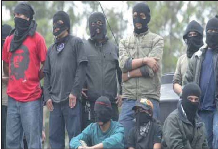
EPA contra la privatización de la USAC en GUATEMALA

"Por la Reunificación Socialista de la Patria Centroamericana"