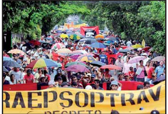
Huelga en defensa del Estatuto Docente en HONDURAS