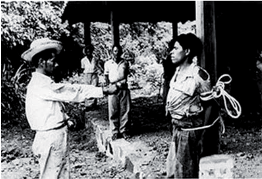
Captura y fusilamiento de agraristas en 1954

En los últimos días el boque legislativo Libertad Democrática Renovadora (LIDER) propuso retomar el tema de la aplicación de la pena de muerte en nuestro país, esto según ellos para reducir los altos índices de violencia que azotan