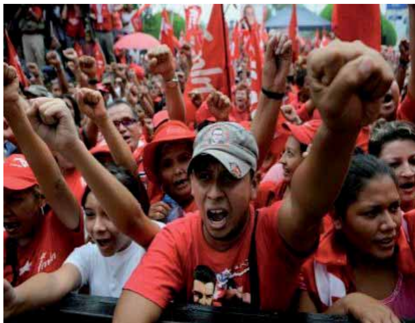
El FMLN se ha convertido en uno de los pilares del bipartidismo, excluyente y antidemocrático

En el año 2009, Félix Ulloa hijo, ex Presidente del Tribunal Supremo Electoral (TSE) , interpuso ante la Sala de lo Constitucional de la Corte Suprema de Justicia, una nueva demanda de inconstitucionalidad argumentando que una interpretación errónea del artículo 85 de la Constitución de 1983 "ha generado un monopolio