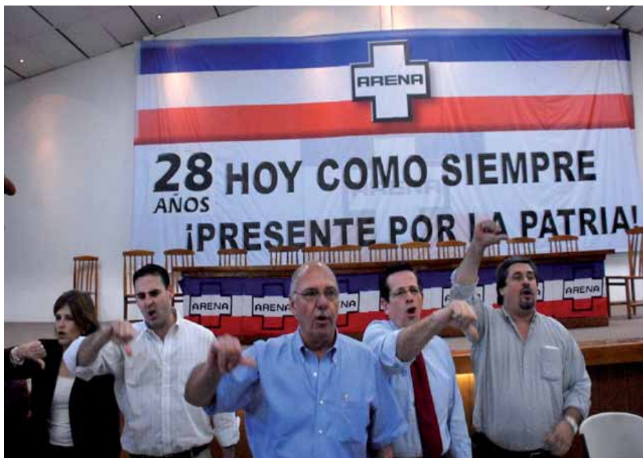
El otro pilar es ARENA, un partido de origen fascista

Por ello, como algo excepcional, se han arriesgado a utilizar mecanismos democráticos para evitar que el FMLN una vez en el gobierno logre mantenerse por un largo periodo y que