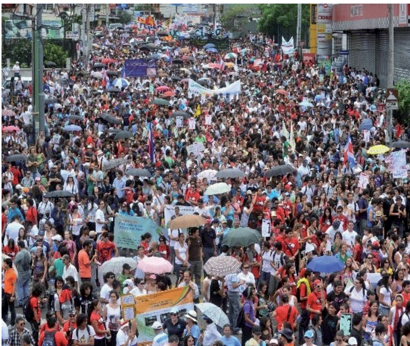
Panorámica de la gigantesca marcha del 17 de Agosto

de 10,000 personas, una de las marchas universitarias más grandes en los últimos años. Al día siguiente, la