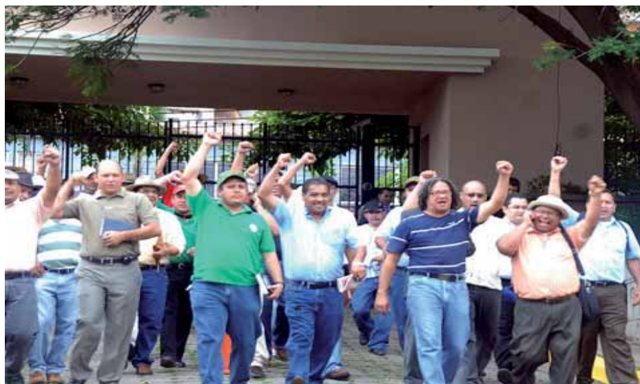
La dirigencia magisterial sale de una ronda de negociaciones

En el gobierno de Mel Zelaya -en el 2006- se llegó a un acuerdo salarial entre el gobierno y el magisterio, el acuerdo se cumplió en su totalidad. Sin embargo, toda la maquinaria golpista comenzó a funcionar desde el