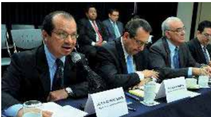
Magistrados de la Sala Constitucional