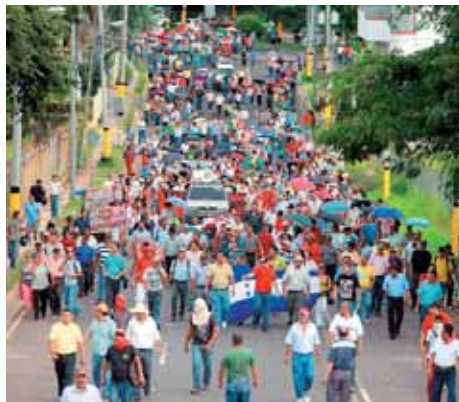
El Magisterio sigue siendo la vanguardia de las luchas

su incapacidad de poder hacerle frente a la epidemia del dengue, por cierto enfermedad que ha superado las cifras de normalidad y ha logrado cobrar la muerte de cientos de hondureños es una de las tantas debilidades del engendro representado por Lobo. Así mismo, los distintos institutos de previsión, por cierto saqueados por los gobernantes de turno o las autoridades, no se les ha otorgado los desembolsos correspondientes. Tal es el caso del INPREUNAH y del