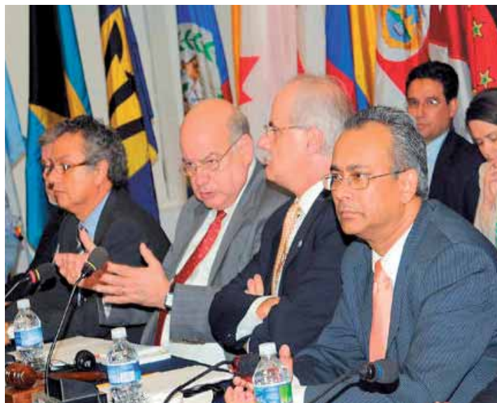
A pesar de las violaciones a los derechos humanos, la OEA prepara el pleno reconocimiento del gobierno de Pepe Lobo

manifestara en declaraciones dadas en Tocoa, Colón, "...no se puede tener a un país aislado, eso no está bien..." "...no es a un presidente que se aísla, es a un pueblo...los miembros de la OEA deben poner muy por debajo las diferencias ideológicas o de otro tipo y darle paso al pleno y justo derecho que tiene el pueblo hondureño de ser parte a una organización que nos agrupa a todos los americanos". (El Tiempo,