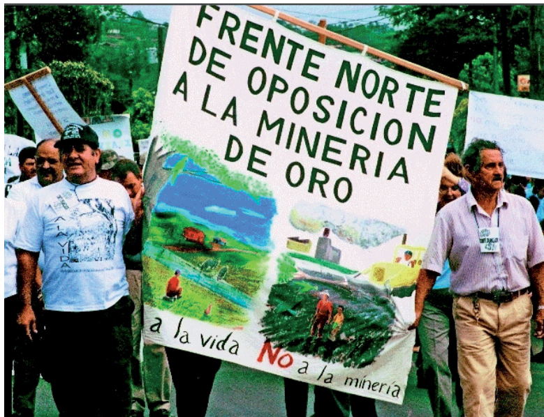
Siguen las movilizaciones contra la concesión minera en Las Crucitas

Desde el Partido Socialista Centroamericano (PSOCA) insistimos en la necesidad de crear la más profunda unidad de acción con todos los sectores de izquierda, sindicales, ambientalistas y otros luchadores para enfrentar a este gobierno que busca destruir todas nuestras conquistas. ■