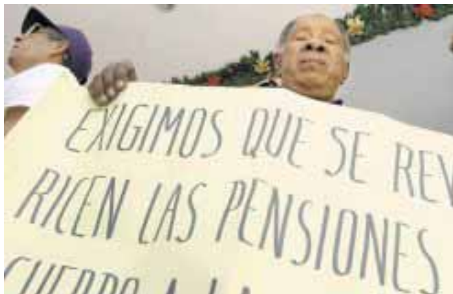
Los jubilados luchan por la revalorización de sus pensiones

Bajo las administraciones de Violeta Chamorro (1990-1997) , Arnoldo Alemán (1997-2002) y Enrique Bolaños (2002-2007) los acuerdos con el FMI fueron estables, salvo en los periodos preelectorales, ya que los gobiernos de turno gastaban los pocos recursos en crear una falsa ilusión antes las masas, de que las cosas habían mejorado, creando un colchón social para alguno de los candidatos.