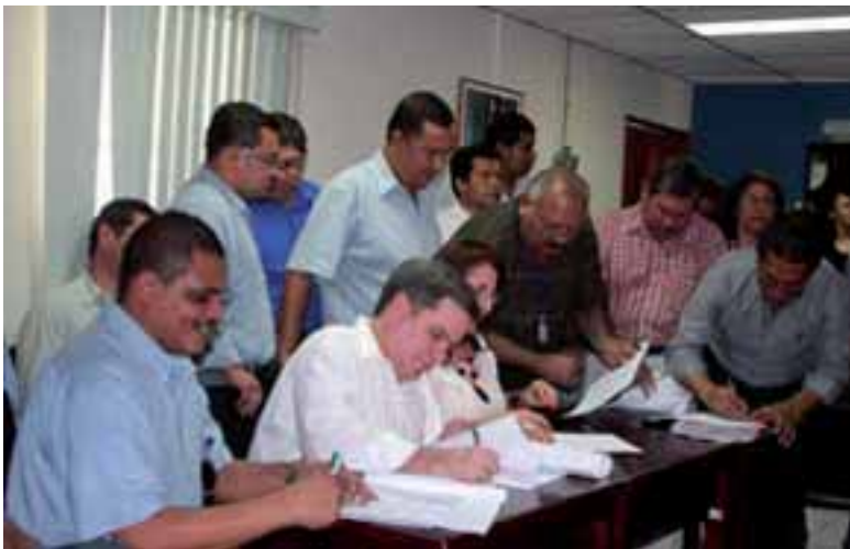
Comisión del Salario Mínimo firma el aumento miserable del 6%

la boca hablando de los derechos de los trabajadores y de su gobierno "socialista y solidario", este mueve a sus peones para que le sigan el juego a la empresa privada y proteger de esta forma sus negocios e inversiones. El Frente Sandinista ya no es un partido de izquierda, ha dejado de luchar por los trabajadores para convertirse en la creciente burguesía nicaragüense, son dueños de empresas, gasolineras y hoteles, y trata de mantener su periferia y sus bases con un discurso