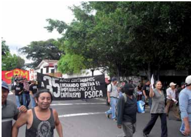
Un contingente del PSOCA participó combativamente en la marcha del 30 de Julio

Este año al conmemorar los 35 aniversarios la marcha conmemorativa logro llegar hasta el centro capitalino en donde se tenía previsto llegara en 1975.