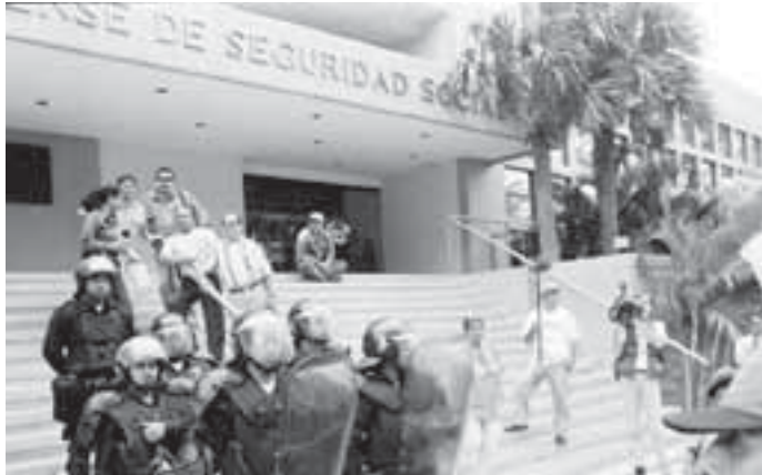
Protesta contra el primer intento de privatización del INSS en el año 2000

surrealista, las declaraciones optimistas de los altos funcionarios sandinistas se contradicen con las preocupaciones del FMI. En una reciente reunión con la cúpula empresarial, Gabriel Di Bella, representante del Fondo Monetario Internacional (FMI) en Managua, indicó Nicaragua continuaba retrasada en la lucha por la reducción de la pobreza.