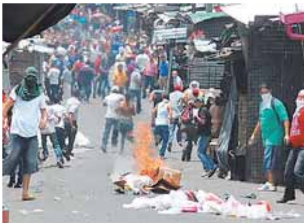
Los vendedores ambulantes se han enfrentado a la Policía

lo que ha llevado a muchos hombres y mujeres sean estos niños, jóvenes y adultos a buscar alternativas para poder sobrevivir una de estas ha sido el dedicarse a la actividad comercial no formal o como popularmente se le conoce vendedores informales; quienes realizan su actividad comercial en las principales calles y avenidas del gran San Salvador y demás áreas urbanas de los demás departamentos y municipios ya sea de manera estacionaria o