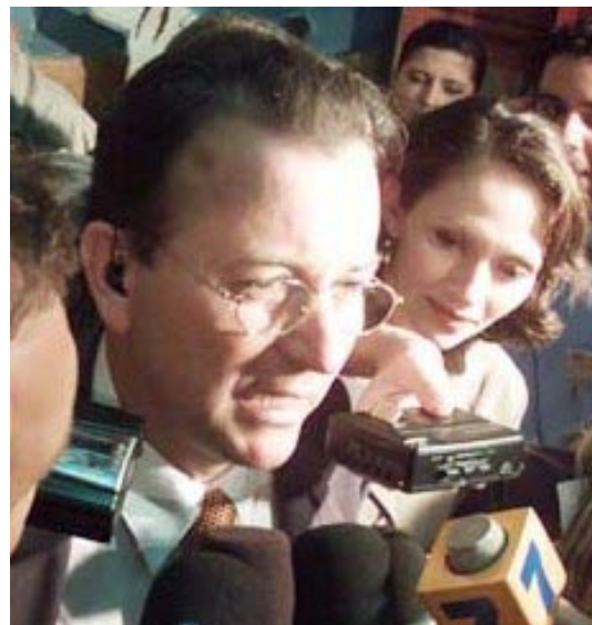
Ottón Solís candidato del Partido Acción

El Partido Revolucionario de los Trabajadores (PRT) llama a todos los trabajadores, campesinos, estudiantes y otros sectores populares a profundizar la crisis de los partidos burgueses (PUSC y PLN), no asistiendo a votar ni por Pacheco ni por Araya, el próximo 7 de Abril. Estos candidatos fueron rechazados en las elecciones de febrero. El sistema burgués lo que quiere es que salgamos a votar por estos políticos decadentes y corruptos, para legitimar todas las medidas antiobreras y hambreadoras que nos impondrán cuando lleguen al poder. Hacemos un llamado a todos los sectores antes mencionado a organizar la lucha contra el próximo gobierno, ya que