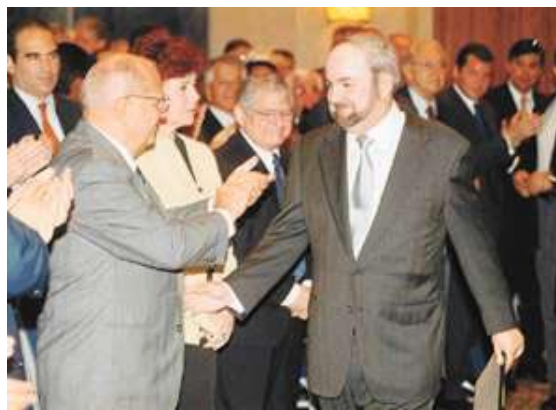
El presidente Enrique Bolaños aplaude de manera entusiasta la entrada del multimillonario Carlos Pellas, quien le financió la campaña electoral

El PLC y la figura de Arnoldo Alemán emergieron de las profundidades de la sociedad nicaragüense, enormemente empobrecida por la agresión imperialista, la guerra civil en el periodo 1982-1990 y por la desastrosa gestión económica del FSLN. Estas masas empobrecidas votaron por un