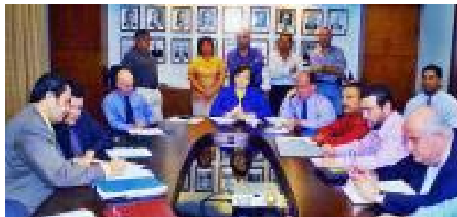
• Sindicalistas del ICE reunidos con el gobierno

Con la directriz señalada, y según el Ministro de Hacienda Jorge Walter Bolaños, el gobierno busca una reducción en el déficit fiscal del sector pú-