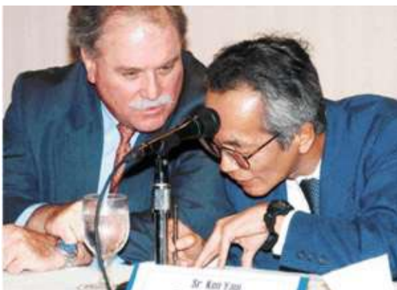
• Los directores del FMI que llegaron a ponerle un ultimátum a los diputados de la Asamblea Nacional.

Los diputados del FSLN y del PLC coincidieron en quitarle fondos del Banco Mundial al Instituto Nicaragüense