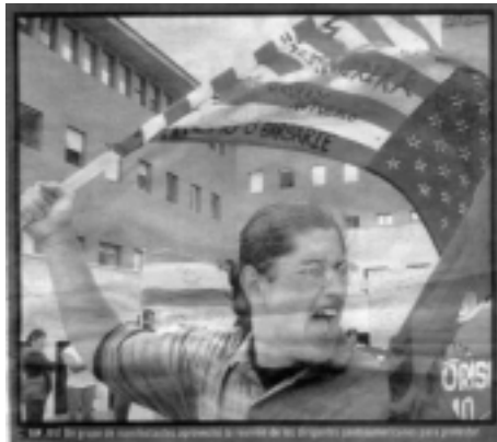
• Las protestas contra el CAFTA iniciaron en Costa Rica y se extienden lentamente al resto de Centroamérica

leguminosas, maní, papas, lana, algodón, miel, naranjas, lácteos y algunas frutas, implique la ruina de una parte de sus agricultores. Los Estados Unidos han dado muestras claras que están dispuestos a discutir el problema de los subsidios en la agricultura, pero no en la mesa de negociaciones del CAFTA, sino en el marco de la Organización Mundial de Comercio (OMC) .