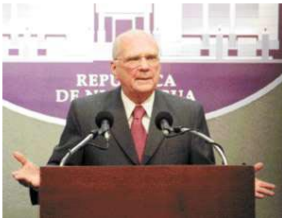
• El presidente Enrique Bolaños anuncia el veto parcial a la ley de presupuesto.

La discusión sobre el veto del presidente Bolaños abrió la caja de Pandora. Enorme sorpresa se llevó la población al enterarse que los bancos no pagan el impuesto sobre la renta (IR), a pesar de