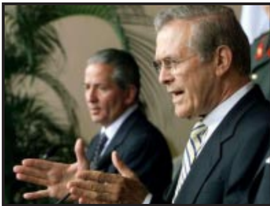
• Secretario de Defensa de los Estados Unidos, Donald Rumsfeld

El movimiento popular centroamericano debe exigir a los gobiernos de la región el inmediato regreso de las tropas que se encuentran en Irak, la ruptura de los acuerdos militares con EE.UU. y la salida de todos los soldados, agentes de la DEA, asesores y demás agentes encubiertos del imperialismo de Centroamérica.