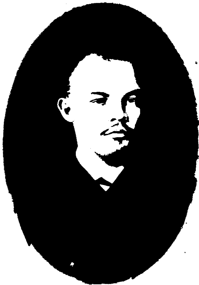
V. I. LENIN