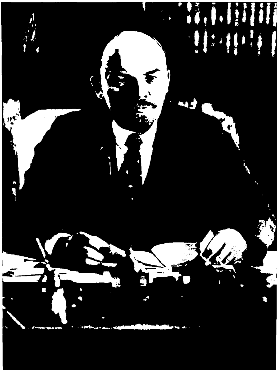
V. I. LENIN