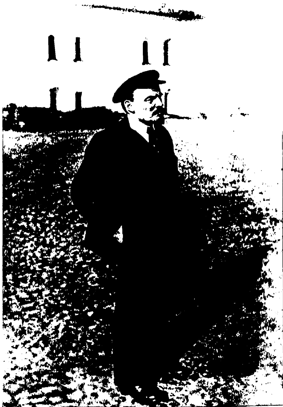
V. I. Lenin paseando en el patio del Kremlin convaleciente después de la herida. Octubre de 1918